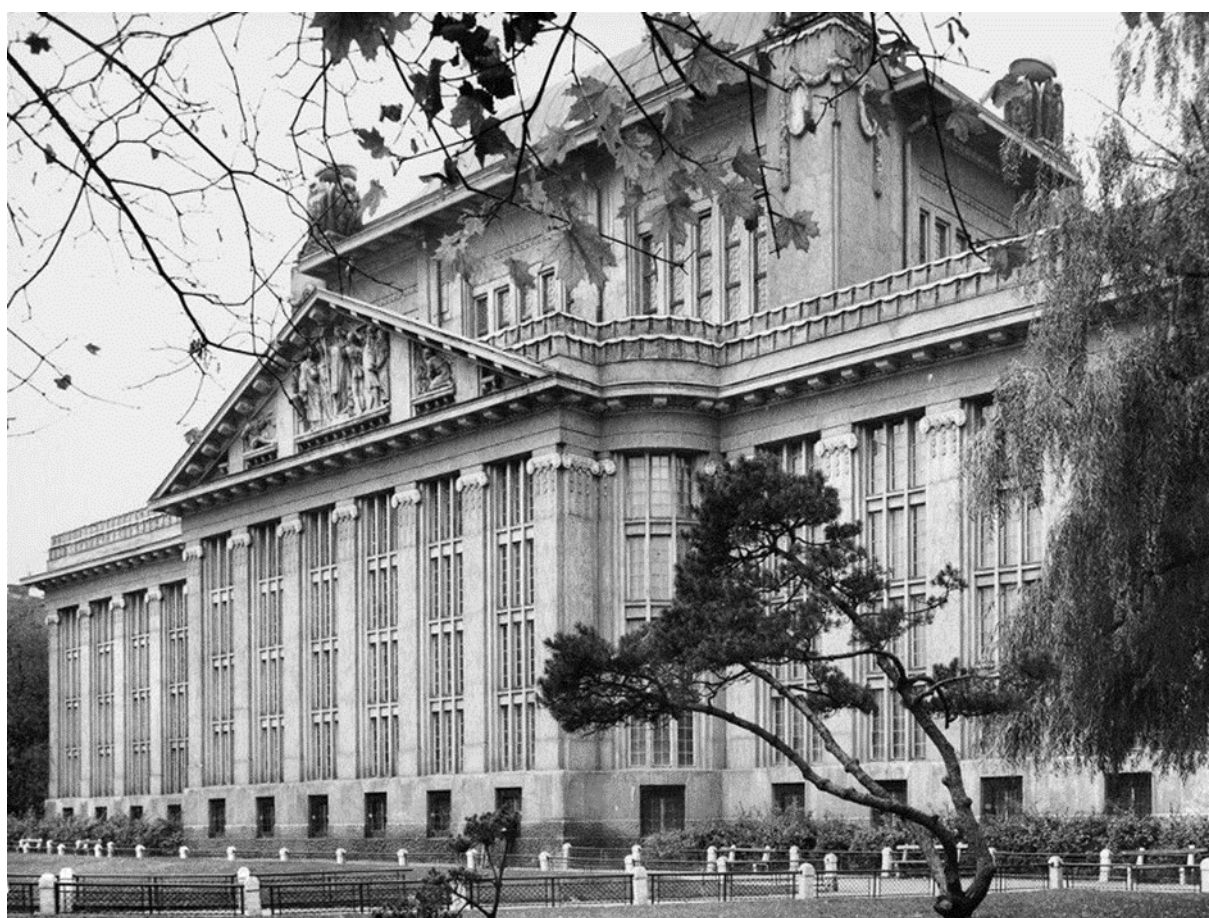
Slika 1. Hrvatski državni arhiv u Zagrebu. 2

Arhivi su u prošlosti (od srednjeg vijeka pa do kraja 18. stoljeća) bili mjesta (ili službe) gdje se čuvaju važni dokumenti. Kao takva mjesta, arhivi su prvenstveno bili vezani uz ideju da se određeni dokumenti čuvaju kao sredstvo za zaštitu određenih interesa ili jednostavno kao dokaz pojedinih prava. Baš zato što sadrži imovinska, staleška ili politička prava (interese), to gradivo tj. „arhiv” je bio nešto poput riznice, a uloga arhivista bila je slična ulozi rizničara; štitio je prava vlasnika arhiva istražujući i sakupljajući važnu dokumentaciju ne bi li pronašao nešto od velikog značaja, te spremno na to upozorio. 1