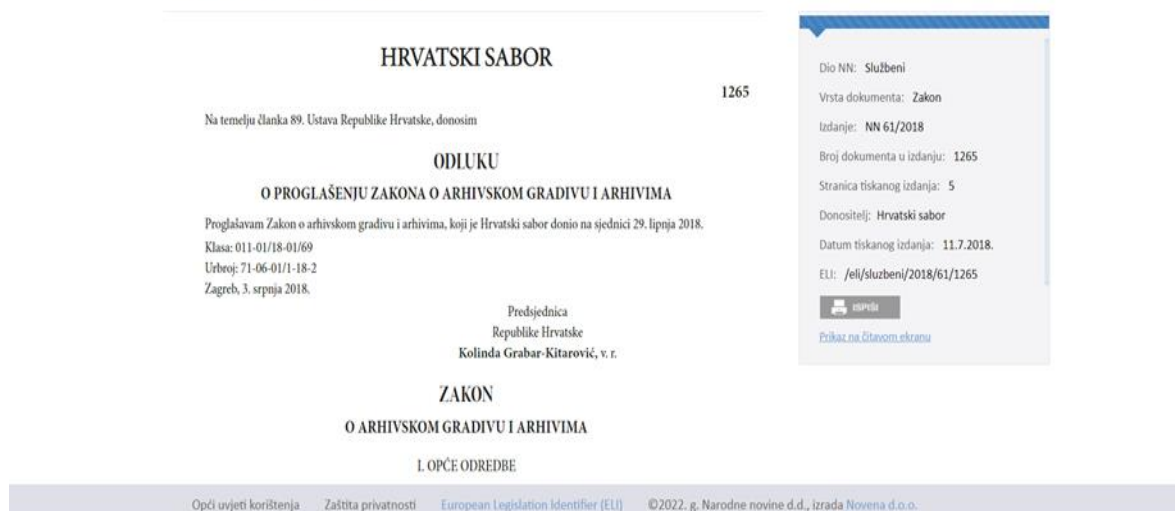
Slika 3. Zakon o arhivskom gradivu i arhivima. 31

Djelatnost državnih arhiva vezana uz brigu nad gradivom kod stvaratelja definirana je člankom 32. Zakona o arhivskom gradivu i arhivima (61/2018, 98/2019) koji navodi da je Hrvatski državni arhiv nadležan za dokumentarno i arhivsko gradivo nastalo radom stvaratelja dokumentarnog i arhivskoga gradiva koji su djelovali ili djeluju na čitavom ili većem dijelu područja ili imaju značenje za Republiku Hrvatsku. Područni državni arhivi nadležni su za dokumentarno i arhivsko gradivo nastalo radom stvaratelja dokumentarnog i arhivskoga gradiva koji su djelovali ili djeluju na području jedinica lokalne i područne (regionalne) samouprave. Arhivi jedinica lokalne i područne (regionalne) samouprave nadležni su za javno dokumentarno i arhivsko gradivo koje je nastalo djelovanjem ili je u posjedu tijela jedinica lokalne i područne (regionalne) samouprave te javnih ustanova i drugih pravnih osoba čije su one osnivači ili vlasnici. 32