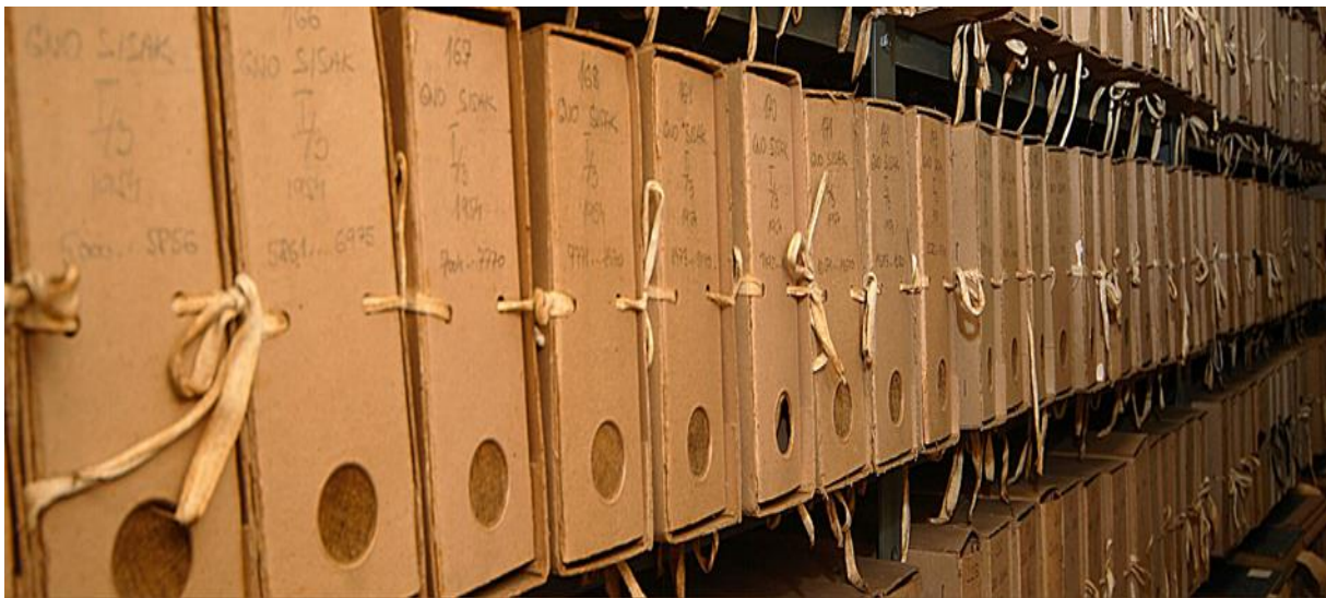
Slika 7. Gradivo u spremištu. 56

Među najveće probleme suvremenog razvoja arhivske službe uvijek se ubraja sve veća produkcija arhivskog gradiva, kao i pojava novih nositelja informacija (nekonvencionalna gradivo). Ta veza između službe arhiva s institucijama zahtijeva ne samo teorijsku obradu, već i praktičan pristup u rješavanju različitih problema (praćenje stvaranja i prestanka rada nekih institucija, a naročito vrednovanje njihovog gradiva u nastajanju). 55