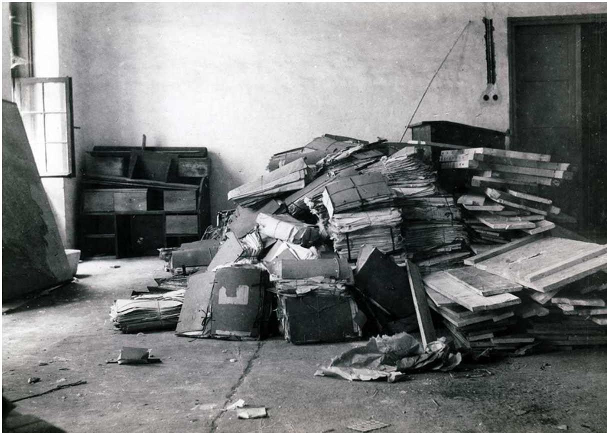
Slika 2. Gradivo u neprimjerenim uvjetima. 14

U 20. stoljeću arhivi postaju sve otvoreniji stručnoj i široj javnosti, odnosno društvu. Za taj proces najzaslužniji su razvoj tehnologije, procesi globalizacije tj. modernizacija. Suvremeni arhivi djeluju kao institucije s različitim područjima poslovanja (upravnim, znanstvenim, kulturnim i uslužnim). Postaju zaduženi za čuvanje i zaštitu, ali i obradbu te upotrebu arhivskog gradiva, prvenstveno iz područja državne i pravne uprave. 15