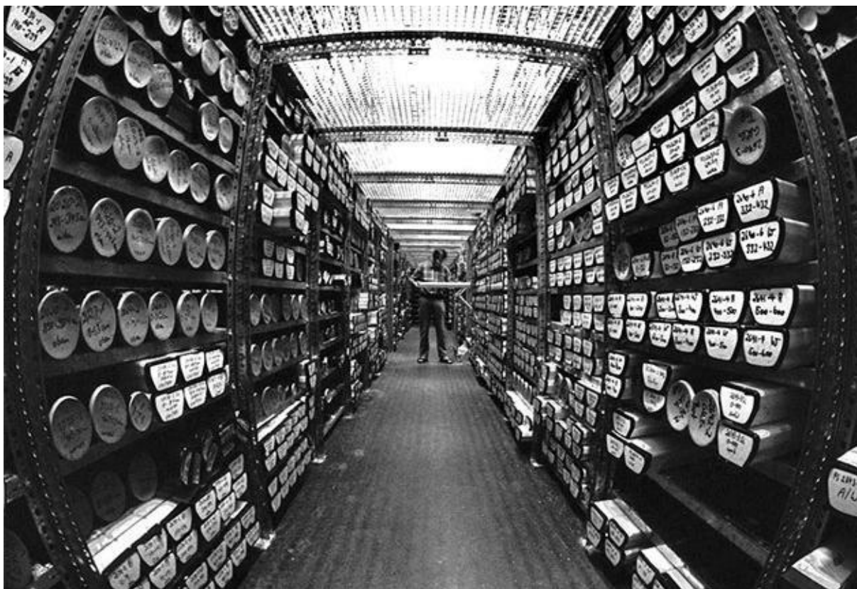
Slika 6. Pohrana gradiva. 52

Gradivo nastaje iz potrebe stvaratelja tijekom obavljanja nekog posla. Kada stvaratelj radi na nekom predmetu, sakupit će sve dokumente koji imaju bilo kakvu povezanost s tim predmetom dok ga ne završi. Isto tako istraživač prilikom nekog istraživanja vrlo brižno pazi na dokumente koji su mu od velike važnosti za projekt ili istraživanje. Kada stvaratelj završi sa predmetom na kojem je radio, uhvatit će se nečega drugoga, te mu prijašnja dokumentacija neće u tolikoj količini trebati ili će potreba za njom u potpunosti prestati. Sada se razlog nastajanja i razlog čuvanja razilaze, te se odlučuje o sudbini dokumentacije. Doduše, stvaratelj ne mora nužno gledati samo na aktualnost i aktivnost određenog predmeta već i na širi kontekst svog poslovanja. Neki predmeti ili spisi mogu biti od krucijalne važnosti za organizaciju i formuliranje odluka, te planiranje i strukturiranje djelatnosti i poslovanja. Isto tako još jedan razlog čuvanja gradiva se nalazi u izvoru informacija koje ono sadrži. Stvaratelj ponekad čuva