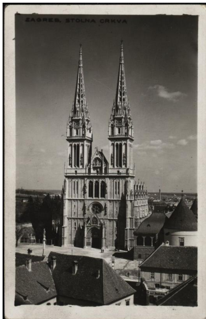
Slika 2. Katedrala nakon rušenja zapadnog obrambenog zida s Bakačevom kulom. Između katedrale i kule Nebojan vidljiva Bolléova prigradnja Nadbiskupskom dvoru