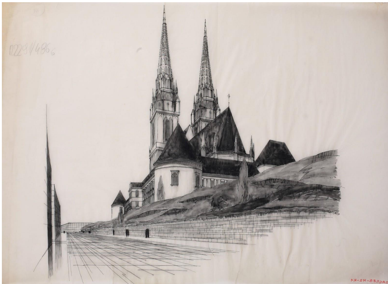
Slika 8. Regulacija Kaptola Ede Schöna i Milovana Kovačevića, pogled na katedralu iz Vlačke ulice