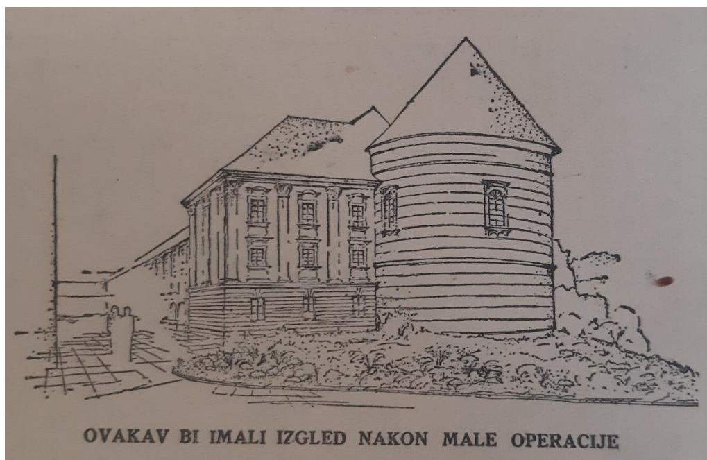
Slika 6. Planirani izgled Bolléove prigradnje Nadbiskupskom dvoru prema privremenoj regulaciji Kaptola iz 1933. godine

Što se tiče financijskog aspekta cijele priče, Zemljak na samom kraju teksta poručuje Koreniću kako će bilo kakvi radovi obradovati nezaposlene kojima se ionako ne može „izmisliti rada ni zarade“ 127 , odbacujući time njegovu zabrinutost o uzaludnom trošenju.