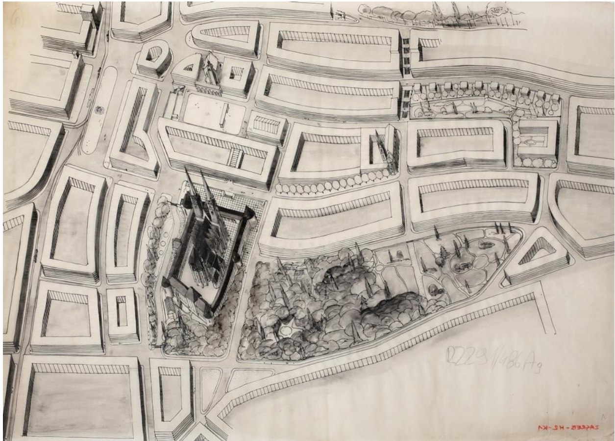
Slika 7. Regulacija Kaptola Ede Schöna i Milovana Kovačevića

Misao vodilja ove regulacije je otkrivanje pogleda i naglašavanje katedralnog kompleksa te rješavanje problema vezanih uz promet. Uključuje probijanje novih ulica i proširivanje postojećih te, možemo reći, radikalna rušenja starih kuća za koje autori smatraju kako nemaju arhitektonsku vrijednost.