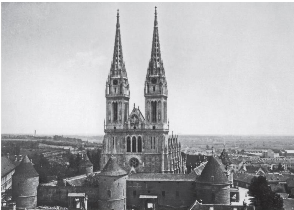
Slika 1. Restaurirano pročelje katedrale prije rušenja zapadnog obrambenog zida s Bakačevom kulom

aneksa uz sjeverozapadnu kulu te spomenutu neogotičku ogradu, no cjelokupni je projekt prekinut do donošenja nove regulatorne osnove i natječaja za uređenje Kaptola. 25