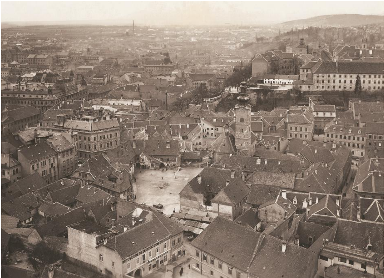
Slika 3. Izgled Dolca prije gradnje tržnice. Na fotografiji je već započeto rušenje južnog dijela.

izgrađena je tržnica (vanjska i unutarnja), zgrade Tržnog nadzorništva i ribarnice (obje je projektirao Ivan Zemljak) te trgovačko-stambena zgrada Arko-Hercog. Prema Jurić i Strugar (2011.) današnji izgled tržnice na Dolcu s okolnom regulacijom predstavlja „monumentalni torzo“ koji predstavlja izuzetna arhitektonska i regulacijska rješenja, ali i nezavidnu političku pozadinu cijelog procesa. 33