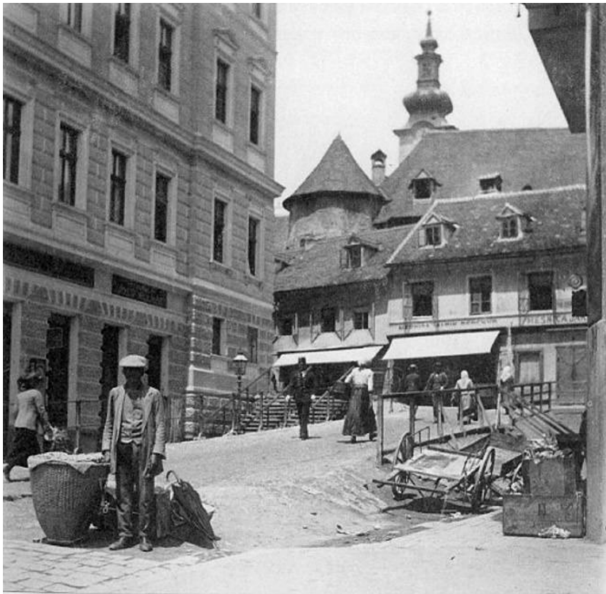
Slika 4. Pogled na Dolac sa Splavnice (prije provođenja nove regulacije Dolca).