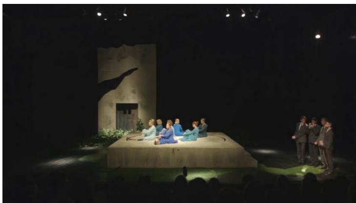
Slika 19. Ženska klapa vs. Muška klapa

KOR (muška klapa) Nikog nije briga. Gladuju i drugi. Zaboravite svoje plaće. Nikome ne cvatu ruže. Ima i onih koji bi radili. Budite zahvalne da uopće imate posao. ( Lavež )