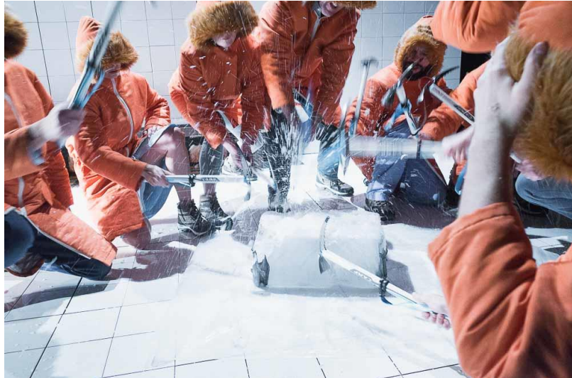
Slika 10. Razbijanje sante leda u Ono što nedostaje

percipiramo vidom ili gledanjem, ostvaruje postavljanje obiteljskih odnosa u hladan prostor popločen bijelim pločicama, a narančastim parkama, santom leda i bijelom šminkom asocira na planinski vrhunac Mt. Everest (slika 10.). Tijekom predstave događa se simultano korištenje verbalnih i neverbalnih modusa kojima se postiže metaforička identifikacija, ali događa se i sukcesivnost kada neverbalni modus prati verbalni ili obrnuto u metaforičkom preslikavanju.