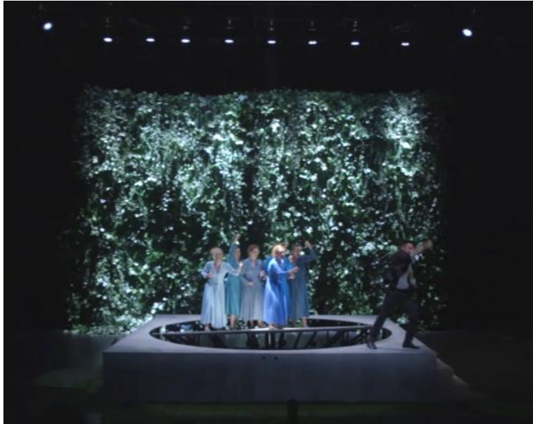
Slika 20. Njišuća pozornica – održavanje iluzije borbe za prava (Splav Meduze)