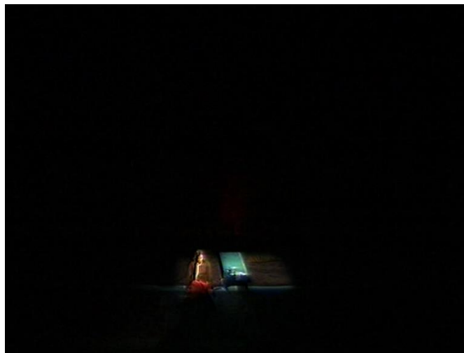
Slika 3. Na slici Alma Prica (Mirjana) u uvodnoj sceni osvijetljena snopom svjetla

Primjerom svjetla kao samostalnoga znaka objasniti ćemo uvodnu scenu izvedbe. Gledalište i većina pozornice su zatamnjeni, a snop svjetla usmjeren je na lik Mirjane, koja prilazi rubu scenografije, sjeda, meškolji se dok sjedi, naslanja se na odskočnu dasku, prebacuje nogu preko druge (Slika 3.). Budući da je snop svjetla usmjeren na Mirjanu, može se tumačiti kao konstituiranje značenja vezano uz ličnost dramskoga lika, tj. subjekta. Takav uvodni postupak naznačuje poseban status koji ima lik Mirjane u drami. Oko nje razvijaju se ostali dramski likovi, ona je uvijek u središtu, ali likovi koji ju okružuju ne dopiru do nje, nego u prvi plan iskače njezina samoća.