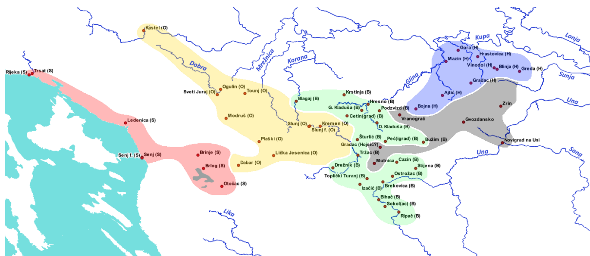
Slika 3. Kapetanije na Hrvatskoj krajini 1577. godine (crveno – Senjska; žuto – Ogulinska; zeleno – Bihačka; plavo – Hrastovička; crno – izvan kapetanija) (prema: Štefanec 2011, 482-484; izradio: Filip Šimunjak).