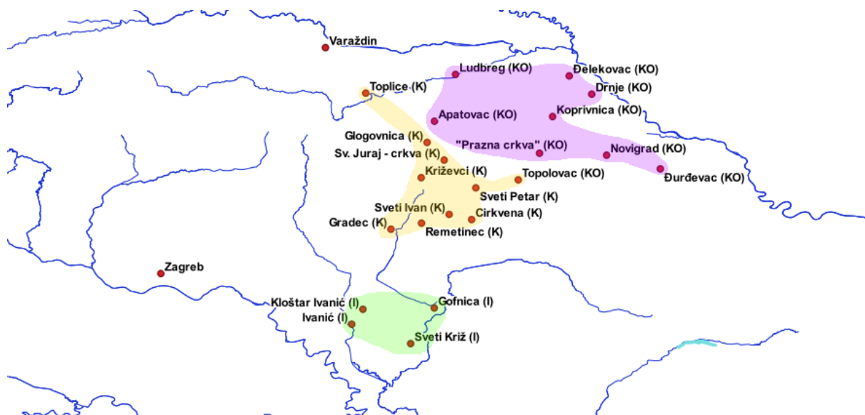
Slika 2. Kapetanije na Slavonskoj krajini 1578. godine (zeleno – Ivanička; žuto – Križevačka; ljubičasto – Koprivnička; Zagreb i Varaždin – izvan kapetanija) (prema: Štefanec 2011, 491-492; izradio: Filip Šimunjak).

kapetanije razvile ranije, najprije u Koprivnici 147 , no uvid u krajiške izvore ipak pokazuje da do 1578. godine na prostoru Slavonije nema jasnog kapetanijskog ustroja. Izostanak organizacije prije svega je posljedica malog broja utvrda do 1578. godine (oko deset, najčešće devet) te malog broja vojnika u utverdama (1577. godine čak 75.2 % vojnika ne boravi u utverdama). 148 Jasna podjela uvedena je tek nakon Sabora u Brucku – broj utvrda tada je povećan s devet na 25, a i broj vojnika izvan utvrda je drastično pao (1578. godine svega 17.1 % vojnika ne boravi u utverdama) te je stoga definiranje nadležnosti postalo nužno.