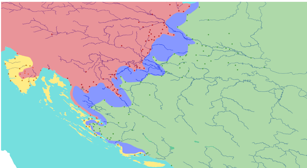
Slika 1. Prikaz pograničja („ničije zemlje“ ili terra nullius , plava boja) između Habsburške Monarhije, Mletačke Republike i Osmanskog Carstva 1577/8. godine. Zamišljene granične linije država povučene su principom spajanja najbližih susjednih pograničnih utvrda (crveno – Habsburška Monarhija; zeleno – Osmansko Carstvo; žuto – Mletačka Republika). Karta, dakako, nije potpuno točan prikaz zona utjecaja, već služi kao ilustracija iznesenih tvrdnji kako ne možemo govoriti o jasno povučenim graničnim linijama (linija razgraničenja u Istri prati konvencionalni način prikazivanja granice u atlasima budući da navedeno područje nije bilo u fokusu istraživanja). Udaljenost između linija utvrda bila je najveća u međuriječju Save i Drave gdje je prosječno iznosila oko 35/40 km (uz iznimku osmanskog „klina“ do utvrde Moslavina koja je od Križa bila udaljena oko 14 km). Na prostoru Hrvatske krajine ta je udaljenost u prosjeku bila nešto manja, no i dalje uglavnom svugdje veća od 20 km, uz najmanji razmak u Pounju (izradio: Filip Šimunjak). 8