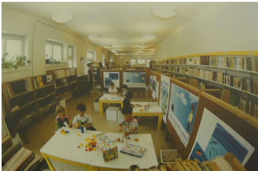
Slika 2. Prostor Dječje knjižnice Pula nakon 1972. godine