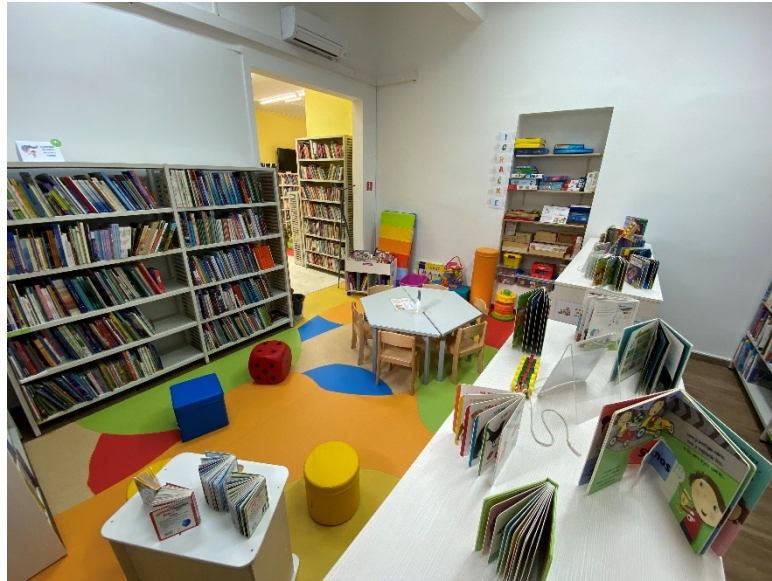
Slika 4. Preuređena Dječja knjižnica, 2021. – prostor za djecu predškolskog uzrasta i kutak s igračkama i društvenim igrama