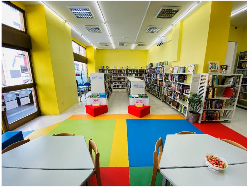
Slika 3. Preuređena Dječja knjižnica, 2021.

U Dječjoj knjižnici osiguran je privlačan prostor, pri čemu je posebna pozornost posvećena udobnosti. Namještaj i oprema koji se koristi u knjižnici čvrsti su i kvalitetni, otporni na habanje, mogu podnijeti učestalo korištenje i lako se mogu popraviti. Za potrebe adolescenata, odnosno da bi im se ponudio kutak za opušteni boravak u prostoru knjižnice, nabavljeni su klupski stolići i vreće za sjedenje. Pažnja je dana i policama za izlaganje knjiga, koje omogućuju prezentiranje knjižnične građe na različitim medijima. Iako su nabavljene police različitih visina te je dio knjižnične građe nekoj djeci i odraslima lakše dostupan, dinamičnim pristupom organizaciji fonda i to je prevladano. Da knjige i ostala građa budu dostupne svim korisnicima kod organizacije prostora, promišljalo se o tome da se nabavi veći broj niskih polica. Tako je, primjerice, dio knjižnice koji je namijenjen najmlađim članovima – bebama i djeci najmlađeg uzrasta – opremljen niskim policama pa je građa namijenjena njima i dostupnija. Redovitim mijenjanjem građe koja se prezentira te koja je dostupna na različitim mjestima u prostoru, povećava se pristupačnost građe većem krugu korisnika.