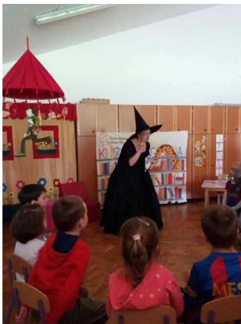
Slika 7. Knjižnica u gostima

Osim u knjižnici pričaonice se odvijaju i u predškolskim ustanovama u sklopu aktivnosti „Knjižnica u gostima“, koji je započeo 2016. godine. U povodu Dana grada Pule, Prosinca u gradu i sličnih programskih aktivnosti, knjižničake Dječje knjižnice odlaze u posjet predškolskim ustanovama, donose knjige, igračke, scenske lutke i ostala tematska pomagala kao i materijale za likovni izričaj kako bi djecu dodatno poticali na igru i kreativnost, druženje uz knjigu i usadili im ljubav prema knjizi i pričanju priča.