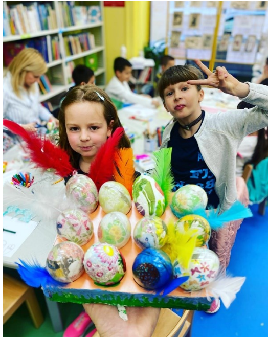
Slika 5. Uskrsna radionica ukrašavanja pisanica