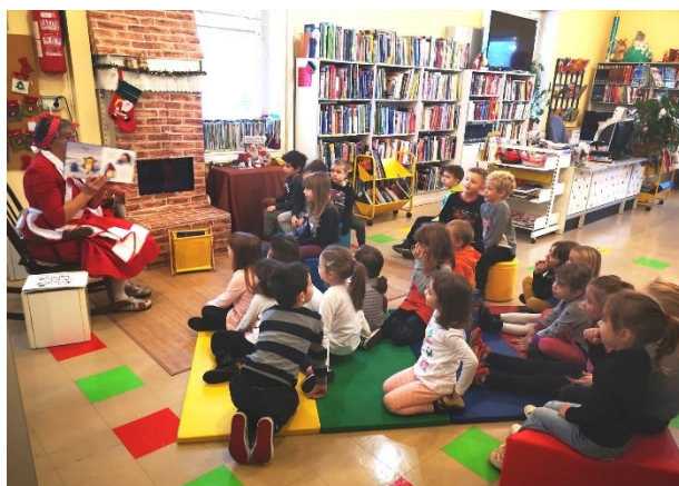
Slika 6. Božićna pričaonica u Knjižnici Bake Mraz

Osim u knjižnici pričaonice se odvijaju i u predškolskim ustanovama u sklopu aktivnosti „Knjižnica u gostima“, koji je započeo 2016. godine. U povodu Dana grada Pule, Prosinca u gradu i sličnih programskih aktivnosti, knjižničake Dječje knjižnice odlaze u posjet predškolskim ustanovama, donose knjige, igračke, scenske lutke i ostala tematska pomagala kao i materijale za likovni izričaj kako bi djecu dodatno poticali na igru i kreativnost, druženje uz knjigu i usadili im ljubav prema knjizi i pričanju priča.