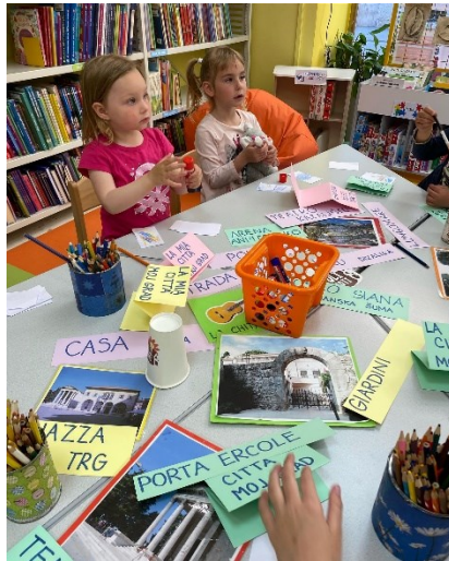
Slika 12. Kreativna radionica učenja talijanskog jezika u povodu Dana grada Pule

mjesečno ili povodom obilježavanja važnih datuma vezanih uz nacionalne manifestacije ili blagdane..