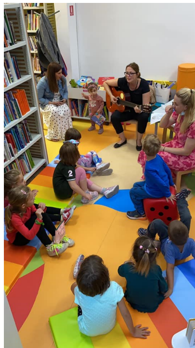
Slika 13. Učenje stranog jezika kroz pjesmice i brojalice