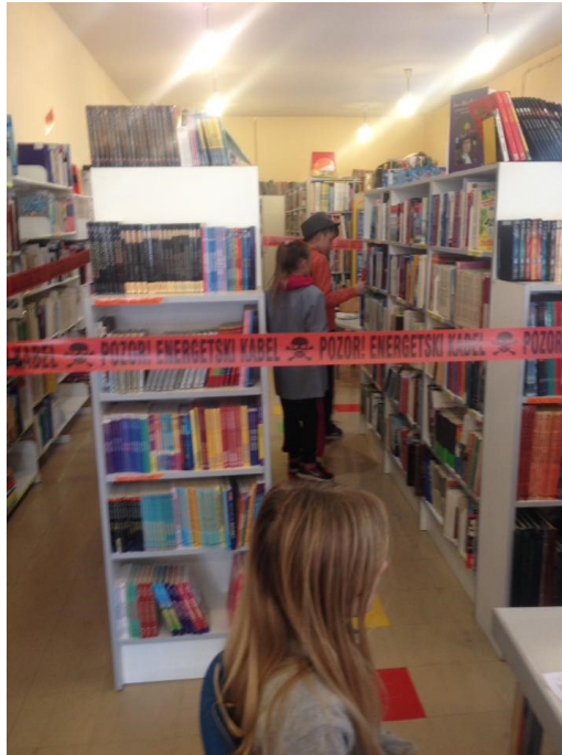
Slika 8. Lektira na drugačiji način – Emil i detektivi