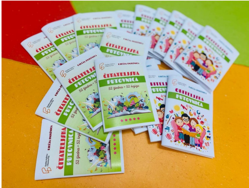
Slika 10. Čitateljska i Obiteljska putovnica