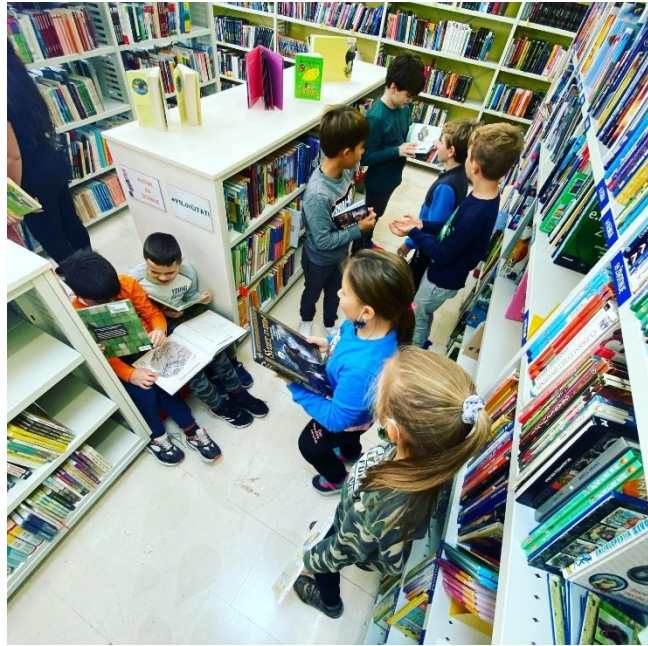
Slika 9. Knjižnica bajna za me nije tajna