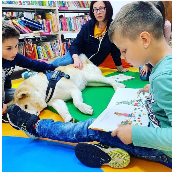
Slika 11. Klub hvatača slova