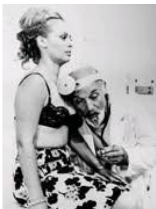
Slika 6 Scena pregleda kod doktora Luidija

Polaritet lika doktora Luidija već smo nakratko spomenuli, njegov karakter i njegovi postupci od početka do kraja variraju između morala i nemorala, kulture i nekulture, strogoće i blagosti, ljubavi i mržnje, a točka na kojoj se prelamaju njegov je odnos sa/prema ženama. Objektivizacija žena prisutna je na razini čitavog Malog mista (ili Malog mista ), ali je najkarakterističnija za lik doktora, možda jer se samim svojim zanimanjem u mogućnosti najviše približiti ženskom tijelu tobože „s pokrićem“ pa često njegovi pregledi rezultiraju vulgarnim ili nevjernim ponašanjem, kao u sceni iz epizode Šporka posla u kojoj pacijentici pluća ne sluša stetoskopom, već na njezina prsa naslanja uho.