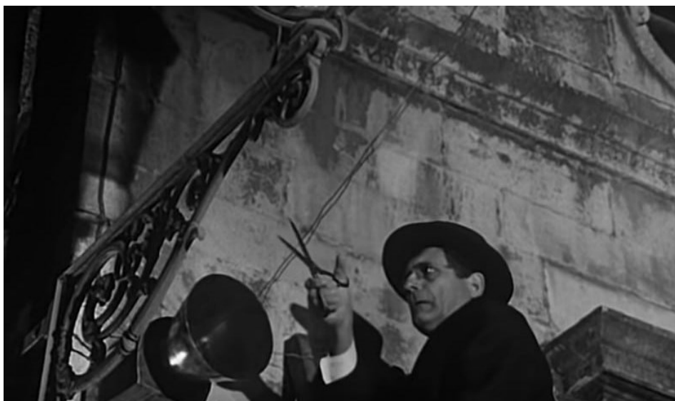
Slika 4 Kadar iz epizode Borbena ponoćka , don Karmelo presijeca žicu razglaša

da ga ne treba trajno zatvoriti, već mu samo zaprijetiti sudcem za prekršaje i redovnim sudom: „Ma promisli, uhapsit popa na Božić! To bi i strane novine pisale. Proganjaju crkvu, apsidu pope“ ( Borbena ponoćka ). Iz tog proizlazi da je socijalistička Jugoslavija 50-ih provodila svoju politiku pazivši da se ne zamjeri zapadu i zemljama kojima ne upravlja antireligiozni režim jer su im one na neki način bile potrebne.