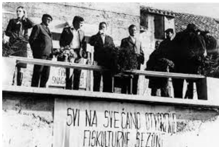
Slika 3 Kadar iz epizode Proljetni cross

U seriji se napetost gradi prekidanjem ostalih scena epizode Proljetni cross onima u kojima načelnik, popraćen prigodnom glazbom, već dobro opisane fizičke konstitucije, jedva trči, prenemaže se, ali ne odustaje. To je rezultiralo, kako je likar i predvidio, vrlo tragično.