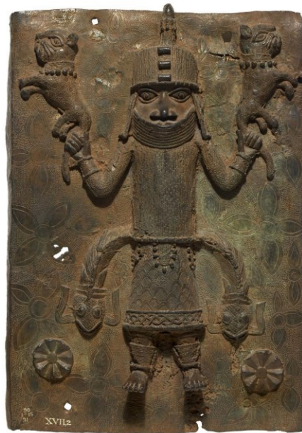
Slika 3. Beninska bronca

muzejskog rada i za promišljanje o tome kako bi oni mogli izgledati u budućnosti. Smatra da bi muzeji trebali biti središta inovacije i kritičkog diskursa, koja su izgrađena na međusobnom poštovanju između institucija, i to međunarodnih (Hickley, 2021). Projekt MuseumsLab ističe kako su muzeji dio društva koji povezuje na međunarodnoj razini te kao aktivne institucije imaju zadatak učiti od povijesti. Time se želi potaknuti promjena u društvu i edukacija o društvenoj pravdi i klimatskim promjenama. Projekt zato povezuje stručnjake iz Njemačke i Afrike, kustose, istraživače, radnike muzeja i galerija, kako bi međusobno dijelili znanje i iskustva (TheMuseumsLab, n.d.).