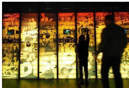
Slika 15 – Interaktivna vremenska traka, muzej Ragnarock, Danska

Kada govorimo o svjetskim muzejima, povećan interes za korištenje zvuka pri interpretaciji javio se s osnivanjem muzeja popularne glazbe. Razvoj takvog tipa muzeja omogućio je nastanak većeg broja istraživanja na temu zvuka. Pred kustose je stavljen zadatak kuriranja specifičnih izložbi – izložbi baziranih na zvuku i glazbi. Ističe se Muzej Ragnarock, otvoren 2017. u Roskildeu u Danskoj. Svoju izlagačku politiku baziraju na multimodalnom iskustvu i narativu koji vodi posjetitelje kroz povijest danskog ritma i glazbe - od rock'n'rolla 1950-ih, preko pop kulture 1980-ih do suvremenosti. Na slici 15 vidi se dio njihova postava. Radi se o interaktivnoj vremenskoj traci koja omogućava slušanje pjesama iz različitih razdoblja glazbene povijesti. 70 Posjetitelje se tako poziva na angažman – da priključe slušalice, odaberu pjesmu koju žele slušati i samostalno dožive jedinstveni zvučni ambijent.