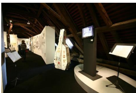
Slika 6 – Izloženi predmeti i multimedijski sadržaji na izložbi Zagrebački solisti , MGZ, 2019./2020.

Pozivanje posjetitelja na aktivno sudjelovanje u stvaranju znanja odnosi se na korištenje zvuka kao didaktičkog sredstva. To je druga po redu formalna pojavnost zvuka kao interpretacijske strategije, pri čemu zvuk ima naglašen edukacijski potencijal. Primjere ovakvog korištenja zvuka mogli smo naći na izložbi Zagrebački solisti , održanoj 2019. godine u Muzeju grada Zagreba (MGZ). Cilj izložbe bio je posjetiteljima ukazati na opstojnost i značaj znamenitog ansambla komorne glazbe. Bila je zamišljena kao svojevrsni glazbeno-edukativni vremeplov, pri čemu su izložene fotografije nastupa Solista , plakati, nagrade, nosači zvuka i reprodukcije izvedbi s najvažnijih koncerata (slika 6). 55 Znanja su se prenosila putem interaktivnih i multimedijskih sadržaja koji su posjetiteljima približavali moć stvaranja i vještinu reproduciranja glazbe na instrumentima, a i sami posjetitelji mogli su se okušati u stvaranju i vješтини reproduciranja glazbe na instrumentima po kojima su Zagrebački solisti prepoznatljivi (slika 7). 56