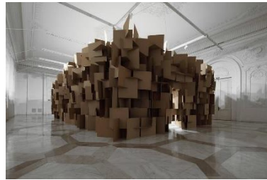
Slika 13 – Kinetičko-zvučna instalacija na izložbi Zimoun: zid od zvuka , Galerija Močvara, 2014.

Na izložbi u Galeriji Greta vidjeli smo kako je to kada je zvuk pri interpretaciji ravnopravan s vizualnim, međutim, što ako zvuk preuzme glavnu ulogu u prostoru? Istraživanjem tog problema bavi se Galerija Močvara koja djeluje kao izložbeni program posvećen isključivo umjetnosti zvuka. Zvuk se koristi na povremenim izložbama s ciljem interpretacije konceptualne ideje koje stoje iza izložbi. Tako se na izložbi Zimoun: zid od zvuka , održanoj 2014. godine, mogla vidjeti kinetičko-zvučna instalacija namijenjena isključivo prostoru Galerije. Umjetnik je izradio monumentalni zvučni zid koji je funkcionirao kao fizička manifestacija zvuka koja se širila prostorom (slika 13). 62 Zidom je želio spojiti pokret, zvuk, materijal i tehnologiju u cjelinu koja funkcionira kao medij za prijenos poruke i kao alat za istraživanje akustičnih mogućnosti prostora. Iako je to bila jedina fizička stavka na cjelokupnoj izložbi, postiglo se to da su posjetitelji imali priliku uroniti u iskustvo, istražiti prostor i učiti iz njega.