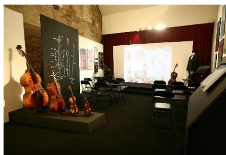
Slika 7 – Glazbeni instrumenti dostupni za edukaciju na izložbi Zagrebački solisti , MGZ, 2019./2020.