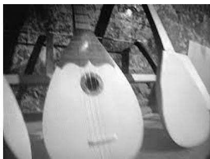
Slika 8 – Scena iz filma o tamburici nastalog u sklopu izložbe Tamburica – simbol hrvatskog identiteta , Etnografski muzej, 2006.

Izložbom se naglašavala važnost takve vrste glazbe u oblikovanju hrvatskog identiteta i nematerijalne baštine, a zvuk je – u interakciji s vizualnim – poslužio kao medij za interpretaciju predmeta i dodao mu duhovnu dimenziju.