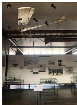
Slika 11 – Predmeti iz stalnog postava uklopljeni u izložbu Tehnologije u biologiji: šišmiši , Tehnički muzej Nikola Tesla, 2019.

Kada govorimo o izložbama održanima u zagrebačkim galerijama, one sve u fokus stavljaju medij zvuka – eksperimentiraju njime i istražuju njegove mogućnosti s ciljem komunikacije kompleksne teme. Za razliku od muzeja, galerije nemaju stalni postav te zato moraju ograničiti svoje djelovanje i konstantno mijenjati postav, smišljajući nove koncepte i ideje. U svom su djelovanju puno slobodnije, a interdisciplinarnost lakše dolazi do izražaja. Izložba zvuka Mirne Shourgot Vidim zvuk , održana u Galeriji Greta 2016. godine, pokazala je kako spajanje slike i zvuka ne mora nužno biti kompleksno. U suradnji s fotografima i video-umjetnicima, umjetnica je stvorila audio-vizualni prostor unutar kojeg je zvuk animirao statične radove, oživljavao vizualno i djelovao na emocije posjetitelja. 61 Tako na slici 12 možemo vidjeti jedan