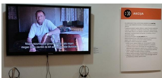
Slika 4 – Televizija kao AV pomagalo na izložbi Svijet Zvukova , Tiflološki muzej, 2016.

Izložba Svijet Zvukova , održana 2016. godine u Tiflološkom muzeju, primjer je izložbe koju je teško smjestiti u samo jednu od kategorija formalne pojavnosti zvuka. Zvuk je ovdje bio okosnica izložbe, ali je jednako važna bila i njegova didaktička dimenzija. Dok su prethodno analizirane izložbe koristile zvuk za stvaranje zvučnog podražaja koji je činio temelj cjelokupne izložbe, ova izložba bila je podijeljena u nekoliko cjelina. Svaka cjelina predstavljala je zaseban koncept, ovisno o tome što se željelo prikazati. Proučavanje zvuka bilo je u fokusu izložbe, ali zvuk nije uvijek imao ključnu ulogu pri interpretaciji predmeta. Korištena su razna audio-vizualna pomagala (poput televizije), a cilj reproduciranog zvuka bio je educirati ljude o sluhu i važnosti ranog otkrivanja problema sa sluhom (slika 4). Izložci koji su koristili zvuk bili su interaktivni - posjetitelji su mogli ispitati svoj sluh (slika 5), saznati nešto o slušnim iluzijama, a bila je izložena i računalna audio igra u kojoj su posjetitelji trebali odrediti poziciju izvora zvuka u 3D prostoru. 54 Tako je zvuk, osim što je bio glavna tema izložbe, imao i značajnu edukacijsku ulogu, a posjetitelji su bili pozivani na aktivno sudjelovanje u stvaranju znanja.