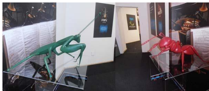
Slika 2 – Modeli kukaca, izložba Zvukovi kukaca – orkestar najmanjih , HPM, Zagreb, 2016/17.

Iduća izložba koja je koristila zvuk kao fokus izložbe jest izložba Zvučna [in]formacija , održana 2013. godine u Muzeju suvremene umjetnosti. Dvostruki smisao naslova „aludirao je na skulpturalno i fizičko, tj. na sposobnost zvuka da zauzme prostor, te na njegov utjecaj i opipljiva svojstva”. 52 Izložba je bila osmišljena kao istraživanje mogućnosti digitalnih tehnologija da prenesu zvuk. Izloženi radovi kombinirali su vizualnu i slušnu percepciju, stvarajući zvučno oblikovan prostor. Cilj tako nastalih radova bio je privući pažnju posjetitelja i pozvati ih na interakciju. Na slici 3 prikazan je jedan od radova: Luminofizički zbor kultura - gigantska dvanaestoglava audio-vizualna kreacija koja je pjevala ili recitirala prozu kada je na to potaknuo umjetnik ili netko iz publike. 53