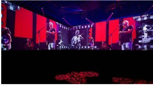
Slika 16 – Snimka koncerta kao dio izložbe, izložba Pink Floyd: Their Mortal Remains , 2017., V&A Museum, London