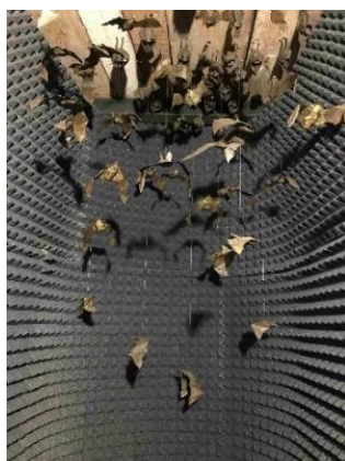
Slika 10 – Modeli šišmiša u zvučno izoliranom prostoru, izložba Tehnologije u biologiji: šišmiši , Tehnički muzej Nikola Tesla, 2019.

snimljeno tijekom istraživanja, kao i pogledati film o tijeku istraživanja. 60 Prostor je bio izoliran pločama za održavanje kvalitete zvuka, a modeli šišmiša na stropu i mračan prostor stvarali su prirodan, špiljski ambijent za doživljaj zvukova (slika 10). Pritom su u kontekst izložbe bili uklopljeni i predmeti iz stalnog postava Muzeja (slika 11), poput Da Vincijevih crteža, talijanske podmornice i aviona Slavoljuba Penkale koji u svom radu koriste iste principe odašiljanja i primanja zvučnih valova. Zvuk se koristio da bi pomogao u interpretaciji kompleksnih principa ehlokacije i omogućio dubinsko promišljanje o njihovoj složenosti i povezanosti s tehnologijom kakvu poznajemo danas.