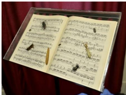
Slika 1 - Notni zapis zvukova, izložba Zvukovi kukaca – orkestar najmanjih , HPM, Zagreb, 2016/17.

prostora bila je prikazana raznolikost kukaca pjevača te osnovni podaci o načinima na koje kukci stvaraju i čuju zvuk. 50 Zvuk je korišten samostalno, a bio je reproduciran pomoću zvučnika koji su bili postavljeni unutar prostora. Uz slušanje zvukova i razgledavanje izloženih prepariranih životinja, posjetitelji su mogli razgledati i notne zapise zvukova (slika 1). Stvaranje takve vrste doživljaja imalo je za cilj aktivirati prisjećanje i emocionalnu reakciju kod posjetitelja koji su se pomoću zvuka mogli prisjetiti djetinjstva, ljetovanja ili dijelova prirode u kojima su prvi put čuli glasanje kukaca. Također, na izložbi su se mogli vidjeti i modeli kukaca – poput modela mrava ili skakavca s prikazom struktura pomoću kojih proizvode zvukove (Slika 2). 51