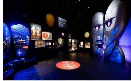
Slika 17 – Zvučna instalacija uklopljena u prostor, izložba Pink Floyd: Their Mortal Remains , 2017., V&A Museum, London

Osim tematskih izložbi koje se bave glazbom, u Victoria & Albert Museumu radili su na tome da uklape zvuk u interpretaciju predmeta iz fundusa muzeja. Zanimljiv je primjer zvučna instalacija Resonant Bodies umjetnice Caroline Devine iz 2018. godine. Radilo se o projektu uklapanja zvučne instalacije u postav s ciljem interpretacije tradicionalnih indijskih instrumenata iz 19. stoljeća (slika 18). Umjetnica je razvila četverokanalnu zvučnu instalaciju koja koristi sustav pretvarača zvukova instrumenata na površini stakla i učinkovito djeluje kao golemi zvučnik. 73 Tako je posjetiteljima omogućen audiovizualni doživljaj tradicionalnih predmeta, bez utjecaja na estetiku. Posjetiteljima je izgledalo kao da staklena vitrina proizvodi zvuk, a zahvaljujući kvalitetnom akustičnom dizajnu prostora i tehnologiji omogućen je neometajući, intimniji doživljaj predmeta. 74