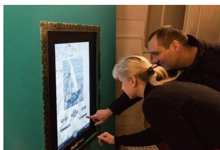
Slika 9 – Uređaj PandoPad na izložbi Kako te mijenja maska - pokladni običaji mačkara iz Gljeva , Etnografski muzej, 2017.

Kada govorimo o Etnografskom muzeju, bitno je spomenuti i njihovo eksperimentiranje zvukom unutar stalnog postava. Naime, 2020. godine u jednu od vitrina postavljena su tradicijska glazbala, a pored vitrine instaliran je PandoPad. 58 PandoPad je uređaj koji je omogućio posjetiteljima da pretražuju online zbirku glazbala te da čuju zvuk instrumenta koji su odabrali. 59 Osim u stalnom postavu, ovaj uređaj je stalno prisutan na povremenim izložbama Etnografskog muzeja na kojima nudi mogućnosti slušanja i upravljanja zvukom (slika 9).