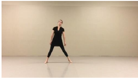
Slika 12 – Audio-vizualni rad na izložbi Vidim zvuk , Galerija Greta, 2016.

od videoradova u kojem umjetnica nepomično stoji, a glazba koja se reproducira u pozadini otkriva njezina unutarnja stanja, tj. vizualno nevidljive emocije.