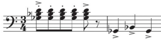
Beispiel 4. Immer Ärger mit Harry (Musik von Bernard Herrmann); aus der Vorspannmusik, „Hitchcocks Akkord“ als Dreiklang (Notenbeispiel übernommen aus: ebd.: 151)