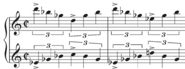
Beispiel 6. Vertigo – Aus dem Reich der Toten (Musik von Bernard Herrmann); der „Hitchcock-Akkord“ in Form einer linearen Zweistimmigkeit (Notenbeispiel übernommen aus: ebd.: 160)

Bernard Herrmann verwendete in Vertigo – Aus dem Reich der Toten den „Hitchcock-Akkord“ auch linear. Sein Ziel war, möglichst realistisch die Störung zu illustrieren, an der die Hauptfigur, der Detektiv John „Scottie“ Ferguson leidet – Akrophobie. Aus diesem Grund wird der Akkord in der Vorspannmusik in zwei Linien gebrochen, die in Gegenbewegung geführt werden und sich im Sekundintervall „berühren“. Es wird damit nicht nur die Tradition hinsichtlich der Komponierweise und der Melodiewahrnehmung gebrochen, sondern man empfindet wegen dieser zwei Linien mit einem flüchtigen Tonalitätszentrum Instabilität und Unbehagen.