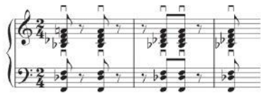
Primjer 5. Psyho (skladatelj Bernard Herrmann); uvodna glazba, "Hitchcockov akord" kao četverozvuk (notni primjer preuzet iz: Brown, ibid. 160)

Bernard Herrmann će u filmu Vrtoglavica "Hitchcockov akord" koristiti i linearno. Cilj mu je bio stvoriti što realniji osjećaj bolesti od koje pati glavni lik, detektiv John "Scottie" Ferguson – akrofobije. Zbog toga je akord u naslovnoj glazbi razbijen u dvije linije koje se kreću u protupomaku te se "dodiruju" u sekundnom sudaru. Osim što je na ovaj način razbijen standardni način skladanja i percipiranja melodije, dvije ponuđene linije u kojima je tonalitetni centar teško uhvatljiv, stvaraju osjećaj nestabilnosti i nelagodnosti.