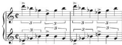
Primjer 6. Vrtoglavica (skladatelj Bernard Herrmann); uvodna glazba, "Hitchcockov akord" u obliku linearnog dvoglasja (notni primjer preuzet iz: ibid. 160)

Bernard Herrmann će u filmu Vrtoglavica "Hitchcockov akord" koristiti i linearno. Cilj mu je bio stvoriti što realniji osjećaj bolesti od koje pati glavni lik, detektiv John "Scottie" Ferguson – akrofobije. Zbog toga je akord u naslovnoj glazbi razbijen u dvije linije koje se kreću u protupomaku te se "dodiruju" u sekundnom sudaru. Osim što je na ovaj način razbijen standardni način skladanja i percipiranja melodije, dvije ponuđene linije u kojima je tonalitetni centar teško uhvatljiv, stvaraju osjećaj nestabilnosti i nelagodnosti.