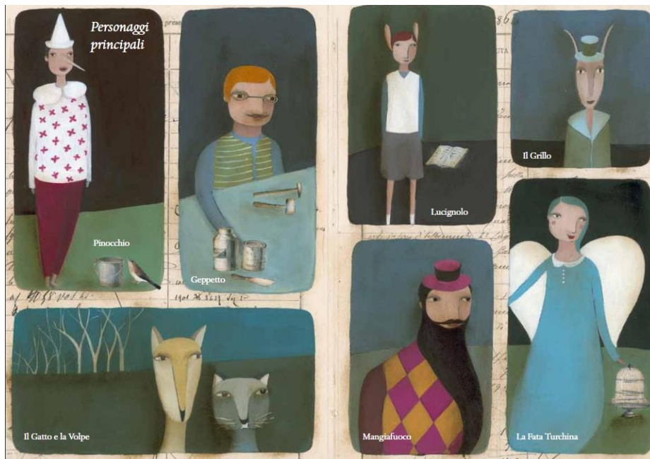
Immagine 1 Materiale didattico – personaggi principali (Massei, 2013: 6 e 7)

L'inizio della riduzione contiene uno schema dei personaggi che si incontreranno nell'opera e che aiuterà nella comprensione dei disegni relativi alle vicende nei capitoli.