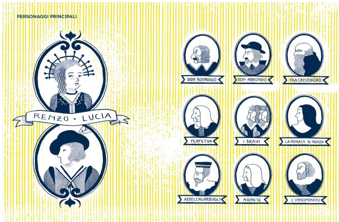
Immagine 4 Materiale didattico – personaggi principali (Massei e Moscatelli, 2014: 6 e 7)