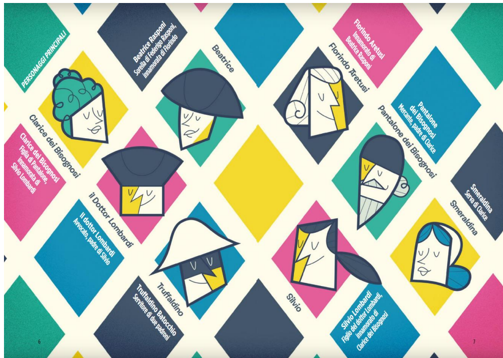
Immagine 6 Materiale didattico – personaggi principali (Carancini, 2017: 6)

Il numero dei personaggi e la trama dell'opera restano invariati. Sono presenti tutte le vicende dei personaggi, però le loro reazioni, battute e sentimenti in alcuni casi vengono trascurati.