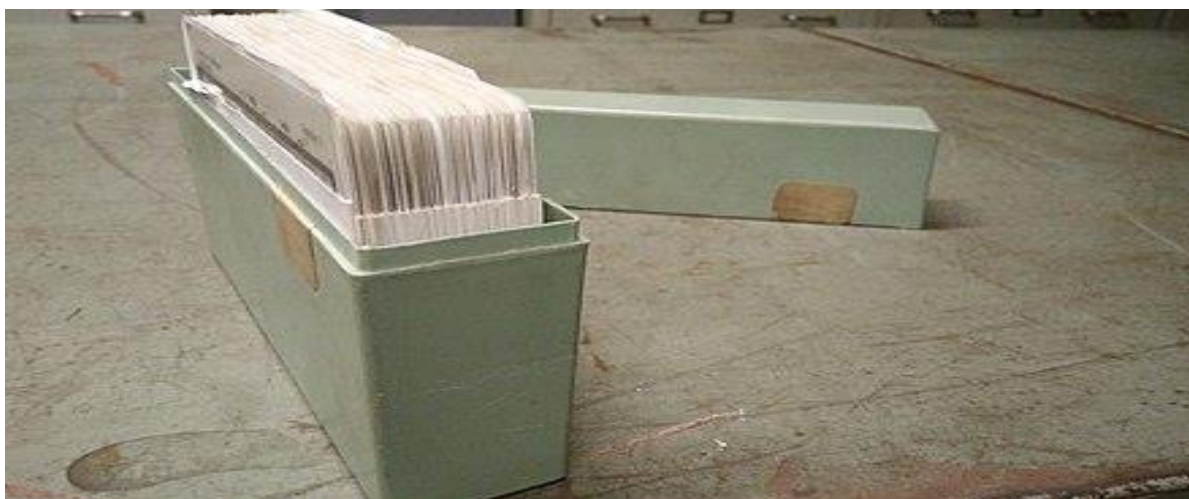
Slika 5. Spremnik za mikrofiševe i mikrofiševi

trenutka njihova snimanja na mikrooblik, i to bez gubitka kvalitete. Isto tako, moguće je pohraniti velike količine dokumenata na mikrofilmu, a troškovi pohrane i održavanja mikrofilma znatno su manji od onih koje zahtijeva izvorno analogno arhivsko gradivo na papiru ili drugom sličnom mediju. Ovo omogućuje sigurno čuvanje dokumenata uz prihvatljive troškove te brz i jednostavan pristup gradivu. Osim toga, za korištenje mikrofilma nije potrebno neko posebno znanje rukovanja opremom za reprodukciju (Hrvatska enciklopedija – mrežno izdanje, 2019).