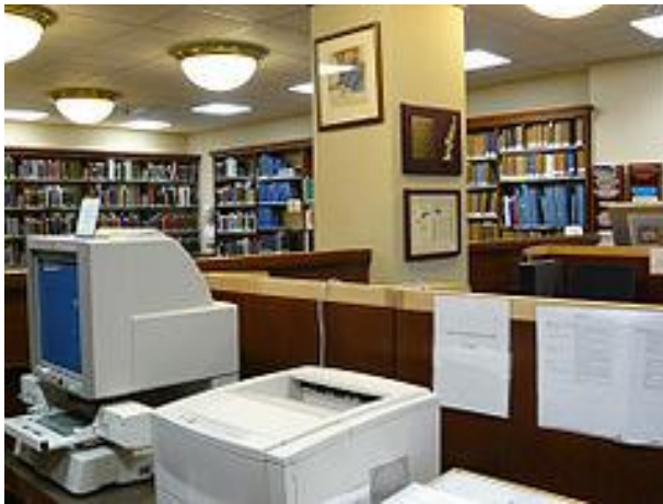
Slika 6. Čitač mikrooblika

se sam izvornik ne izlaže riziku od oštećivanja ili trošenja tijekom korištenja. Oni su se naime nekada morali ručno prepisivati kako bi se izradila vjerna kopija i primjerak za korištenje, tvrdi Uhl. Dakle, mikrofilmiranjem se izbjegavaju zabune odnosno pogreške kod prepisivanja a značajno se smanjuju i troškovi slanja vrijednih i ponekad formatom vrlo velikih izvornika iz arhiva prema van. Mikrofilmiranje je između ostalog omogućilo objedinjavanje zbirki i fondova gradiva koje se nalazi na