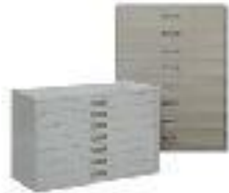
Slika 8. Spremnik za pohranu mikrofilma