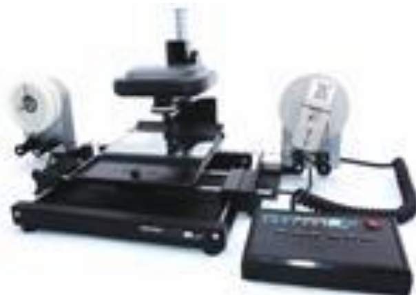
Slika 9. Suvremeni Micro-Image Capture skener i čitač mikrooblika

informacijsku vrijednost (pečati, naknadne zabilješke i komentari na analognom gradivu, slike i sl.) te jednostavno mora biti prisutna i na digitalnim verzijama analognog gradiva kako bi one i nadalje vjerno predstavljale izvorno gradivo.