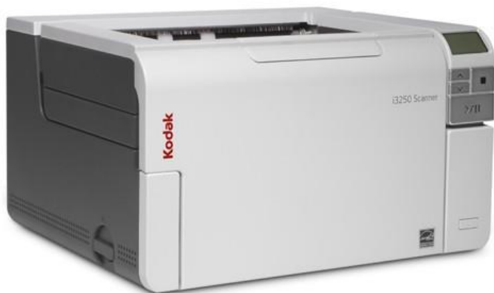
Slika 11. Kodak rotacijski skener

budućnosti okrenuti postupcima digitalizacije, a ne mikrofilmiranja arhivskoga gradiva.