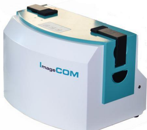
Slika 10. Suvremeni ImageCOM Computer Output to Microfilm uređaj

U Njemačkom saveznom arhivu sve su prednosti i nedostaci postupka mikrofilmiranja odnosno digitalizacije analognog arhivskog gradiva uzete u obzir te je 2013. godine u suradnji s jednom konzultantskom tvrtkom provedena i dodatna analiza. Zaključak je bio taj da je mikrofilmiranje analognog gradiva pa zatim izrada