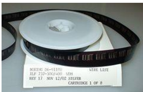
Slika 2. Rola mikrofilma

Ovo su značajna pitanja kada se govori o mikrofilmiranju i digitalizaciji u kontekstu arhivistike i bibliotekarstva. Ta važnost proizlazi iz činjenice da je u ova oba područja vrlo važno zaštititi gradivo koje arhivske i knjižnične ustanove čuvaju, kao i povećati njegovu dostupnost odnosno mogućnost korištenja. Ove obje zadaće arhivi i knjižnice nekada su ispunjavali postupkom mikrofilmiranja, a danas prvenstveno digitalizacije. Mikrofilmiranje je u kontekstu arhivistike i bibliotekarstva postupak koji spada u područje mikrografije . U Hrvatskoj enciklopediji Leksikografskog zavoda Miroslav Krleža navodi se da je „mikrografija skup postupaka i tehnika kojima se izvorni analogni dokumenti prenose u smanjeni odnosno mikrooblik koji je pogodan za pohranu i dugotrajno čuvanje podataka“ (Hrvatska enciklopedija – mrežno izdanje, 2019). Dakle, analognim, a danas i računalno potpomognutim postupcima izvorno papirnato gradivo fotografski se snima na fotoosjetljivu podlogu. Mikrofilm (slika 2) kao fotoosjetljiva podloga je mikrooblik odnosno fotografski neperforirani film širok 35 milimetara i koji se još naziva master negativ . Postoji i mikrofilm širine 16 milimetara (slika 3), no on se