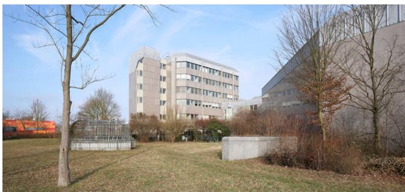
Slika 1. Zgrada središnjice Njemačkog saveznog arhiva u Koblenzu

Danas Njemački savezni arhiv djeluje na nekoliko lokacija u Saveznoj