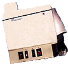
Slika 7. Kodak procesor za mikrofilm

U odnosu na mikrofilmiranje digitalizacija analognog arhivskoga gradiva ima svoje prednosti ali i nedostatke. Digitalizacija je u užem smislu proces pretvaranja analognog teksta, slike, zvuka, pokretnih slika (filma i videa) i trodimenzionalnih objekata u digitalni oblik odnosno u binarni kôd koji je zapisan kao računalna