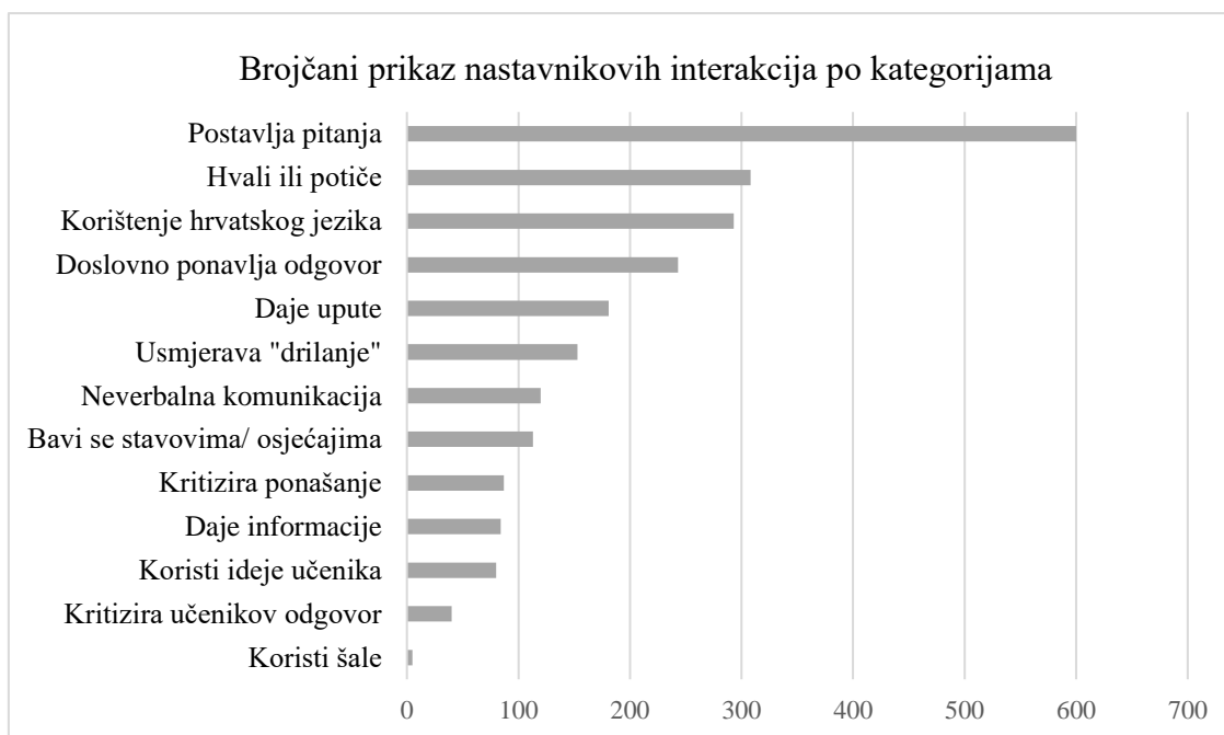
Slika 1. Brojčani prikaz nastavnikovih interakcija po kategorijama

Nakon kategorija neizravnog utjecaja slijede dvije kategorije izravnog utjecaja, davanje uputa i usmjeravanje „drillanja“, koje se pojavljuju ukupno 15% tijekom nastavnog sata. Kako bi se podaci prikazali što zornije, u nastavku slijedi graf koji prikazuje brojčanu raspodjelu nastavnikovih interaktivnih poteza po svim kategorijama.