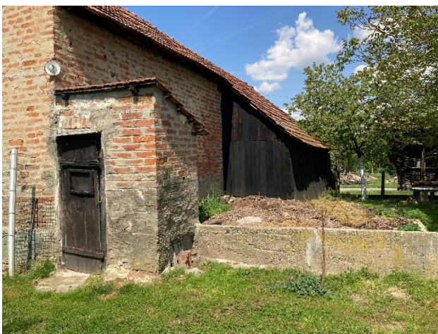
Slika 4. Stari napušteni poljski WC

Seoske su kuće danas sve veće i modernije i većina njih se u pravilu ne razlikuje s kućama u gradovima, a osnovna opremljenost je usvojena pa se po svemu izrečenom možemo složiti s navodom: „Kulturni standardi su postavljeni, oni su usvojeni, radi se samo o tome što ih jedni