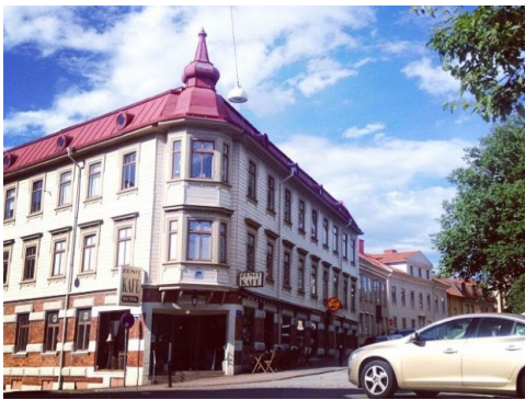
Klassiskt Göteborgskt landshövdingehus i Majorna.

Under 1700-talet blommade Göteborg ut till en riktig storstad med dåtidens mått: över 10 000 (!) invånare. Hamnens betydelse växte och tack vare Ostindiska kompaniet, samt exporten av järn- och trävaror, blev Göteborg en rejäl handels- och sjöfartsstad. Tobaks- och sockerindustrin var tillsammans med sillfisket andra viktiga näringar och tillförde Göteborg stor vinst. Många av dåtidens köpmän byggde upp pampiga timmerhus längs med kanalerna. Dessvärre drabbades Göteborg av en rad bränder under slutet av 1700-talet och därför finns inte de ursprungliga trähusen kvar.