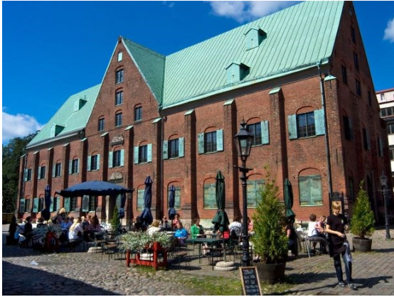
Ett av få bevarade 1600-talshus i Göteborg: det före detta artilleriet Kronhuset från 1654.