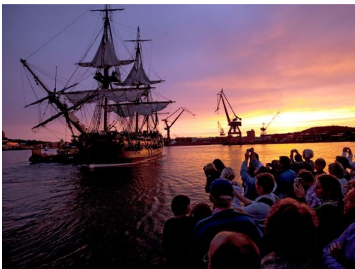
Ostindiska kompaniets världsomseglande skepp bidrog starkt till Göteborgs utveckling till storstad.

Dagens Göteborg byggdes upp under 1600-talet av holländare, eftersom de ansågs bäst på att bygga på sankmark. Detta har gett Göteborgs innerstad dess kanaler och rader av träd utmed kajerna, skurna eller klippta på holländskt sätt. Den ursprungliga staden byggdes innanför den stora sicksackformade stadsvall som kom att känneteckna Göteborg. Av denna befästning finns inte mycket bevarat idag, men en rest av bastionen Carolus XI Rex finns kvar vid Esperantoplatsen. Vallgraven tillsammans med de två skansarna Lejonet och Kronan gjorde att Göteborg under 1600-talet ansågs vara norra Europas bäst befästa stad.