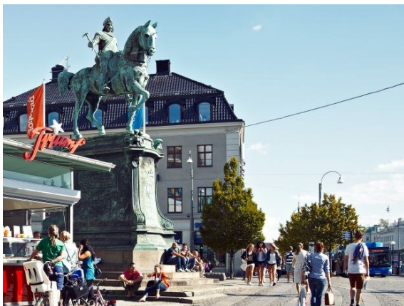
Karl IX på sin kopparmärra - en klassisk mötesplats för göteborgarna.

Göteborg grundades år 1621 av Gustaf II Adolf men det var inte den första staden vid Göta älvs mynning. På slutet av 1400-talet anlades Nya Lödöse som var en viktig handelsstad för Sverige. Nya Lödöse låg på den plats där Gamlestaden ligger idag. Efter att Göteborg tagit över allt mer som västkustens storstad minskade dock Nya Lödöses betydelse och blev i folkmun den ”gamle staden”. Idag pågår en stor arkeologisk utgrävning som ska lära oss mer om Nya Lödöse .