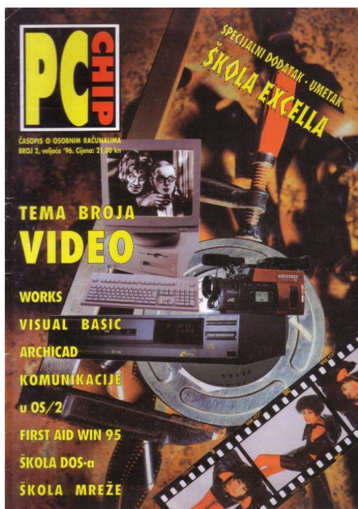
Slika 3. Naslovna stranica časopisa PC Chip, br.2, veljača 1996.