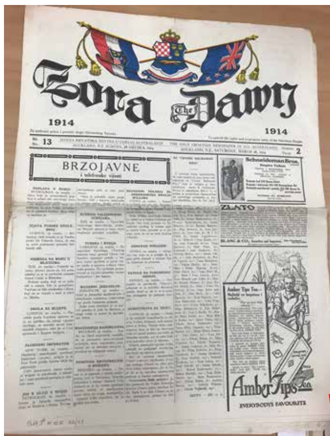
Primjerak Zore koji se čuva u Dalmatinskom kulturnom društvu u Aucklandu