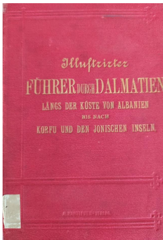
Slika 4. Vodič po Dalmaciji iz 1883. godine 65

Značaj knjižnice i fonda bio je u tome što je knjižnica tijekom dugogodišnjeg djelovanja bila uključena u najvažnije prosvjetne i znanstvene ustanove Austro-Ugarske Mornarice. Mornarica je slijedila znanstveni i tehnički napredak u svijetu pomorstva, brodogradnje, strojarstva, hidrografije, vojne tehnike i srodnih znanosti i struka, a dijelom je pridonosila tom razvoju što posvjedočuje fond i katalog knjižnice. 66 Vrijednost fonda ove knjižnice nije bila samo u brojnim vrijednim primjercima, već prvenstveno u njezinoj sveobuhvatnosti koja je proizašla iz njezine namjene za potrebe Mornarice i iz nabavljanja znanstveno relevantnih publikacija s toga područja na svim svjetskim jezicima. Sačuvani fond predstavlja svjetsku znanstvenu i kulturnu baštinu koja svjedoči o znanstvenim i tehničkim postignućima budući da je između ostalog,