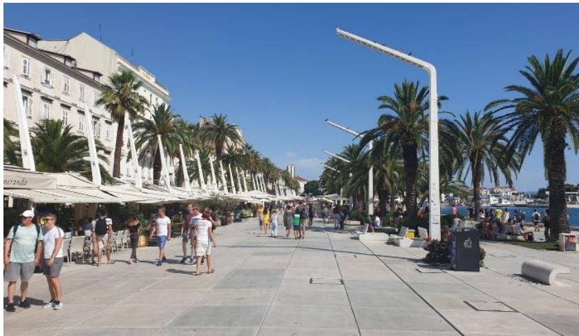
Sl. 7. Riva (pogled prema istočnoj strani), 1. 7. 2019.