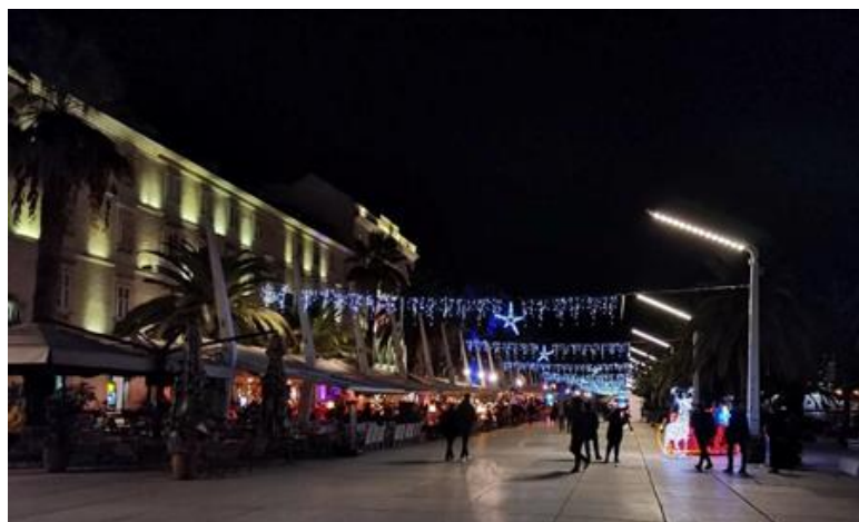
Sl. 24. Riva (zapadni vrh šetnice), 15. 12. 2019.