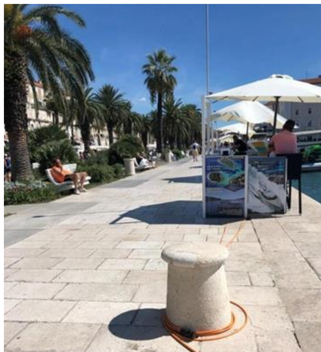
Sl. 8. Riva (zeleni dio uz more), 2. 7. 2019.