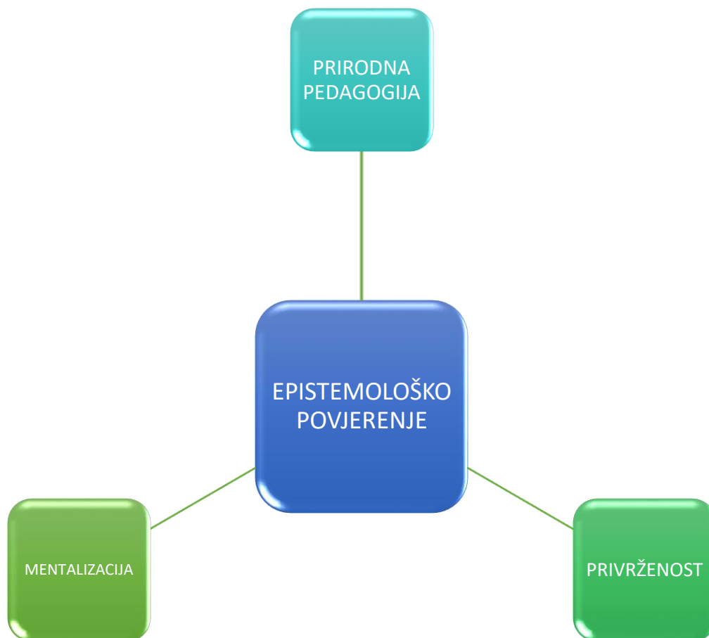
Slika 3: Suodnosi epistemološkog povjerenja

Želja je autorice ovoga rada proširiti pedagojsku teoriju o pedagoškom odnosu koristeći se psihoanalitičkom teorijom epistemološkog povjerenja. Međutim, kako bismo objasnili značaj teorije epistemološkog povjerenja, a onda ga tek doveli u suodnos s pedagoškim odnosom, moramo prije svega objasniti temelje na kojim ta teorija počiva, a to su prije svega, teorija prirodne pedagogije Csibre i Gergelyja , teorija mentalizacije autora Fonagyja i suradnika te Bowlbyjeva teorija privrženosti .