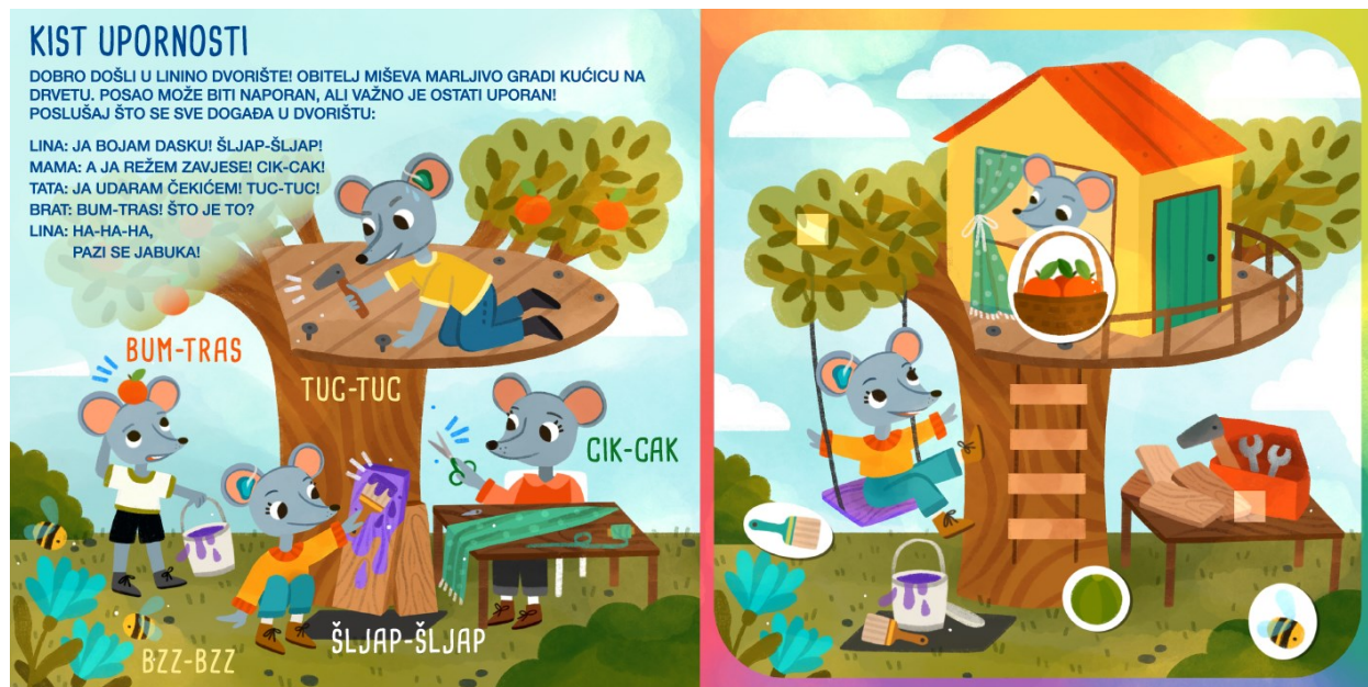
Slika 6. Kist upornosti - prikaz nakon pomicanja interaktivnih sastavnica

Roditelj potiče dijete na traženje i zamišljanje mogućih zvukova na ilustraciji. Osim traženja zvukova, roditelj ohrabruje dijete na imitiranje istih uz popratno korištenje mimike i geste.