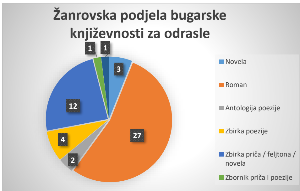
Grafikon 2. Žanrovska podjela bugarske književnosti za odrasle

Dvije antologije poezije u cijelosti posvećene su bugarskim pjesnicima - Bugarske pjesme (1886.) i Pregled bugarske poezije 19. i 20. stoljeća (2012.). Objavljene su i četiri autorske pjesničke monografije: Poezija Penje Peneva (1971.), Viteški zamak Hrista Jasenova (2006.), Hodočasnik svjetla Romana Kisjova (2008.) te Divlja priroda Beloslave Dimitrove (2017.).