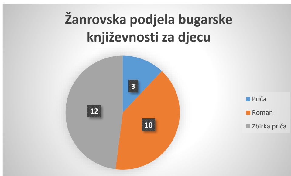
Grafikon 3. Žanrovska podjela bugarske književnosti za djecu