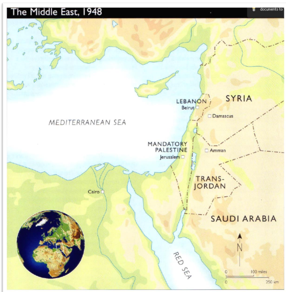
slika 1. Prikaz Bliskog Istoka 1948. godine