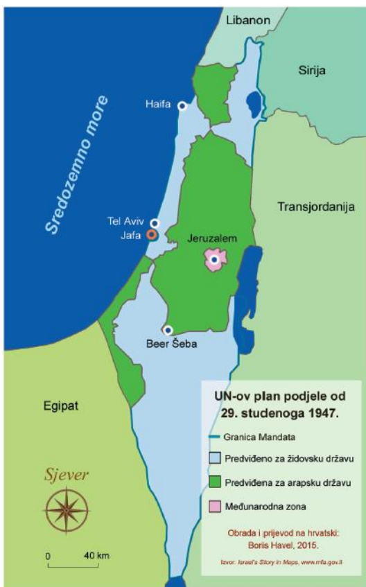
Slika 2. Prikaz UN-ove podjele Mandatne Palestine (preuzeto iz Havel 2015: 112)

Rat 1948. - koji je u arapskom svijetu nazvan Prvim palestinskim ratom, a palestinski (arap. النكبة, al-Nakba) što znači katastrofa. Židovi su ga nazvali Rat za neovisnost (hebr. מלחמת העצמאות, milhemet ha'acmaut), Oslobođilački rat (hebr. מלחמת השחרור, milhemet hašihrur) ili Rat za Osnivanje (hebr. מלחמת הקוממיות, milhemet hakomemijut). Rat je imao dvije glavne faze, prva je bila građanski rat u Mandatnoj Palestini 1947.-1948., koji je započeo 30. studenoga 1947., dan nakon što su Ujedinjeni narodi izglasali podjelu teritorija Mandatne Palestine na židovske i arapske države, i međunarodni Jeruzalem, što je židovsko vodstvo prihvatilo, a palestinski arapski čelnici, kao i arapske države, jednoglasno su se usprotivili. Ovu fazu rata povjesničari opisuju kao „građanski“ ili „etnički“ jer se vodio uglavnom između židovske i arapske vojske, uz podršku arapske oslobodilačke vojske iz okolnih arapskih država. Karakteriziran gerilskim ratovanjem i terorizmom, eskalirao je krajem ožujka 1948. godine kada su Židovi krenuli u ofenzivu i zaključili svojim porazom Palestinskih arapa u velikim kampanjama i bitkama, uspostavljajući jasne crte bojišnice (Morris 2008: 77).