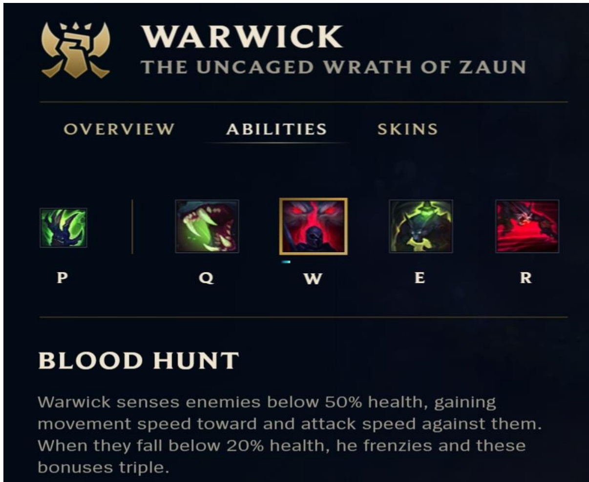
Slika 2.5. Moći i opis moći championa Warwicka ( League of Legends , 2021)

onemogućavanja protivnika ili njegovog bijega. Svaka moć ima period hlađenja (engl. „cooldown“), te taj period onemogućava igraču korištenje iste moći tijekom tog vremenskog perioda. Pasivna moć i četiri aktivne moći kolektivno se nazivaju championovim kompletom (engl. „champion's kit“). Na slici 2.5. vidljive su moći championa , prikazane slikama ispod kojih piše njihov opis.