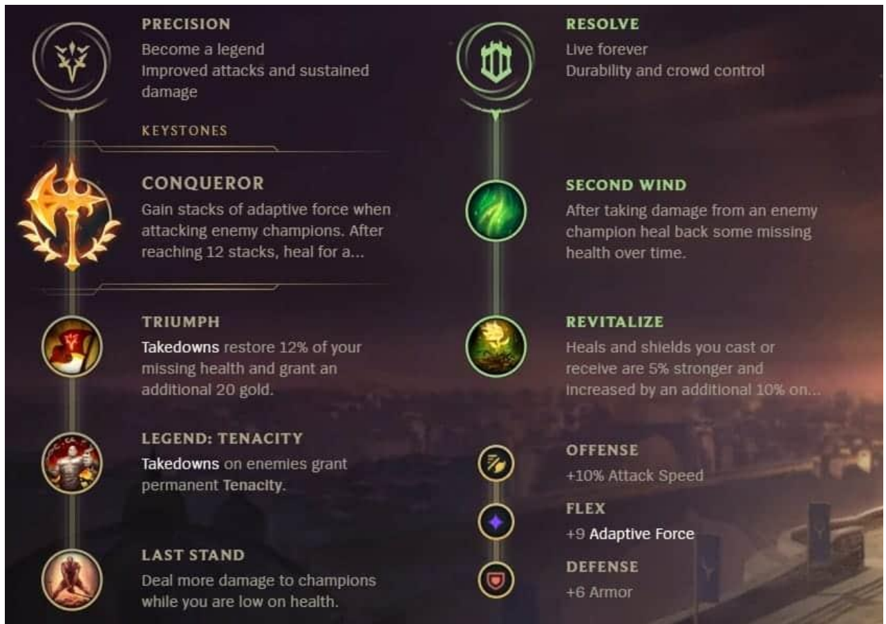
Slika 2.6. Kombinacija Precision i Resolve runi (Hollingsworth, 2020)