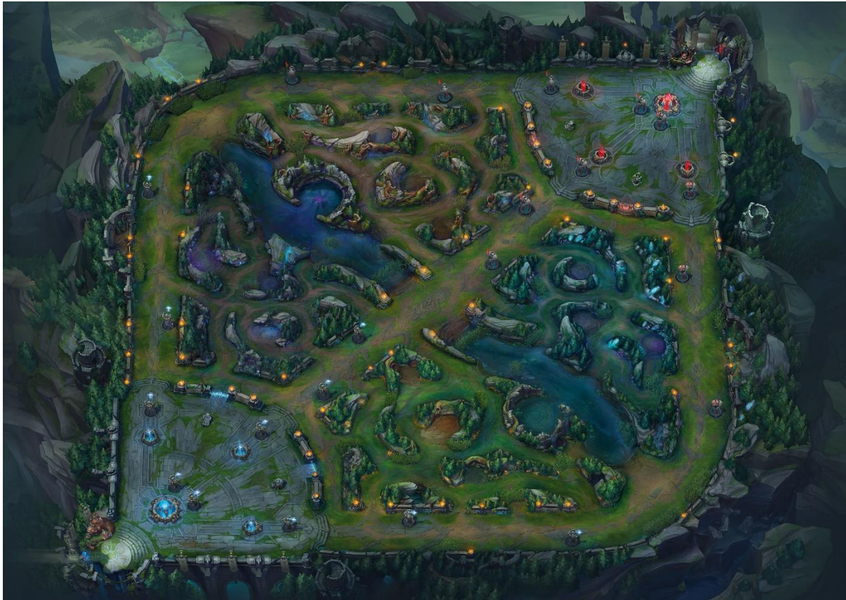
Slika 2.1. Mapa Summoner's Riffa, mape na kojoj se bazira kompetitivni League of Legends (League of Legends wiki, n.d.)

baziraju se na korištenju magija, marksman championi rade najviše štete i najveći su prioritet svakog tima, te support championi čine sve u svojoj moći da održe marksman championa na životu. Na slici 2.1. vidljiv je tlocrt mape Summoner's Rift, koja je korištena za kompetitivni League of Legends.