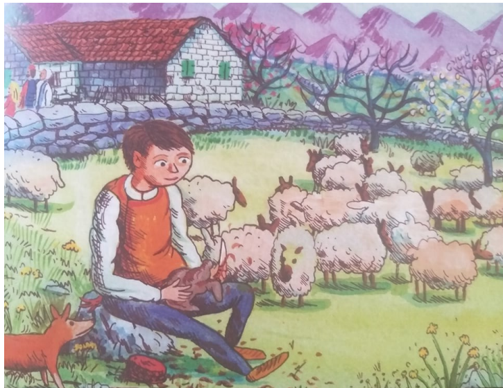
Slika 2. Ilustracija djetinjstva

predavanju) podudara se s dijelom teksta (slika 5.) u kojem autorica navodi Meštrovićevo upoznavanje s budućom ženom u studentskim danima. 96