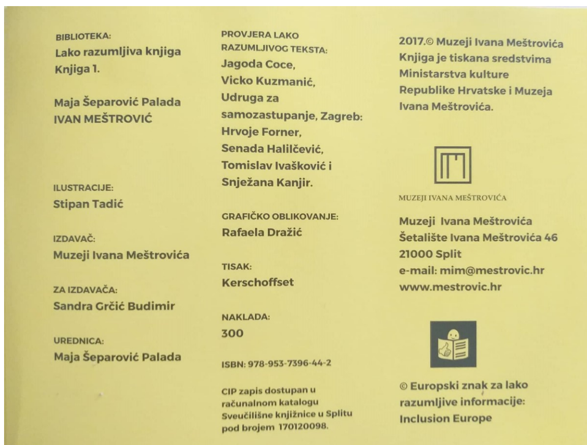
Slika 1. Bibliografski podatci prve knjige

Bibliografski podatci obje knjige navedeni su na zadnjoj stranici, na njima se mogu pronaći podatci o ilustratoru, autoru, biblioteci, izdavaču, uredniku, tisku, nakladi, ISBN, podatci o osobama koje su vršile provjeru lako razumljivog teksta, logo muzeja i kontakt te Europski znak za lako razumljive informacije: Inclusion Europe. Podatci su prikazani na slici 1.