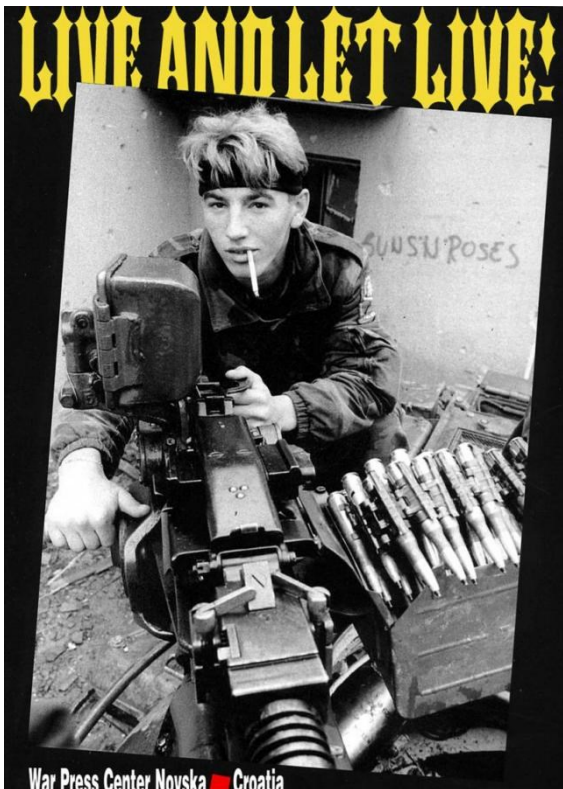
Slika 2.2. Antiradni plakat „Live and let live“ 335