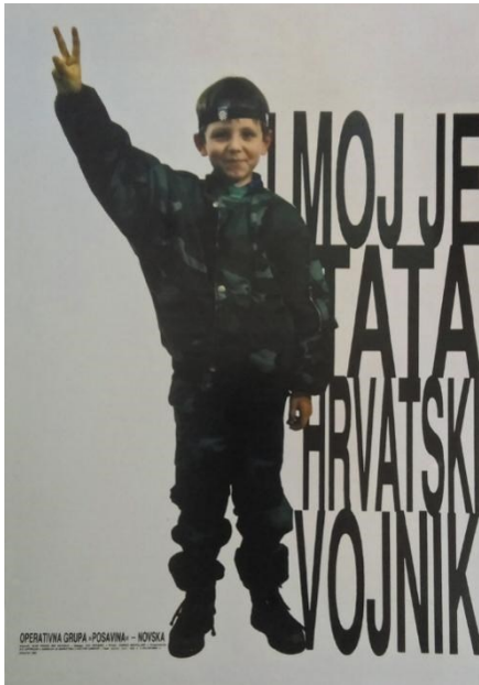
Slika 2. Antiradni plakat „I moj tata je hrvatski vojnik“ 333