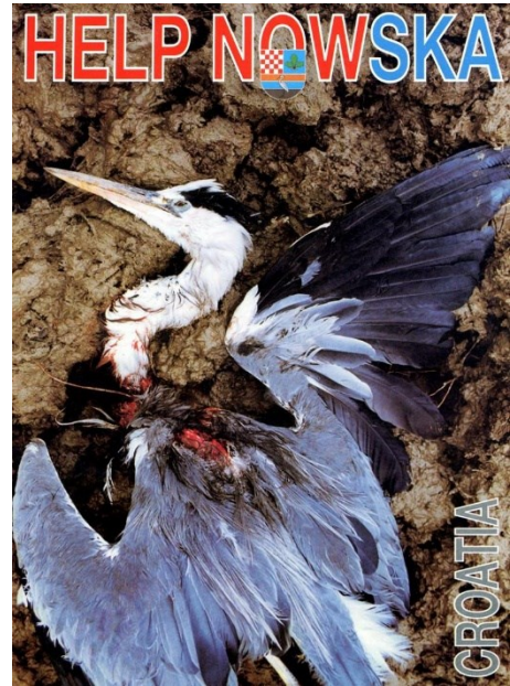
Slika 2.1. Antiradni plakat „Help Novska“ 334