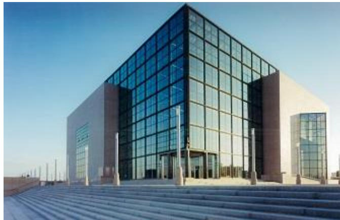
Slika 8. Zgrada današnje Nacionalne i sveučilišne knjižnice

svibnja 1995. godine (do 1990. godine zvala se Nacionalna i sveučilišna biblioteka). Nova zgrada Knjižnice obilježena je vizualnom otvorenošću i prostranošću, a Stipanov (2015: 309) je gotovo pjesnički opisuje i ističe „vidljivost“ njezina velikog predvorja “prema svim četirima stranama svijeta kao i prema gore, i u širinu i u visinu, poput raširenih ruku, kao da govori da ona svoje korisnike rado očekuje i dočekuje raširenih ruku i da im pruža sve što im je potrebno, na licu mjesta, u svojim prostorima ili posredstvom suvremene informacijske i komunikacijske tehnologije.” Glavan i Sršen (2010) napominju da je nakon otvorenja Sveučilišna knjižnica i dalje ispunjavala sve svoje sveučilišne zadaće te se otvarala korisnicima na nov način: puno više građe bilo je izloženo u slobodnom pristupu, što u staroj zgradi na Marulićevom trgu nije bio slučaj. Takvim funkcioniranjem Knjižnica je izgledom i funkcionalnošću slijedila primjer engleskih knjižnica u kojima je najvažniji sam korisnik i od njega sve polazi. Slika 8 prikazuje njezin vanjski stakleni dio koji kao da priziva posjetitelje da zavire u nju.