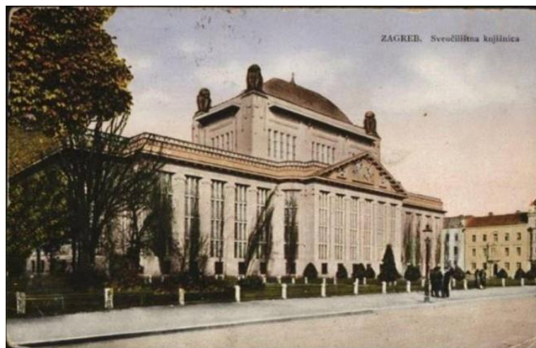
Slika 6. Zgrada Knjižnice na Marulićevom trgu

radilo o istinskom predvorju hrama znanja, što je takva knjižnica svojim sadržajem doista i bila. Dodaje da se Knjižnica tada ubrajala među tzv. velike knjižnice, s više od 125 000 svezaka, kakvih je tada u svijetu popisano samo 325. Nova je zgrada bila poticaj za novu organizaciju i uređenje Knjižnice (i) u vezi njezine dvojne funkcije, koju je novi ravnatelj Velimir Deželić htio potvrditi i promjenom naziva u Zemaljska i sveučilišna biblioteka, ali njegov prijedlog nije prihvaćen. Iako je nova zgrada uvelike pomogla u rješavanju dotadašnjih problema Knjižnice, u njoj je također bilo nekih propusta, npr. spremište za knjige bilo je smješteno u južnom dijelu zgrade gdje su knjige bile izložene djelovanju sunca, a glavne čitaonice koje su bile smještene u sredini zgrade imale su premalo svjetla. Preseljenje Knjižnice s današnjeg Trga Republike Hrvatske na današnji Marulićev trg izvršeno je u samo desetak dana u listopadu 1913. godine, dok je Knjižnica čitavo vrijeme bila otvorena korisnicima. Slika 6. prikazuje njezin vanjski izgled.