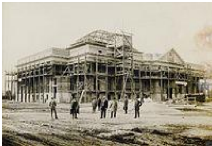
Slika 5. Zgrada Knjižnice na Marulićevom trgu u izgradnji

Konačno 1899. godine Vlada u Sabor šalje prijedlog za podizanje nove zgrade Sveučilišne knjižnice, ali je tek 1906. godine počeo aktivan rad na tom projektu. Tijek radova može se vidjeti na Slici 5. Konačno 14. ožujka 1907. godine Sabor je donio zaključak o gradnji knjižnice, a 1909. godine raspisan je natječaj za gradnju. Na temelju natječaja prihvaćen je nacrt zagrebačkog arhitekta Rudolfa Lubynskog. Ban Tomašić je 1910. godine uvjetovao da u novoj zgradi bude smješten i arhiv, a u rano proljeće 1911. godine započinje gradnja knjižnice (Glavan i Sršen, 2010).