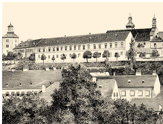
Slika 3. Zgrada Pravoslavne akademije na Gornjem gradu prije dogradnje 2. kata

Godine 1857. Knjižnica je preseljena u nove prostorije tada već Pravoslavne akademije u zgradi na Katarininom trgu (Slika 3), a prvi puta uređena je i zasebna prostorija u funkciji čitaonice. Knjige su bile smještene na 36 visokih polica za knjige s dubokim pretincima tako da su bile raspoređene u dva reda, a postojala je i sobica u kojoj su se odlagali duplikati (Rojnić, 1974). Smodek je katalogizirao čitav fond: načinio je abecedni katalog u obliku listića, te još jedan katalog u formi knjige: mjesni, abecedni i stručni (Glavan i Sršen, 2010). Na početku svoje uprave Smodek je naišao na nered u posuđivanju knjiga pa je ograničio njihovo posuđivanje izvan Knjižnice na profesore Akademije i gimnazije i na druge obrazovane i ugledne osobe (Rojnić, 1974). U izvješću koje je napisao za školsku godinu 1859./1860. stoji da fond knjižnice broji otprilike 15 910 knjiga, brošura, rukopisa i zemljopisnih karata, a do kraja školske godine 1873./1874. taj broj porastao je na 19 881 jedinica građe (Verona, 1987) Matija Smodek ostao je na čelu Knjižnice do prve godine po otvorenju modernog Sveučilišta (1874.) dakle, do 1875. godine (Glavan i Sršen, 2010).