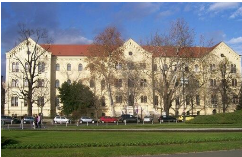
Slika 4. Današnja zgrada Pravnog fakulteta u Zagrebu

Kostrenčić je odmah po preuzimanju dužnosti voditelja Knjižnice upozorio na problem prostora, a problem je rastao s obzirom na to da je Knjižnica neprekidno povećavala fond i postepeno širila svoje djelatnosti. On je još 1876. godine vizionarski spominjao potrebu podizanja nove zgrade za Knjižnicu što bi bilo jedino pravo i dugoročno rješenje problema pa se za tu ideju borio i zauzimao idućih godina (Rojnić, 1974). Problem je privremeno riješen kada je 1883. godine Knjižnica preseljena u zgradu Sveučilišta u Donjem gradu, tj. današnju zgradu Pravnog fakulteta u Zagrebu (Slika 4). Od tada ona sve više služi svojoj namjeni: đачka čitaonica dobiva više mjesta (60) te se produljuje njezino radno vrijeme, a broj posudbi naglo raste (Glavan i Sršen, 2010). U toj zgradi Knjižnica je dobila đачku te profesorsku čitaonicu, a od 1894. godine i čitaonicu rijetkih knjiga (Rojnić, 1974).