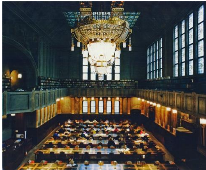
Slika 7. Velika čitaonica Sveučilišne knjižnice na Marulićevom trgu

zahtjev za dostavom takve građe u kojem je tražio i dostavu kazališnih oglasa te dopuštenje za kupnju političkih novina. Uvidjevši da su mnogi nakladnici nemarni, predložio je da se za dostavu obveznog primjerka zaduže tiskare što je također bilo prihvaćeno i odobreno. Po uvođenju pisaćeg stroja krenula je izrada stručnog kataloga koji je Deželić podijelio na petsto struka. Katalog je dovršen 1918. godine i predan korisnicima na uporabu. Stipanov (2015) dodaje da su prvi put kataložni listići bili napravljeni prema međunarodnom formatu, pa su prema tome izrađene i kataložne ladice. Deželić je ujedno uveo i među-knjižničnu posudbu, a u novoj organizaciji Knjižnice uveden je i Hrvatski odjel za sveukupnu hrvatsku tiskanu riječ. Također je od Vlade tražio promjenu Pravila za biblioteku iz 1876. godine kako bi se i studentima i ostalim građanima omogućila posudba knjiga, a ne samo akademikima, profesorima i znanstvenicima što je do tada bio slučaj i praksa, a njegov je zahtjev odobren. Slika 7 prikazuje prostranost velike čitaonice.