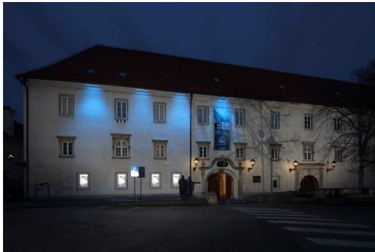
Slika 1. Zgrada (bivšeg) Isusovačkog kolegija – prvo sjedište Knjižnice

Glavan i Sršen (2010) ističu da iako su tada postojale i druge isusovačke knjižnice u Hrvatskoj, ona u Zagrebu bila je zasigurno najbogatija te je posjedovala najraznolikiji fond koji se sastojao od liturgijskih knjiga, teološke literature crkvenih otaca i učenih teologa, djela najznačajnijih antičkih latinskih i grčkih autora, povijesnih djela o povijesti Hrvatske, Ugarske i susjednih zemalja, filozofskih rasprava te književnosti i to ponajviše talijanske. Nadalje, dodaju da je djela hrvatske književnosti bilo značajno manje, ali se u knjižnici moglo pronaći sve tadašnje dostupne rječnike poput znamenitih djela hrvatskih leksikografa, Belostenčev Gazophylacium iz 1740. godine i Lexicon latinum dvojice zagrebačkih isusovaca Franje Sušnika i Andrije Jambrešića iz 1742. godine.