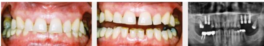
Slika 2a-c. Posljedice ranih ekstrakcija. Teško planiranje liječenja.

Opis problema trebao bi, osim jasne stomatološke dijagnoze, obuhvaćati i procjenu zuba i njihova značenja za točno određenog pacijenta, kako kratkoročno tako i, možda još važnije, dugoročno. Većina pacijenata umjesto razumijevanja svoje dugoročne stomatološke procjene želi rješenje problema „sada i ovdje“. Često su i financije odlučujući čimbenik koji nažalost utječe na to da kratkoročne i brze odluke prevladavaju. Vidi slučaj 1 (slika 2).