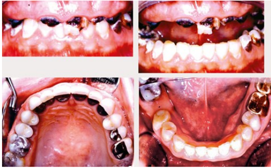
Fig. 3a-d. Socialt och ekonomiskt svårhanterat. Långsiktig, succesiv planering och behandling.

Utredning, fullständig röntgenundersökning, diskussion och information är ofta lågt arvoderat, vilket kan bidra till brister i dessa avseenden.