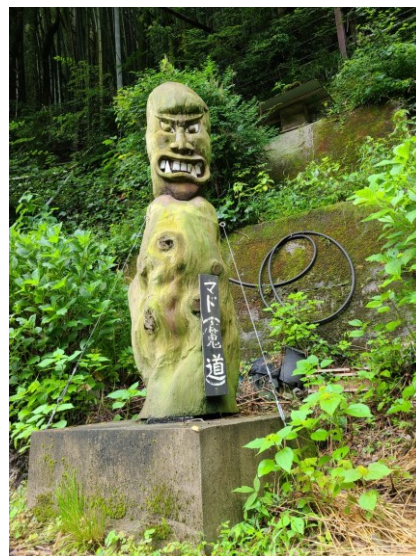
slika 8 - Mado

Po cijeloj Iya regiji se mogu pronaći priče o ljudima koje je opsjeo Mado. Ljudi slabog karaktera mogu biti opsjednuti i Mado ih može natjerati da počine teške zločine kao što je ubojstvo. Često se za one koji počine takve zločine kaže da ih je opsjeo Mado. Također, ako je netko nestao ili je umro tragičnom smrti se kaže da je Mado kriv za to. Ovaj yōkai je duh čovjeka koji je vodio loš život i počinjavao zločine.