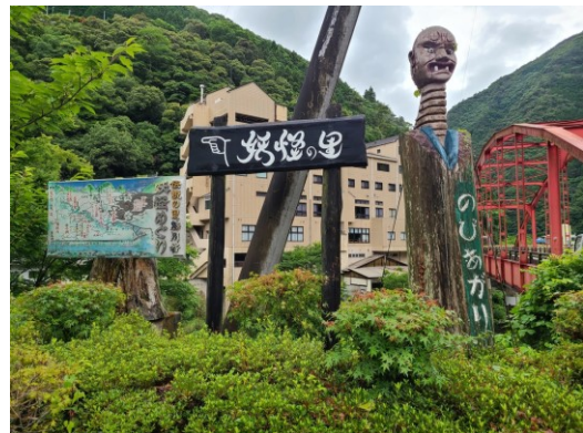
slika 4 - Nobiagari

Nobiagari se nalazi na ulazu u Yōkai selo. Kip je vidljiv sa ceste za aute i kolnika koji vode prema mostu od stanice, a ulaz u selo i kip su na cesti prije prelaska mosta s lijeve strane. Pokraj kipa je prvi od putokaza koji vode posjetioaca u pravom smjeru. Sa strane je i ilustrirana karta cijelog puta s postajama na japanskom jeziku. Kip se sastoji od dva dijela izrađenog iz jednog debla. Na donjem dijelu debla, na zelenoj pozadini stoji ime yōkaija, a dio se otvara u v-izrez obojan plavom bojom. Drugi, gornji dio izlazi iz donjeg dijela u obliku visokog vrata s glavom na vrhu. Izraz lica je ljutit s otvorenim zubima i vidljiva dva zuba te očima koje gledaju prema cesti (prema posjetiocu).