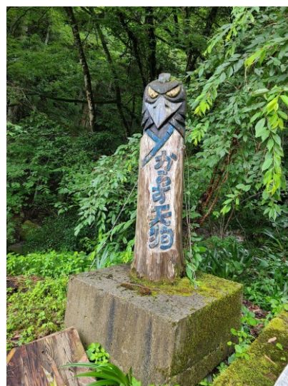
slika 14 – Karasu-Tengu

Karasu Tengu je jedan od vrsta Tengua koji živi u njihovom selu.