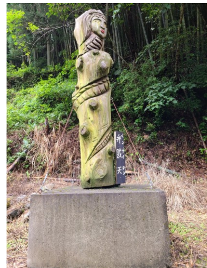
slika 6 - Benzaiten

Ovaj kip je izradio gospodin Shimooka (Shoichi Shimooka, 5. 7. 2020.). Kip se nalazi na postolju od velikog kvadratnog plosnatog kamena te ga na mjestu drže metalne sajle. Kip je kružnog oblika s glavom na vrhu izrađen iz jednog komada drveta blage žutozelene boje. Glava je ženska s dugom kosom, žutim očima i crvenim ustima neutralnog izraza lica. Iz glave izvire zmijsko tijelo koje u krug obavija deblo. Po kipu se naziru kružne ispupčene formacije koje su vjerojatno baze odrezanih grana. S desne donje strane je ime kipa na uskoj ploči crne pozadine ispisanom bijelim slovima na japanskom jeziku.