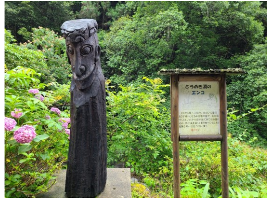
slika 5 – Doromeki-buchi-no-Enko

utapa. Enko to može raditi iz zabave ili za dar bogu zmaju. Dar za boga je shirikodama što je fiktivni organ koji se nalazi blizu anusa. Ime Enko možda dolazi od majmuna sa crvenom zadnjicom jer ona podsjeća na shirikodamu . Enko je poseban naziv za Kappu, poznatog yōkaija širem Japana, koji se koristi za ovog yōkaija u regiji. Kappa ili Enko tradicionalno izgledaju kao dijete s kožicom između prstiju što ih čini dobrim plivačima, kornjačinim oklopom na leđima te tanjurom na glavi ispunjenog vodom. Ako se voda izlije ili tanjur pukne, yōkai gubi moć. Kappa se može pojaviti bilo gdje je duboka voda sa strmim i sliskim rubom. Yōkai iz priče koju predstavlja kip je samo Enko, tj. Kappa koji se pojavljuje na toj specifičnoj lokaciji.