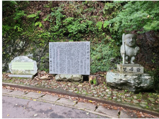
slika 20 – Konaki-jiji – kip od kamena

Ovaj kip stoji na dva postolja. Jedan je kamen nepravilnog oblika na kojem je drugo kameno postolje oblika kvadrata s uklesanim imenom. Glava mu je nepravilnog ovalnog oblika izrazom lica djeteta koje se smije. Kip ima plašt i odoru s natpisom 金 (kane). U desnoj ruci drži lizalicu, a u lijevoj štap. Na postolju kipa se nalazi više desetaka kovanica što simbolizira poštovanje 38 .