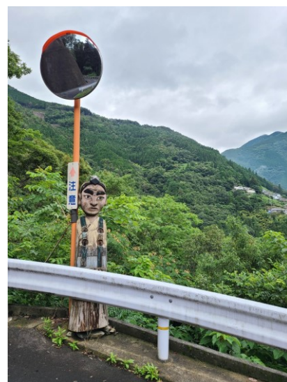
slika 11 – Yama-bushi

Ovaj kip predstavlja Yama-bushija ili ratnika s planine koji je porazio Yama-jichija. U davnoj prošlosti se pojavio čovjek s planine koji je izgledao kao div, ali licem i oblikom nije bio različit od drugih ljudi. Počeo je terorizirati mještane krađući stoku, uništavajući polja i napadajući mlade žene. Jednoga dana se je pojavio Yama-bushi koji je rekao da će poraziti diva. On je skuhao vruće