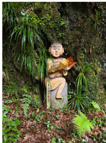
slika 10 – Kawa-Akago

Drugi naziv je Akago-buchi ili u prijevodu dijete s obale rijeke. Porijeklo priče je blizu centra mjesta gdje se nalazi mali duboki izvor. Nekoliko ljudi je čulo dječji plač koji dolazi iz tog izvora. Slične priče se mogu pronaći u drugim dijelovima Japana. Ova priča se nazire iz mjesta na kojem je postavljen kip kao i iz značenja njegova imena koje je novorođenče iz rijeke.