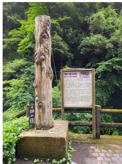
slika 18 – Nijūyon-no-Manako

Priča ovog yōkaija se ne nalazi u Yōkai Yashikiju ili u knjizi Otoshiya (Shimooka, 2017) jer su ovog yōkaija izmislila djeca. Razlog zašto ima 12 pari očiju je zato što je u to vrijeme školu završilo 12 učenika, a svaki učenik je dodao 1 par očiju (Shoichi Shimooka, 5. 7. 2020.). Natpis iza kipa govori o tome kroz što je prošla regija nakon Prvog svjetskog rata pa sve do rasta popularnosti zahvaljujući mangi Gegege no Kitarō. Nadalje govori o osnutku festivala i tome kako je to napravljeno za djecu i starije iz regije. Ovaj park je važna stanica na festivalu, a kip je primjer svjesnog stvaranja yōkaija.