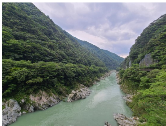
slika 1 – pogled na kanjon Ōboke i rijeku Yōshino

Ōboke je jedan od dva kanjona gdje je drugi Kōboke kojima prolazi rijeka Yōshino i čijim su djelovanjem nastali. Prvi je nizvodno, a potonji uzvodno. Oko ovih kanjona nalazi se većina stambenih objekata u tom dijelu grada Miyoshija. Kanjoni su prije bili pod administrativnom jedinicom Yamashiro općine 23 koja je otada, zajedno s drugim općinama, spojena u grad Miyoshi. Grad Miyoshi pa tako i kanjoni