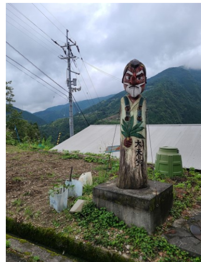
slika 13 – Oo-tengu

Ovaj kip se nalazi na vrhu brda. Sljedeća postaja je na dnu brda, s druge strane. Cijeli kip je u boji s crvenom glavom i dugačkim nosom te ozbiljnim izrazom lica. Ima crnu kosu, ali bijele obrve i bradu. Odjeća mu je kao kod Yamabushija, žućkaste boje (prije je vjerojatno bila bijela) sa zelenim tregerima, s razlikom toga da u lijevoj ruci drži zelenu biljku koja se zove yuigesa i ima 7 listova. Na kipu s desne donje strane je izrezbareno njegovo ime.