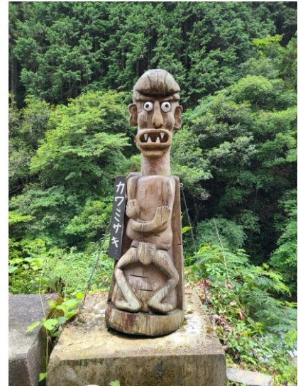
slika 22 – Kawa-Misaki

Preko ljeta bi ljudi pohrlili na rijeke zabavljati se i pecati. Međutim, rijeke su brze u ovim krajevima i ljudi su se lako utopili zbog slabih tijela jer im se prehrana sastojala od krumpira i riže. Oni koji su se utopili su postali Kawa-Misaki. To su ljutiti duhovi koji traže osvetu te bi utapali druge ljude koji su se kupali tamo i išli preduboko.