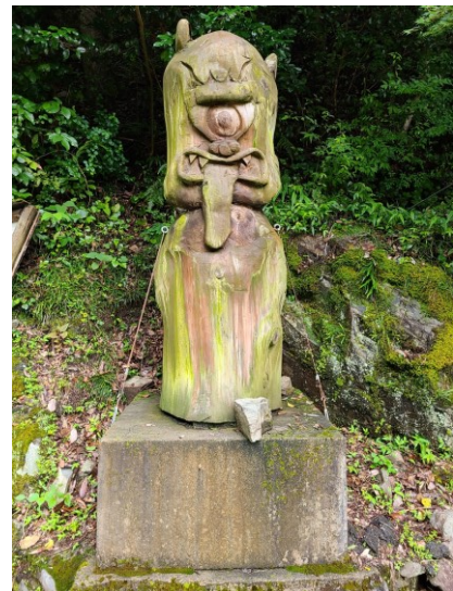
slika 21 – Hitotsu-me

Ovaj yōkai se je pojavio samo jedanput 2. kolovoza 1925. kada je povukao nastambu gospodina Jiroa s planine Ogawa 39 na kojoj je radio u dolini tako što ju je cijelu noć omotavao paukovom mrežom otkad je Jiro zaspao u