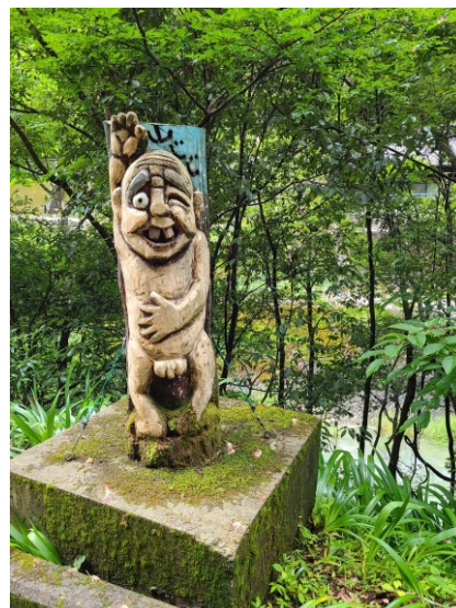
slika 9 – Yama-jiji

Ovo je starac koji se igra s djecom. Jedna se djevojčica spustila s planine gdje su njezin brat i otac sjekli drva za potpalu. Spustila se na obalu rijeke i upoznala ovog yōkaija koji je bio ćelav i nasmijan. Ovo je priča iz prošlog stoljeća.