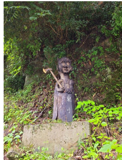
slika 7 – Oni-go

Ovaj kip je uvučen u sjenu ispod stijene. Stavljene je na kamenu podlogu. Natpis crne podloge s bijelim slovima imena se nalazi ispred kipa. Kip ima glavu djeteta s dva roga na vrhu. Ima uši, oči, nos i usta iz kojih izviru zubi. Na trupu su izrađene dvije ruke. Desna je položena prema trupu, a lijeva drži sjekiru koja je u razini s nosom kipa.