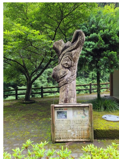
slika 16 – Kuwan-buchi

Ova priča se tiče kćeri iz bogatih obitelji. Svaku noć bi zgodan mladić posjetio kćer i ne bi joj rekao iz koje je obitelji. Roditelji bi to saznali i krenuli istraživati te na kraju pronašli da je to velika zmija koja je živi u dolini. Na kraju je kćer obično zatrudnjela i rodila jaja te potom umrla. Dakle, zmija je bila Kuwan-buchi.