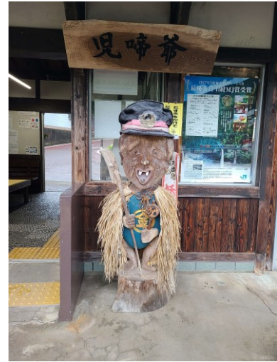
slika 2 - Konaki-jiji – kip od drveta

Kip od drveta Konaki-jijija nalazi se na stanici Ōboke te označava početak puta kao prva postaja. Iz neformalnog intervjua s djelatnicom turističkog ureda, koji se nalazi na stanici, saznalo se da je ovaj kip zamjena za konduktera koji više nije trajno postavljen na stanici. Kip dočekuje posjetioce i prenosi identitet ove regije kao mjesto rođenja Konaki-jijija. Simbol njegove uloge je u kondukterskoj kapi na glavi. Kip je u potpunosti izrađen od drveta s obojanim trupom u plavo i znakom 金 (kane) što znači novac. U lijevoj ruci drži štap, ima ogrtač od slame i stoji na panju. Lice mu je oblikovano u izraz osmjeha s vidljiva dva gornja, prednja zuba.