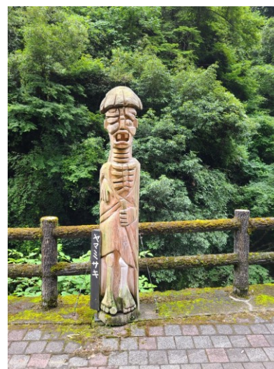
slika 17 – Yama-Misaki

Kip je izrezbaren s prednje strane, a stoji na niskom drvenom postolju. U obliku čovjeka je s pokrivalom na glavi, kosturom od tijela u ogrtaču bosih nogu. Lijevu ruku drži u poziciji koja doziva nekoga, a u drugoj ruci polusavijenog položaja drži štap. Lice je izobličeno i jasno se vide nos i otvorena usta s dva vidljiva gornja zuba. Sa strane se vide uši. Natpis s imenom je na crnoj podlozi s lijeve strane na japanskom jeziku. Ovo je treći kip u parku.