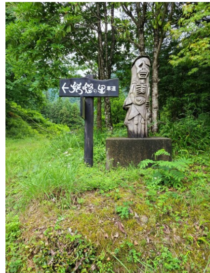
slika 12 – Hidarugami

Budući da se ovo mjesto nalazi duboko u planinama, ako je netko htio otići u susjedne krajeve, morao je prijeći često visoke planine. Kaže se da je pri prelasku morao imati riže barem za jedan zalogaj i vode za jedan gutljaj. Ako to ne bi imao onda bi ga Hidarugami opsjeo i osoba se više ne bi mogla kretati zbog čega bi preminula. Hidarugami je duh onih koji su umrli od gladi i umora na planini. Njegovo ime se može prevesti kao bog Hidaru.