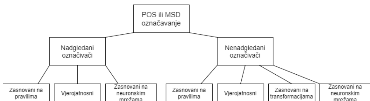
Grafikon1. Prikaz podjele POS i MSD označivača https://doi.org/10.5120/20752-3148