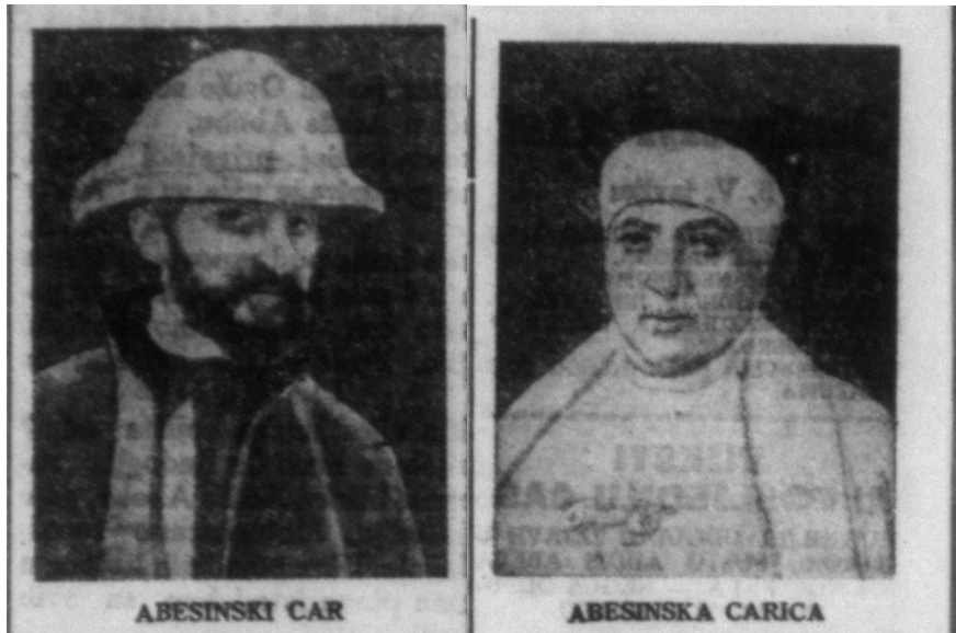
Fotografija 9.) i 10.) Abesinski car i carica, Jutarnji list – 5. V. 1936.