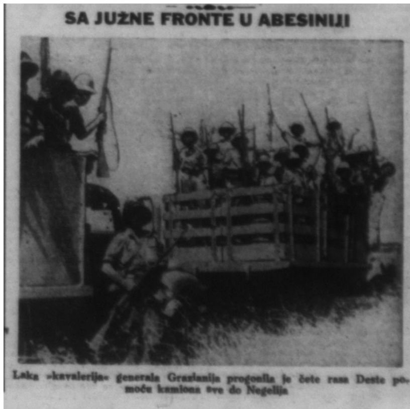
Fotografija 5.) Talijanski vojnici na ratištu u Abesiniji, Jutarnji list – 27. II. 1936.