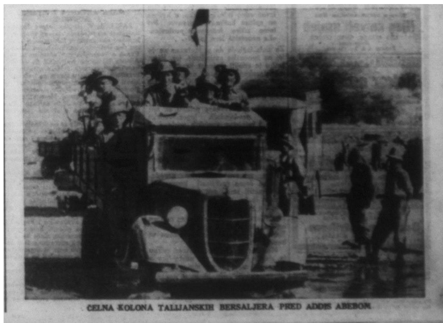
Fotografija 11.) Odredi talijanske vojske pred ulazak u glavni grad Abesinije Addis Abebu, Jutarnji list – 7. V. 1936.