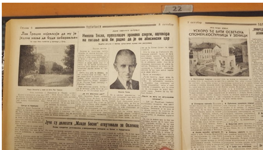
Fotografija 1.) Članak iz Politike – intervju s Nikolom Teslom