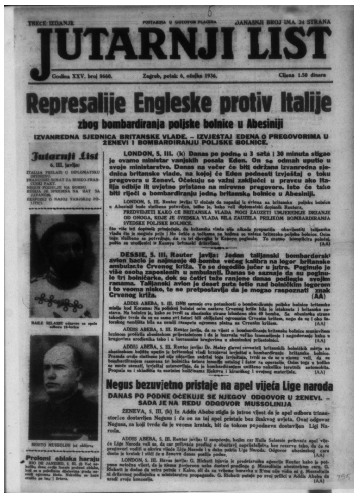
Fotografija 7.) Naslovna stranica Jutarnjeg lista od 6. III. 1936. godine, sa fotografijama vođe sukobljenih strana u ratu.