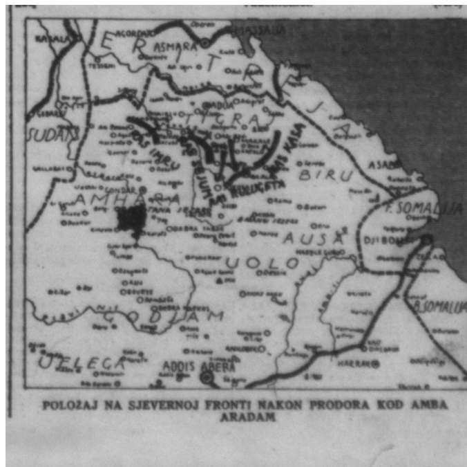
Fotografija 6.) Karta Abesinije sa ucrtanim pravcima napada talijanske vojske. (Ovakvim i sličnim kartama popraćen je Drugi talijansko-abesinski rat), Jutarnji list – 26. II. 1936.