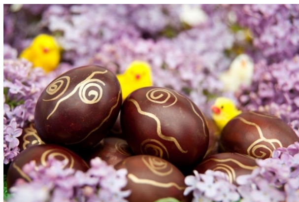
Slika 9. Uskrsna jaja: vječni simbol novog života, autorica: Roberta F.

U katoličkoj se vjeri bojanje jaja odvija na Veliku subotu, dok pravoslavci taj običaj izvode na Veliki petak. Kupovne boje koje danas prevladavaju zamijenile su tradicionalno bojanje jaja prirodnim pigmentima, napravljenim od trava, cvijeća i kore drveća. Običaj se ipak djelomično zadržao do danas te dio stanovništva Moravica još uvijek koristi ljuske luka, kore cikle i listove koprive kako bi dobili prirodne nijanse smeđe, crvene i zelene boje. Pravoslavni vjernici koji odlaze u crkvu na Uskrs dobivaju po jedno jaje koje čuvaju u kući do idućeg Uskrsa. Također, običaj darivanja, odnosno razmjenjivanja jaja rasprostranjen je među vjernicima obje vjeroispovijesti koje se, prema Marcelu Maussu „... temelji na nerazdvojuju jedinstvu osobe i darovne stvari. U daru je sadržan dio osobe koja ga poklanja, te on stvara neku vrstu materijalno-duhovne veze između darovatelja, povezujući ih na specifičan duhovni način“ (ibid. 146).