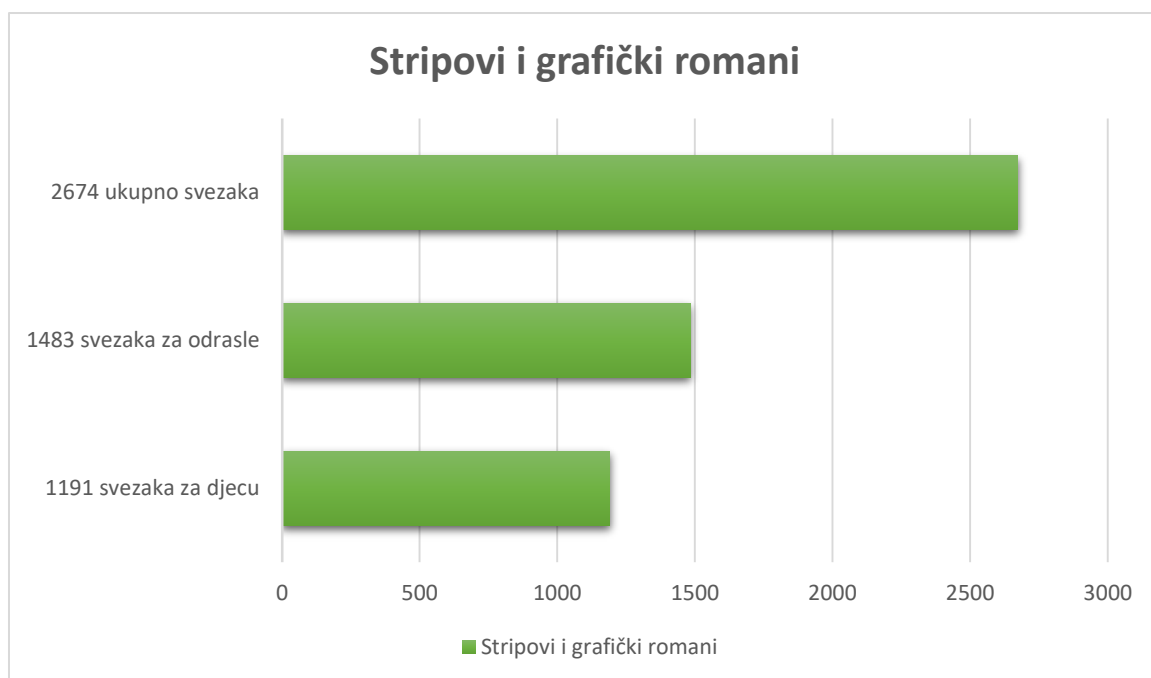
Grafikon1. 1 Trenutna veličina fonda: Rezultat prikupljen upitom knjižničara prema stanju fonda. Ožujak 2021.