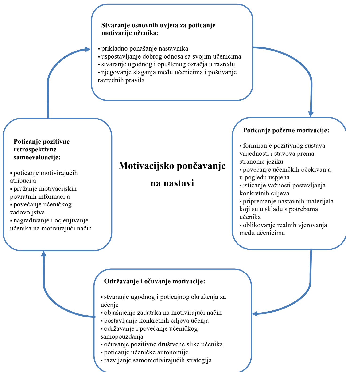
Slika 1. Komponente motivacijskoga poučavanja na nastavi stranoga jezika (Dörnyei, 2001b: 29)