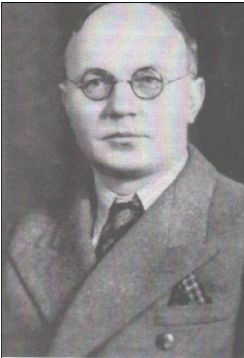
Slika 4. Vinko Žganec

godine objavio je zbirku „ Hrvatskih pučkih popijevaka iz Međimurja “, a unatoč ratnim neprilikama izazvao je oduševljenje među kulturnom i glazbenom javnosti hrvatske. 118 Ta zbirka kasnije će poslužiti za dokazivanje teritorijalne pripadnosti Međimurja Hrvatskoj tokom mirovnih pregovora nakon završetka Prvog svjetskog rata. Sam Žganec je bio jedan od članova povjerenstva za utvrđivanje granice sa Mađarskom.