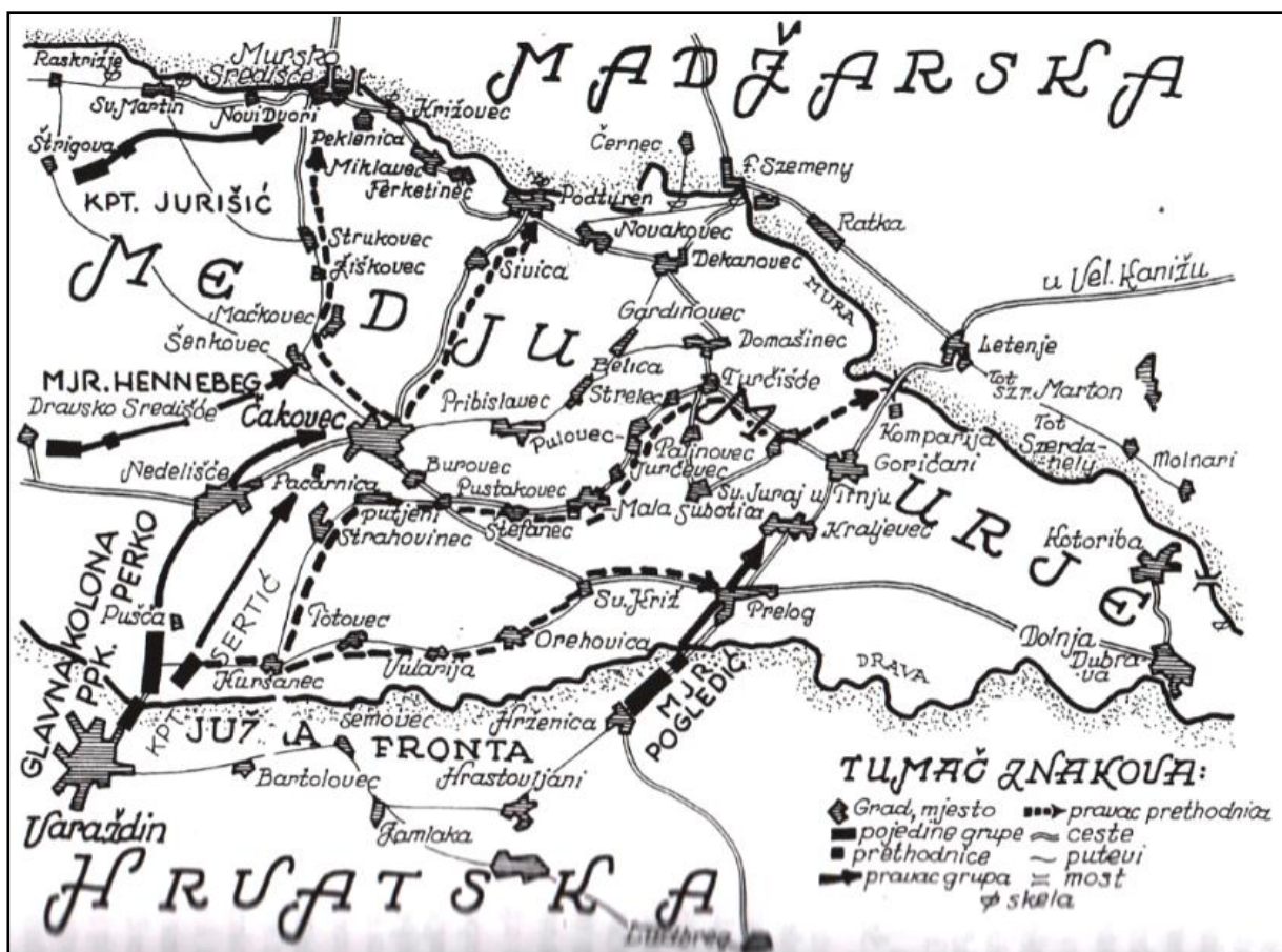
Slika 7. Plan pohoda na Međimurje

Napad je bio podijeljen na dvije fronte. Prva i glavna bila je južna fronta. Glavnina vojske imala je zadatak preko dravskog mosta i Nedelišća napasti Čakovec, istim smjerom kojim je prošla vojska u prvom pokušaju oslobođenja Međimurja. Desna kolona južne fronte imala je zadatak čamcima prijeći rijeku Dravu te osvojiti Prelog i Donji Kraljevec, a nakon toga izbiti na letinjski most na rijeci Muri kuda je prolazila glavna državna cesta iz smjera Budimpešte. Druga fronta bila je zapadna. Zadatak vojske tamo bio je prodrijeti iz Slovenije (točnije iz Ormoža i Središća ob Dravi) u Međimurje, te se preko Macinca i Mihovljana spojiti s glavninom vojske kod Čakovca. Drugi dio vojske zapadne fronte imao je zadatak iz Macinca skrenuti na sjever te preko gornjeg Međimurja osvojiti Štrigovu i potom izbiti u Mursko Središće u kojem je trebalo čuvati most preko rijeke Mure prema Lendavi.