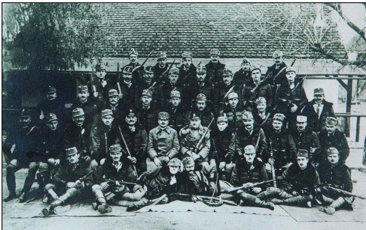
Slika 9. Pripadnici karlovačkog pješadijskog puka

Ovdje ćemo spomenuti i jedno književno djelo, odavno zaboravljenog autora Đure Vilovića, po nazivom „3 sata“. Radnja romana odvija se u Međimurju za vrijeme događaja o kojima govorimo u ovom radu. Protagonist („Runjavi“), koji je rodom s mora, a studira u Beču, dolazi u posjet prijatelju koji je svećenik u međimurskom selu Dekanovcu te na taj način pristupa nemirnim događajima iz kraja 1918. godine. Iako je riječ o književnom djelu pa samim time ne mora nužno biti povijesno točno, veoma je korisno pročitati ga jer nam daje neki dublji uvid u spomenute događaje i proširuje nam donekle kontekst svega. Izdvojiti ćemo kratki dio knjige, u kojem je glavni protagonist zbog mađarskih represalija morao pobjeći u Hrvatsku (preko Drave), koji nam pokazuje autorovo mišljenje o stavu Hrvata prema Međimurju sve do njegovog oslobođenja: „Iza Drave On Runjavi nađe drugi život. Tamo se više nije ništa znalo za Mađare, o njima se govorilo kao o davnim utvarama, što više ni djecu ne plaše. Spominjali su ih rijetko, i kao da je Drava bila ne samo međa, nego kraj svijeta. Zagrebačke novine nisu imale nikakvih izvještaja iz Međimurja. U Zagrebu se govorilo po društvancima o Međimurju kao o nekoj oranici, koja naravno pripada nama, uvijek kratko i sporedno.“ 217