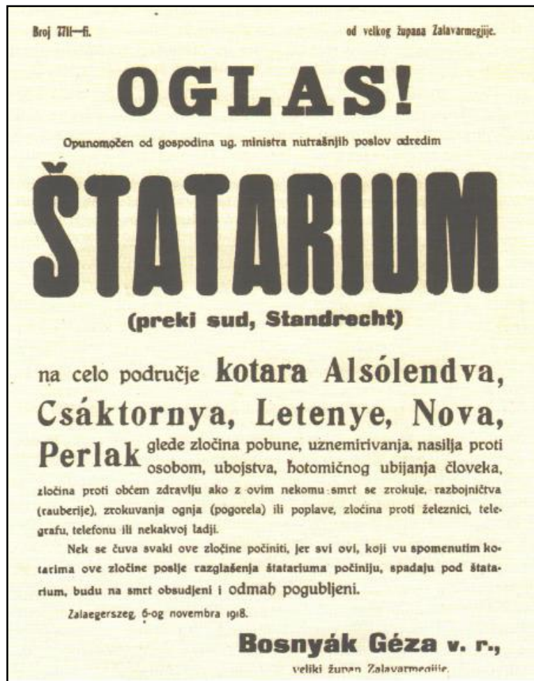
Slika 6. Proglas o prijekom sudu

Valja još jednom primijetiti da su u trenutku proglašenja prijekog suda svi nemiri u Međimurju već prestali. Isto tako, prijeki sud nalagao je kaznu svakome tko počinio bilo kakav zločin nakon njegovog proglašenja, a u praksi su Mađari zapravo provodili krvnu osvetu za događaje koji su se zbili prije 6. studenog 1918. godine.