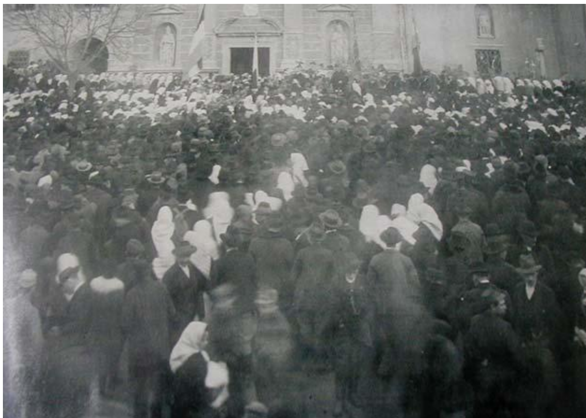
Slika 10. Međimurska narodna skupština 09.01.1919.