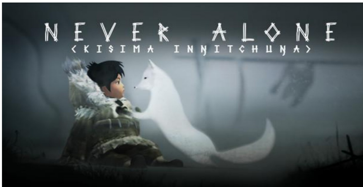
Slika 2 Nuna i arktička lisica (Never Alone 2014)