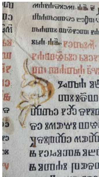
Slika 4. Inicijal na primjerku fragmenta Misala po zakonu rimskoga Dvora (1483.) Gradske knjižnice, sign. R-T.