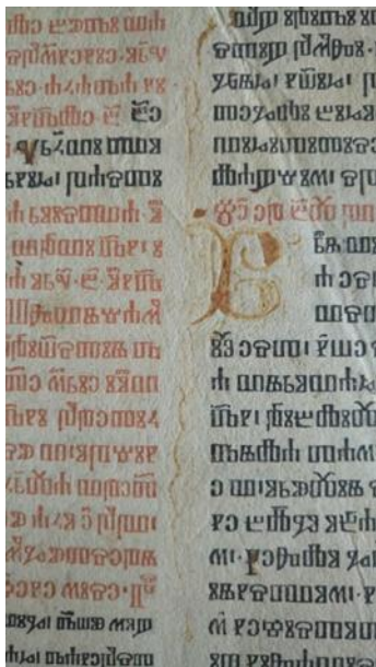
Slika 3. Inicijal na primjerku fragmenta Misala po zakonu rimskoga Dvora (1483.) Gradske knjižnice, sign. R-T.