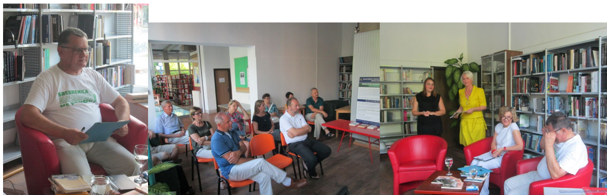
Slike 55., 56., 57. Književna tribina Bratska pisma , 2017.