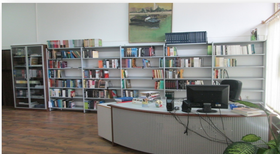
Slika 15. Nove knjižne police

Kako je Središnja knjižnica nacionalne manjine Bošnjaka značajno obogatila svoj fond, u kolovozu 2015. godine opremljena je i novim policama, korisničkim pultom i staklenim ormarom za referentnu građu.