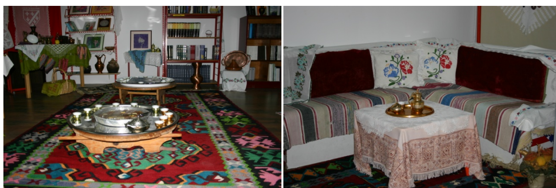
Slika 27. i 28. Izložba rukotvorina i starina Aktiva Bošnjačka žena (Iz knjižnične dokumentacije Središnja knjižnica nacionalne manjine Bošnjaka )