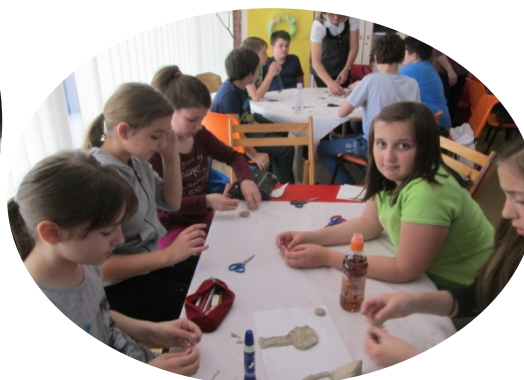
Slika 61. i 62. Kreativno-likovne radionice (Iz knjižnične dokumentacije Središnja knjižnica nacionalne manjine Bošnjaka )