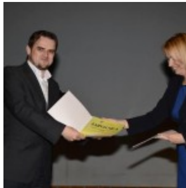
Slika 10. Donatorska konferencija

Središnju knjižnicu nacionalne manjine Bošnjaka u Sisku. 33