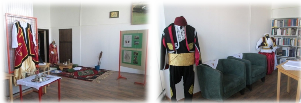
Slika 23. i 24. Izložba narodnih nošnji i rukotvorina: Gdje je knjiga, tu je moj dom...

U 2014. godini u Knjižnici Bošnjaka postavljena je izložba fotografija i knjiga povodom obilježavanja Dana Srebrenice, izložba Narodne nošnje Bosne i Bošnjaka, Istaknuti Bošnjaci i izložba rukotvorina i starina u suradnji s Aktivom Bošnjačka žena.