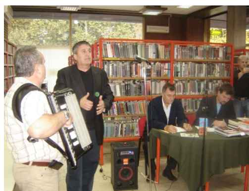
Slika 52. Dani bošnjačke kulture, 2010.