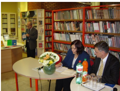
Slika 47. Promocija izdavačke djelatnosti BNZH, 2005.