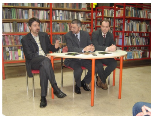
Slika 50. Promocija izd. djelatnosti KDBH „Preporod“, 2007.