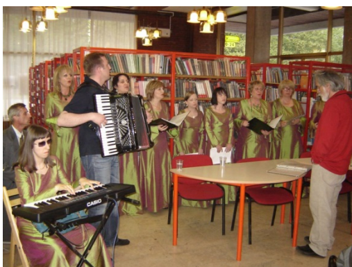
Slika 49. Nastup zbora „Bulbuli“, 2006.