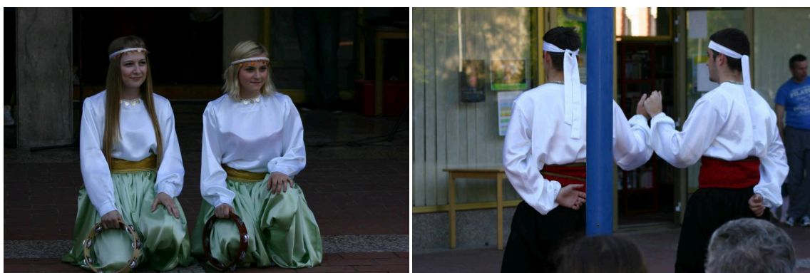
Slika 19. i 20. Nastup kulturnih društava nacionalne manjine Bošnjaka (Iz knjižnične dokumentacije Središnja knjižnica nacionalne manjine Bošnjaka te arhiva Ogranka Caprag)

Manifestacija Tjedan kulturne raznolikosti održavala se povodom Svjetskog dana kulturne raznolikosti pod motom Prijatelji iznad svega te se kroz četiri dana predstavljalo pet nacija. U cijeloj organizaciji sudjelovale su isključivo vjerske organizacije i udruge te samo djeca. Cilj je manifestacije bilo zbližavanje djece svih vjera i nacija. Manifestacija je nastavljala promociju zajedništva, ljepote i radosti življenja u svojoj vjeri i kulturi, a ujedno promovirala zajedničke vrijednosti kroz kulturu ponašanja, komuniciranja, poštivanja i uvažavanja. U tjednu multikulturalnosti predstavljala se i bošnjačka nacionalna manjina sa nastupom Bošnjačko kulturno-umjetničkog društvo Nur, djece polaznika islamskog vjeronauka i članica Bošnjačke žene. Predstavljali su se plesom, sevdalinkama, recitacijama i dramskim tekstovima. 36