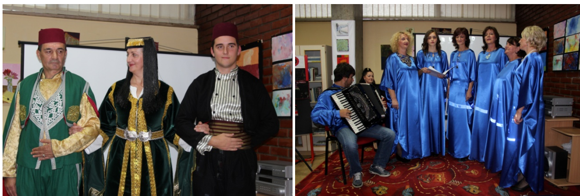
Slika 17. i 18. Nastup kulturnih društava nacionalne manjine Bošnjaka

Manifestacija Tjedan kulturne raznolikosti održavala se povodom Svjetskog dana kulturne raznolikosti pod motom Prijatelji iznad svega te se kroz četiri dana predstavljalo pet nacija. U cijeloj organizaciji sudjelovale su isključivo vjerske organizacije i udruge te samo djeca. Cilj je manifestacije bilo zbližavanje djece svih vjera i nacija. Manifestacija je nastavljala promociju zajedništva, ljepote i radosti življenja u svojoj vjeri i kulturi, a ujedno promovirala zajedničke vrijednosti kroz kulturu ponašanja, komuniciranja, poštivanja i uvažavanja. U tjednu multikulturalnosti predstavljala se i bošnjačka nacionalna manjina sa nastupom Bošnjačko kulturno-umjetničkog društvo Nur, djece polaznika islamskog vjeronauka i članica Bošnjačke žene. Predstavljali su se plesom, sevdalinkama, recitacijama i dramskim tekstovima. 36