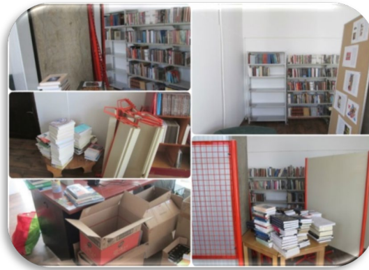
Slika 13. Pristigle donacije knjiga

Osim knjiga, knjižnica prikuplja i raznovrsne časopise.