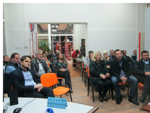
Slike 45. i 46. Tribina Ostvarivanje prava nacionalnih manjina u Hrvatskoj

Kulturne aktivnosti nacionalne manjine Bošnjaka aktivno su se provodile u Ogranku Caprag u suradnji s bošnjačkim kulturnim društvima i udrugama dugi niz godina i prije osnivanja Knjižnice Bošnjaka kroz različite promocije knjiga i časopisa, književne večeri, izložbe, obilježavanja važnih datuma manjine Bošnjaka.