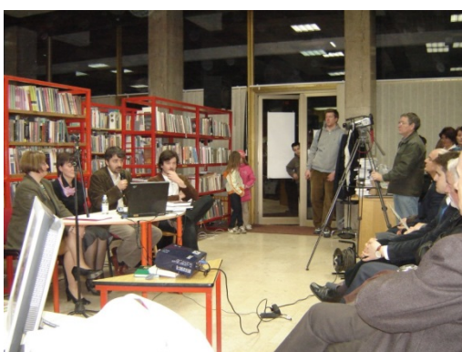
Slika 51. Dani bošnjačke pismenosti, 2009.