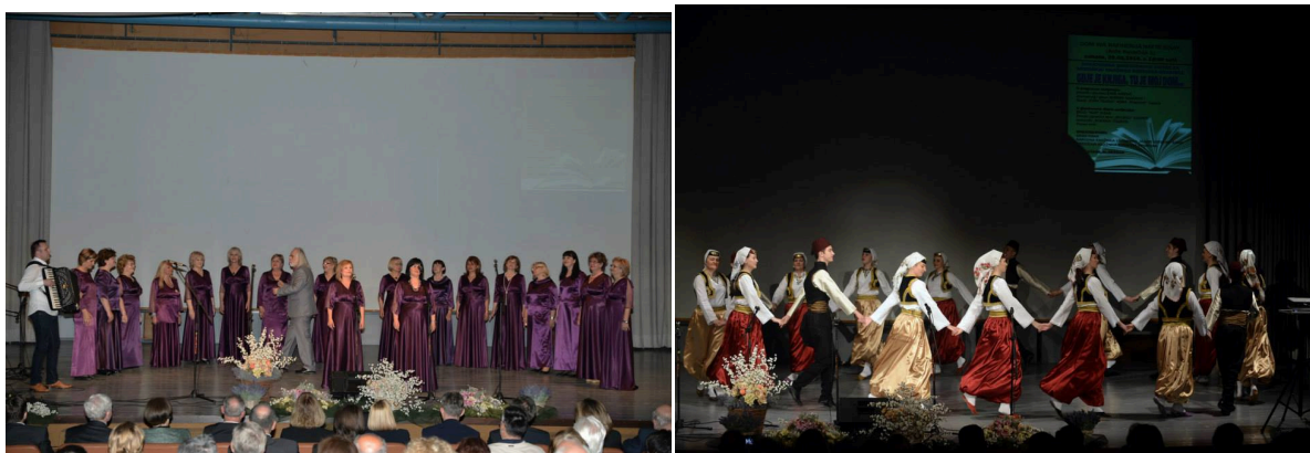
Slika 3. i 4. Nastup zbora i KUD-a „Nur“