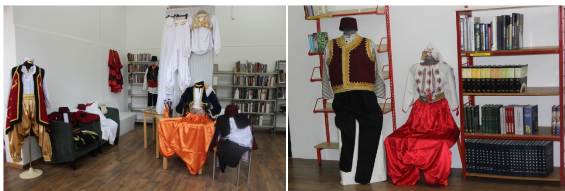
Slika 25. i 26. Izložba Narodne nošnje Bosne i Bošnjaka

U 2014. godini u Knjižnici Bošnjaka postavljena je izložba fotografija i knjiga povodom obilježavanja Dana Srebrenice, izložba Narodne nošnje Bosne i Bošnjaka, Istaknuti Bošnjaci i izložba rukotvorina i starina u suradnji s Aktivom Bošnjačka žena.