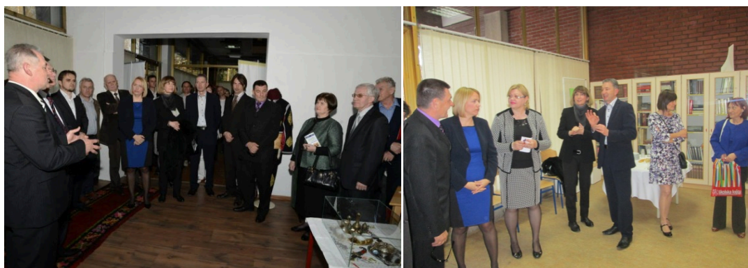
Slika 5. i 6. Sudionici Donatorske konferencije