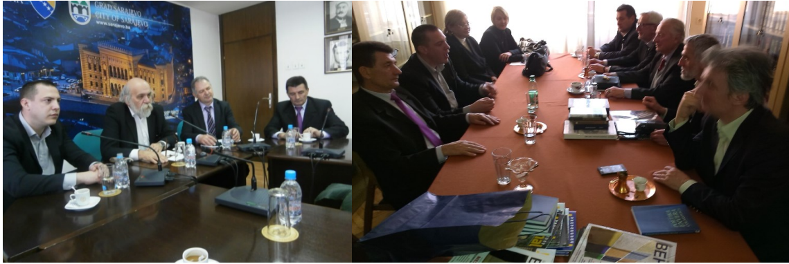
Slika 11. i 12. Delegacija grada Siska u Sarajevu