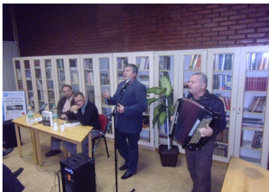
Slika 53. Festival bošnjačke kulture i kuhinje 2012.