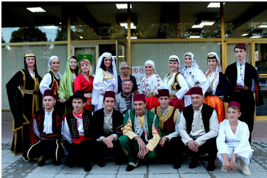
Slika 16. Članovi kulturnih društava nacionalne manjine Bošnjaka (Iz knjižnične dokumentacije Središnja knjižnica nacionalne manjine Bošnjaka )

Manifestacija Jezik roda moga održavala se u rujnu povodom obilježavanja Međunarodnog dana pismenosti. Obuhvaćala je književne večeri uz bošnjačke, srpske, češke, ruske i hrvatske pisce te su se održavale brojne literarne radionice, izložbe, predstavljanja kulturno-umjetničkih društava, dramskih i pjevačkih skupina. Jedan od dana bio je posvećen predstavljanju književnosti, tradicije, usmene predaje i vjerskih običaja bošnjačke nacionalne manjine. 35