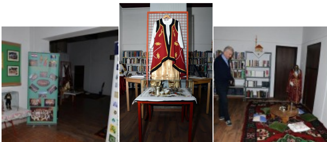
Slika 7., 8., 9. Izložba Gdje je knjiga, tu je moj dom... (Iz knjižnične dokumentacije Središnja knjižnica nacionalne manjine Bošnjaka )

Na kraju večeri, uručene su Zahvalnice čelnicima institucija koje su donacijama knjiga opremili