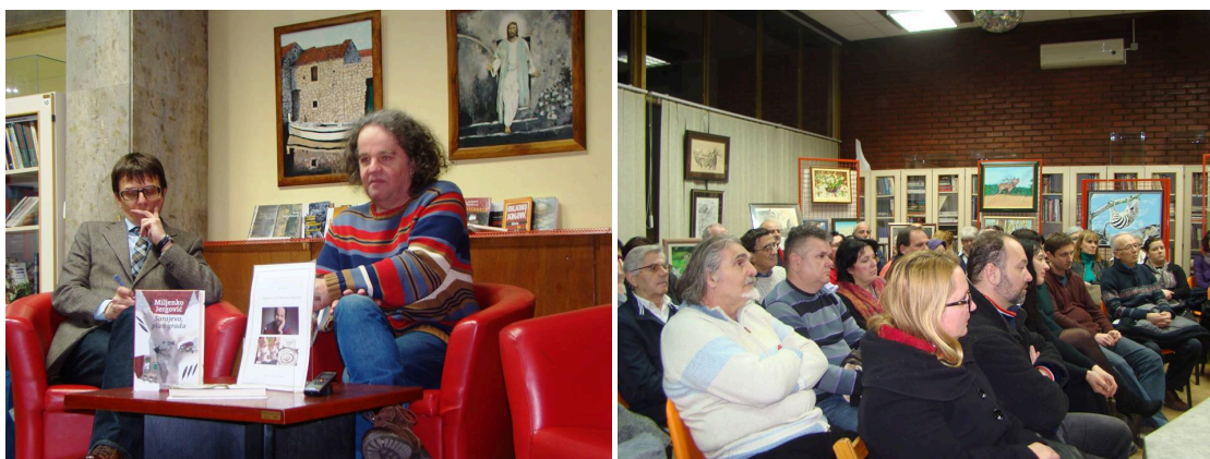
Slika 36. i 37. Književni susret s Miljenkom Jergovićem

U siječnju 2016. godine organizirana je književna večer s Miljenkom Jergovićem na kojoj je književnik predstavio svoja posljednja djela Sarajevo, plan grada i Doboši noći .