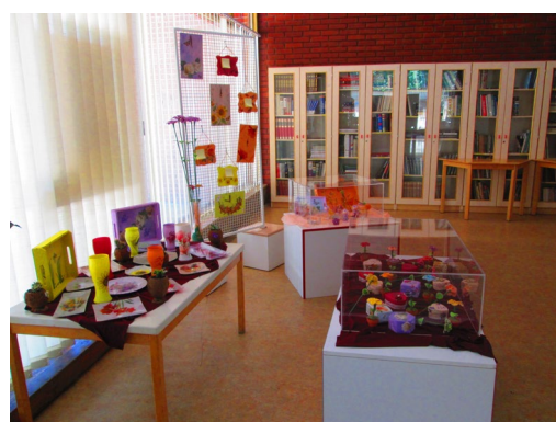
Slika 63. i 64. Cvjetni decoupage – amaterska izložba