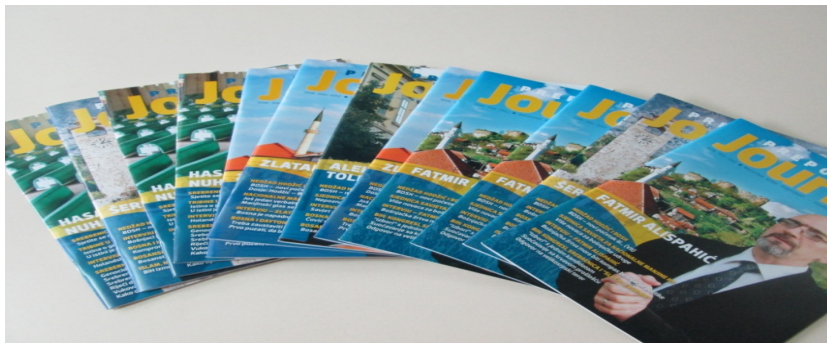
Slika 14. Časopis Journal (Iz knjižnične dokumentacije Središnja knjižnica nacionalne manjine Bošnjaka )

Zahvaljujući suradnji s Kulturnim društvom Bošnjaka Hrvatske „Preporod“ korisnici knjižnice svaki mjesec mogu dobiti besplatan primjerak časopisa Journal koji sadrži najnovije članke iz područja bošnjačke kulture.