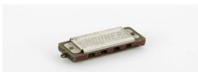
Slika 4 7