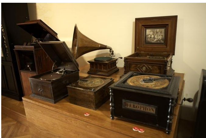
Slika 3 6