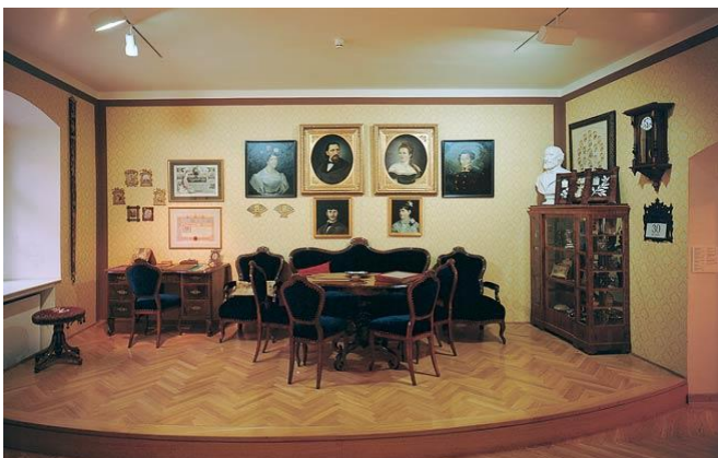
Slika 1 4

U altdeutsch (staronjemačkoj) vitrini, smješteni su vrijedni dirigentski štapići ukrašeni zlatom i srebrom s ugraviranim prigodnim natpisima koji su mu darovani na opernim premijerama. Dio Zbirke čine i notna izdanja njegovih skladbi.