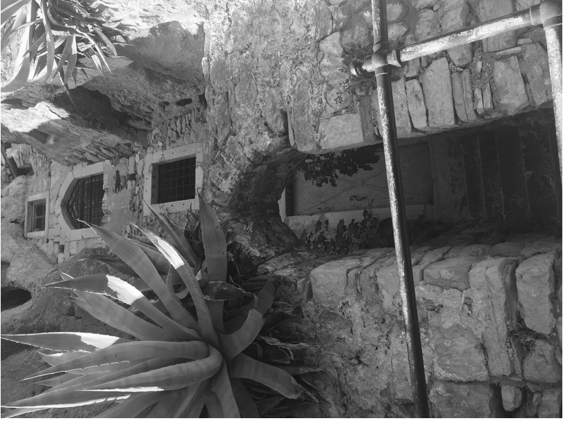
Slika 3 i Slika 4: Eremitaža iznad crkve sv. Jeronima na Marjanu: ulaz u predvorje te ozidano pročelje iza kojeg se nalazi prostrana prirodna udubina u stijeni, odnosno višekratna pustinjačka ćelija