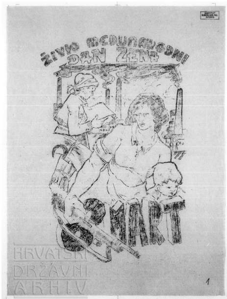
Slika 4: Letak „Živio međunarodni dan žena Osmi mart“ 207

Ono što je prethodno opisano riječima možemo najbolje vidjeti i na ovom slikovnom prikazu. Bio je to letak pod nazivom „Živio međunarodni dan žena Osmi mart“. Na letku možemo vidjeti da žena može učiti i raditi, nositi pušku i boriti se, a da u isto to vrijeme može voditi brigu o djeci. Da žena može biti ravnopravna muškarcu i da može puno više osim onoga što se od nje prije očekivalo.