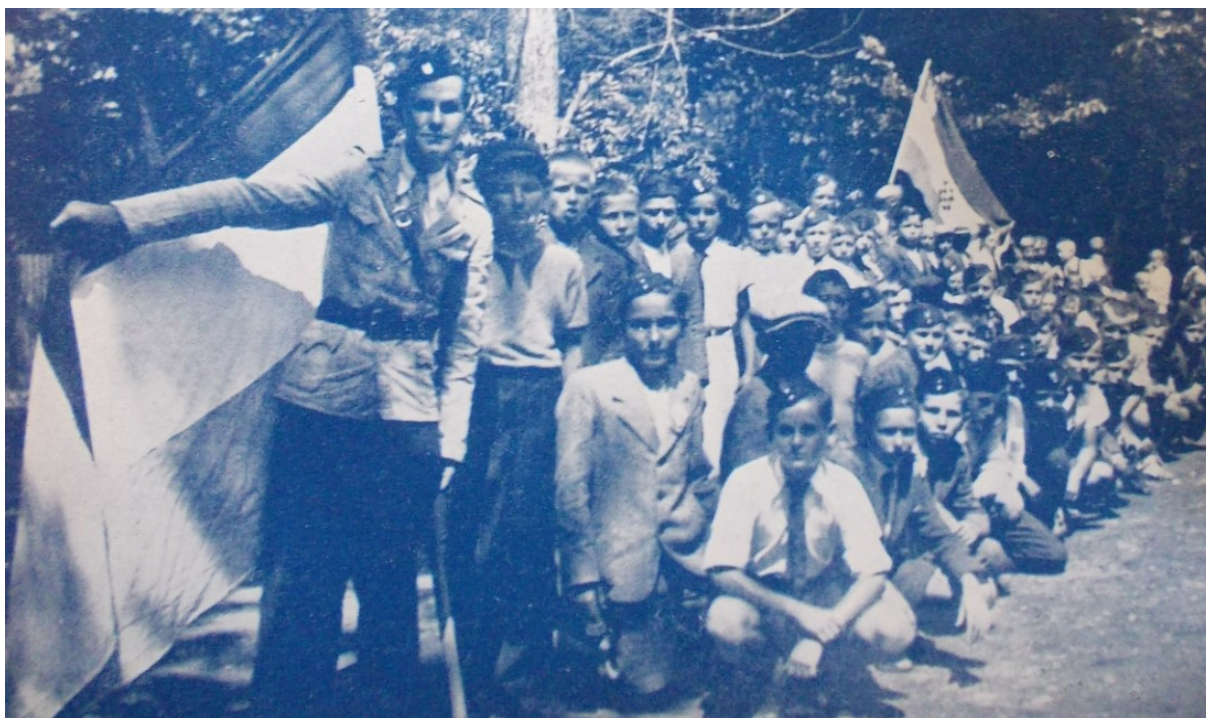
Slika 1. Ustaška uzdanica, Ustaška mladež: omladinski prilog „Ustaše“ , 10. kolovoza 1941., 49.

Disciplina, odnosno stega trebala je pripremiti djecu na službu u vojsci. Stega je shvaćena kao „dobro svojstvo čovjeka, po kome se on vlada točno onako, kako se to od njega traži.“ 168 Od malog ustaše se očekivalo da svoje nagone utiša što znači da su „cendravost“ i neposlušnost veliki prekršaji stega. 169 Od dječaka se očekivalo svakodnevno preispitivanje „da vidim, kakav sam danas bio junak?“ kako bi utvrdili jesu li se ponašali u skladu sa ustaškom stegom. Kao pomoć malim ustašama, autor članka Djeca i stega ponudio je pet pravila stega: „1. Svaku stvar staviti onamo, gdje smo je uzeli. 2. Govoriti, kada je to potrebno. 3. Ne upadati u razgovor. 4. Nikada ne reći: ne ću ili meni se ne da. 5. Svaki nalog roditelja ili starijih izvršiti točno onako, kako to oni žele, i izvršiti odmah.“ 170