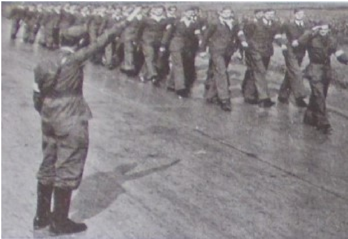
Slika 10. „USTAŠKA MLADEŽ – mladež rada – mladež budućnosti – na djelu.“, Ustaša: Vjesnik hrvatskog ustaškog oslobodilačkog pokreta br. 5, Naslovnica