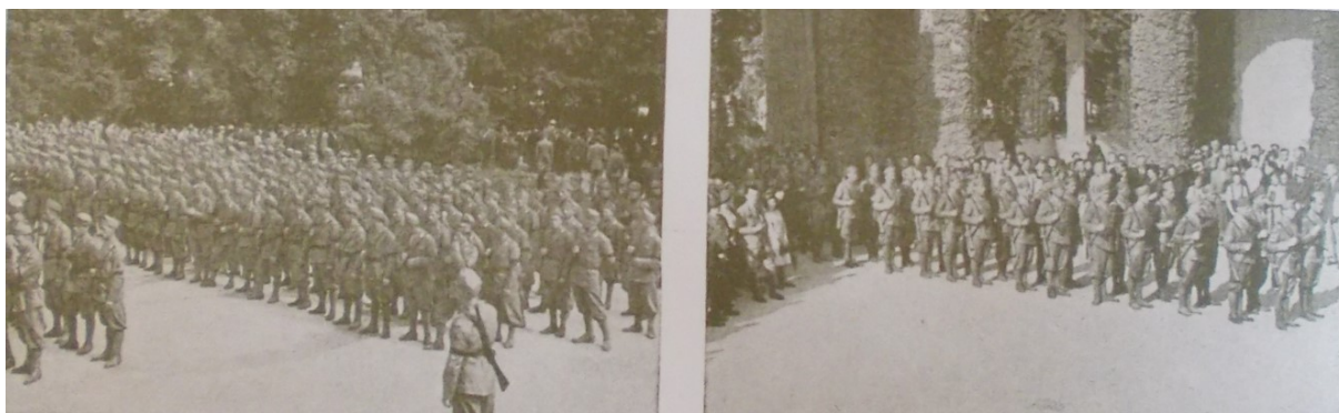
Slika 7. „Poglavnik je došao“, Ustaša: Vjesnik hrvatskog ustaškog oslobodilačkog pokreta , 7. rujna, 1941., 2.