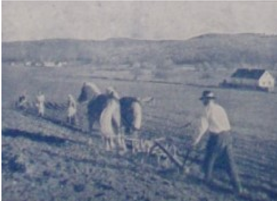
Slika 13. „PLUG I BRANA HRVATU SU HRANA“, Ustaška mladež: omladinski prilog „Ustaše“, 17. kolovoza 1941., 50.