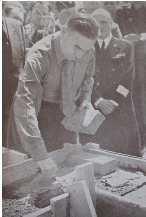
Slika 14. „Temelj svake vrijednosti jest samo rad“, Ustaša: viestnik hrvatskog ustaškog oslobodilačkog pokreta br. 11., Naslovnica