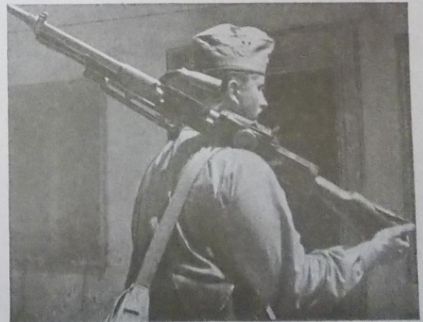
Slika 6 „Ustaške vježbe“, Ustaška mladež: omladinski prilog „Ustaše“ , 7. rujna 1941., 15.