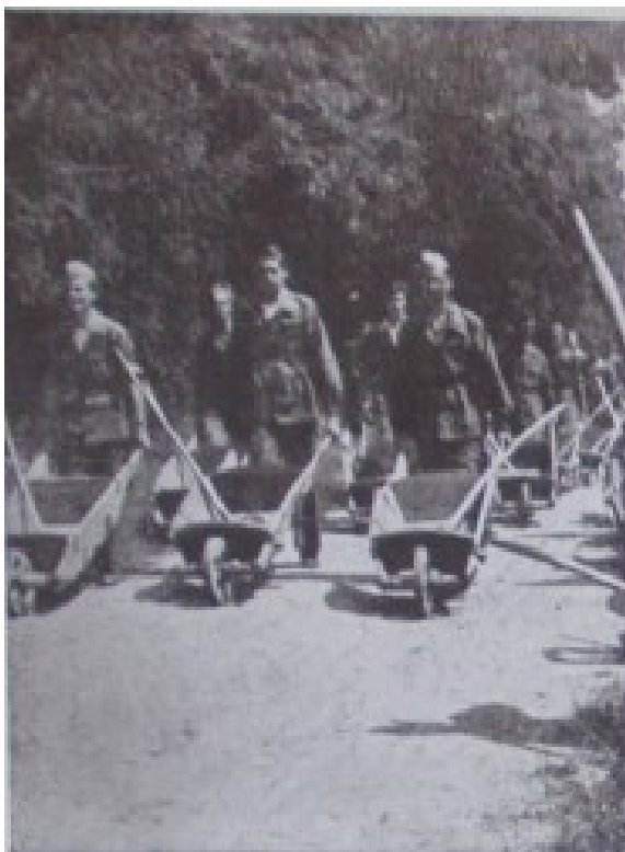
Slika 11. „USTAŠKA MLADEŽ – mladež rada – mladež budućnosti – na djelu.“, Ustaška mladež: omladinski prilog „Ustaše“ , 3. kolovoza 1941., 17.

Vizualni prikazi rada također naglašavaju kolektiv. U skladu sa ustaškom retorikom stalnog, neprestanog i neiscrпивog rada koji predstavlja stvaralački potencijal novog režima, fotografije radnika većinom prikazuju sretne, ispunjene i predane radnike. Zamjetan je nedostatak samostalnih radnika, odnosno, kroz propagandni materijal rijetko će se naići na prikaze uredskih radnika, birokrata, profesora, pisaca ili nadzornika, pa čak i samostalnih majstora fizičkih radnji. Čak i prikazi odmora od rada prikazuju suradnju u pripremi jela, suradnju u jelu i odmoru. Prikazi seljaka također naglašavaju sklad i kolektiv u radu. Izuzetak u prikazu rada kao kolektivne djelatnosti je, očekivano, Poglavnik (slika 14).