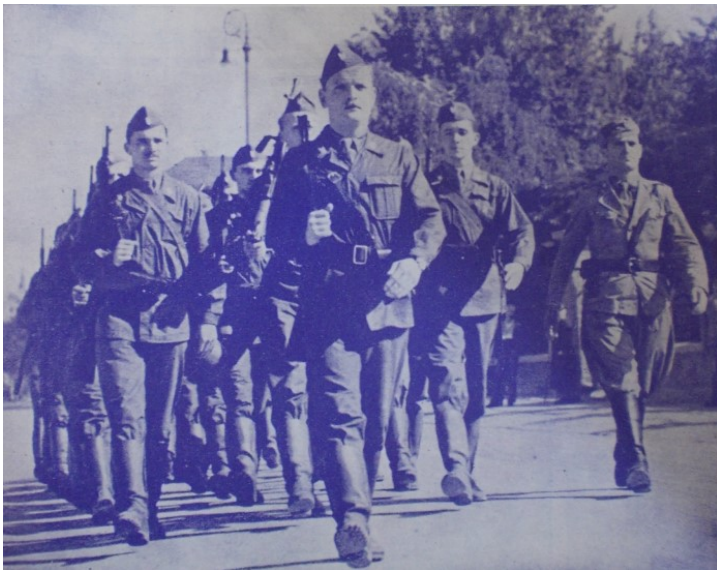
Slika 8. „Ustaše sveučilištarci u postrojbama“, Ustaša: Vjesnik hrvatskog ustaškog oslobodilačkog pokreta br. 8, 1.

„Ustaša nije silnik, nije barbar, ustaša nije rušitelj . Ustaša je čuvar teško izvojevane državne nezavisnosti, on je branitelj velikog djela svoga Poglavnika. Ustaša bdije nad grobovima uzor boraca, koji svoje živote dadoše za hrvatsku oslobodilačku stvar. I stoga jest i biti će uvijek spreman , spreman svim sredstvima uzdržati ono, što je stvoreno njegovom teškom borbom.“ 193