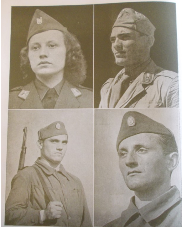
Slika 5. „Vedrina...Snaga...Ponos...Sviest... - USTAŠA!“, Ustaška mladež: omladinski prilog „Ustaše“ , 7. rujna 1941., 16.