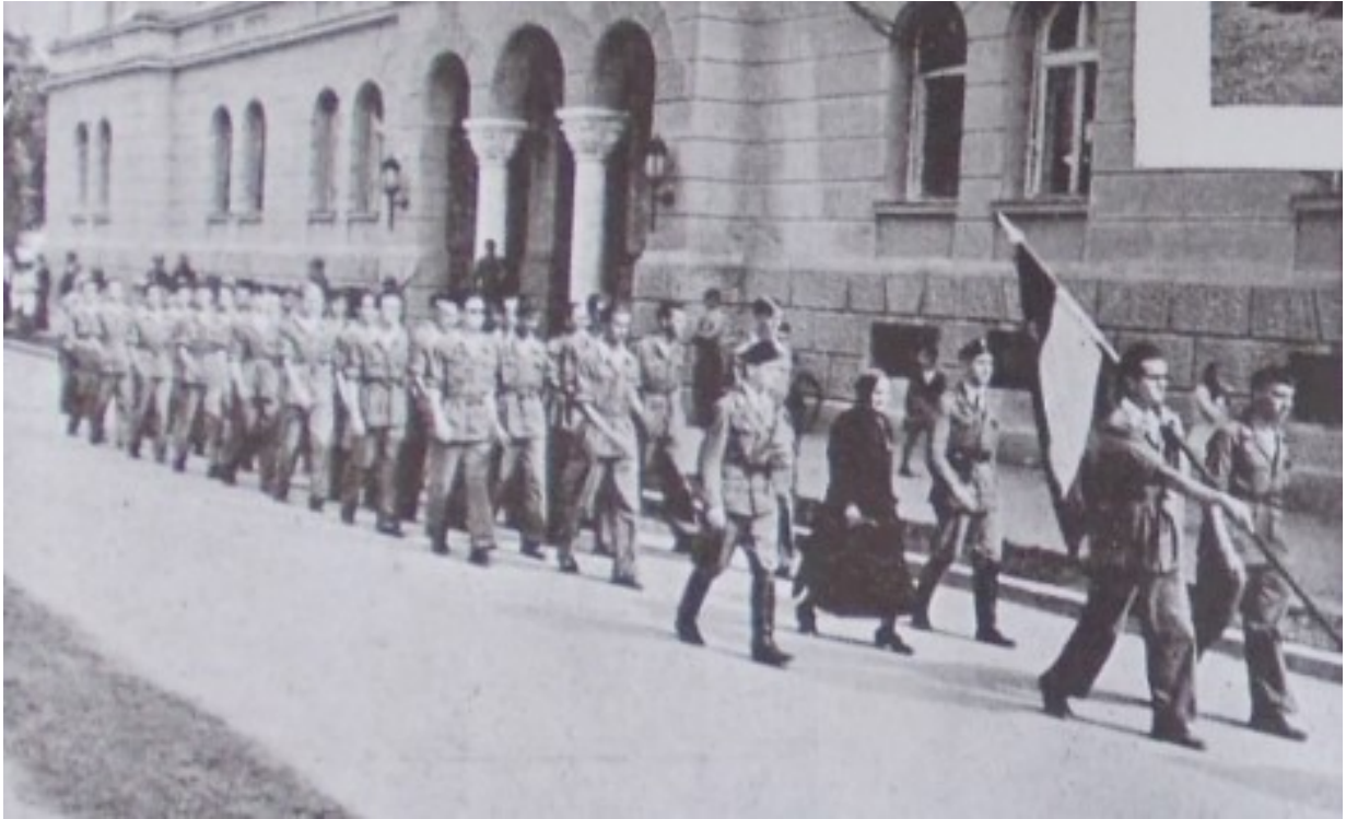
Slika 9. „USTAŠKA MLADEŽ – mladež rada – mladež budućnosti – na djelu.“, Ustaša: Vjesnik hrvatskog ustaškog oslobodilačkog pokreta br. 5, Naslovnica