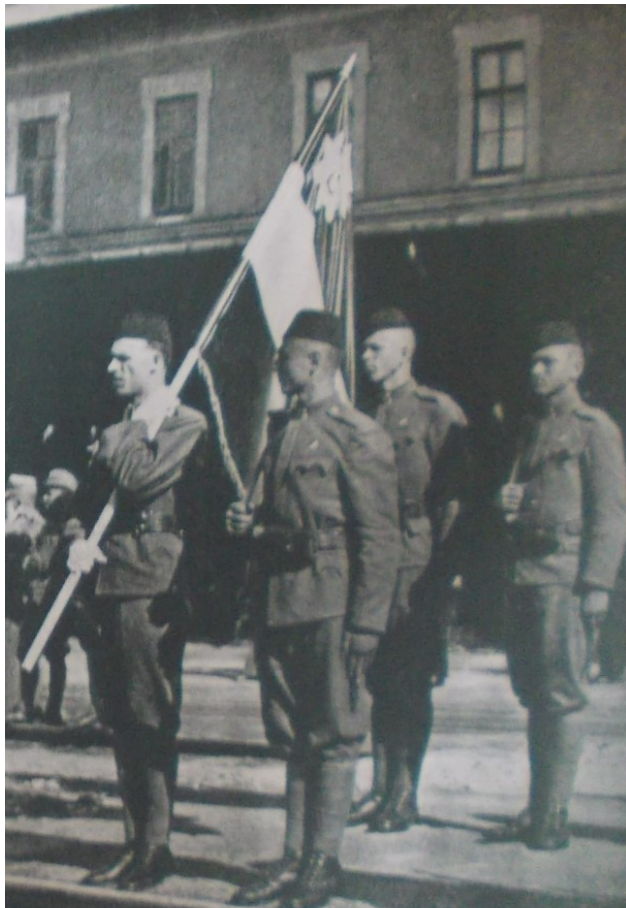
Slika 2. „Hrvatski dobrovoljci, koji će ponovno pronijeti slavu hrvatskog oružja“, Ustaška mladež: omladinski prilog „Ustaše“ , 10. kolovoza 1941., 31.

Većina fotografija u izvorima prikazuje ustaše upravo u odorama. Time se predodžbe ustaškog muškarca izravno vizualno vežu uz vojnu službu. Na fotografijama ustaše redovito ne gledaju u leću fotoaparata, već negdje u daljinu. Prikazani su uglavnom vitki muškarci slične visine, među kojima nije moguće uočiti vidljive fizičke razlike. Redovito su u istim odorama, naglašavajući kolektiv odreda. Sve fotografije prikazuju mlade vojnike, dok su prikazi vojnih lica starije životne dobi redovito rezervirani samo za prepoznatljiva lica ondašnjice, poput Pavelića ili Kvaternika, i prošlosti, poput prikaza mitoloških junaka ustaške borbe. Fotografije koje prikazuju Pavelića vrlo