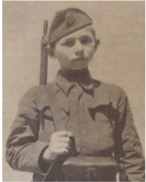
Slika 4. „Mali ustaša“, Ustaška mladež: omladinski prilog „Ustaše“ , 31. Kolovoza 1941., 16.