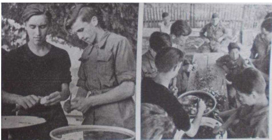
Slika 12. „USTAŠKA MLADEŽ – mladež rada – mladež budućnosti – na djelu.“, Ustaška mladež: omladinski prilog „Ustaše“ , 3. kolovoza 1941., 17.

Vizualni prikazi rada također naglašavaju kolektiv. U skladu sa ustaškom retorikom stalnog, neprestanog i neiscrпивog rada koji predstavlja stvaralački potencijal novog režima, fotografije radnika većinom prikazuju sretne, ispunjene i predane radnike. Zamjetan je nedostatak samostalnih radnika, odnosno, kroz propagandni materijal rijetko će se naići na prikaze uredskih radnika, birokrata, profesora, pisaca ili nadzornika, pa čak i samostalnih majstora fizičkih radnji. Čak i prikazi odmora od rada prikazuju suradnju u pripremi jela, suradnju u jelu i odmoru. Prikazi seljaka također naglašavaju sklad i kolektiv u radu. Izuzetak u prikazu rada kao kolektivne djelatnosti je, očekivano, Poglavnik (slika 14).