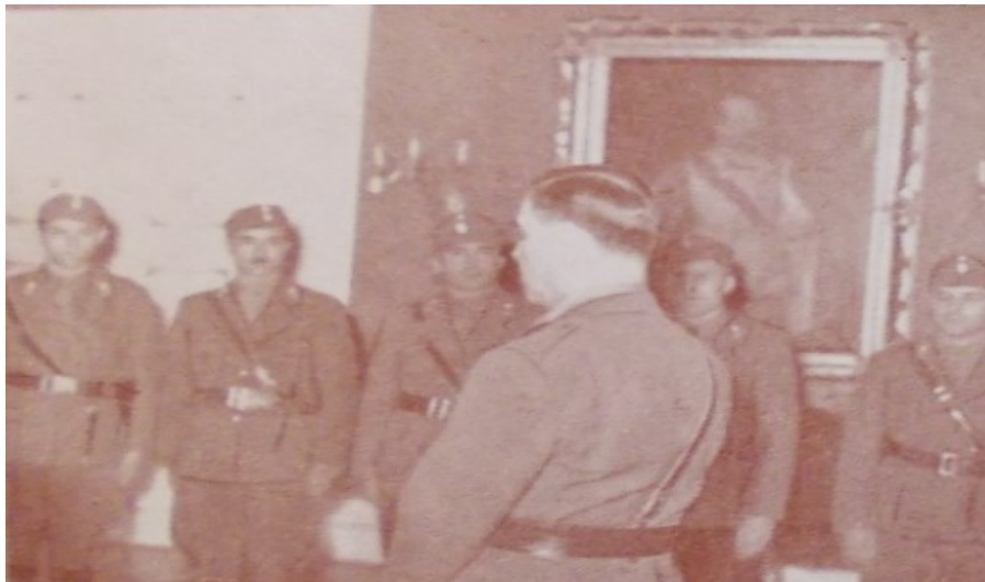
Slika 3. „Za vrijeme povjesnog poglavnikovog govora novim ustaškim stožernicima“, Ustaška mladež: omladinski prilog „Ustaše“ , 28. rujna 1941., 18.

Foto-portreti pojedinih ustaških vojnika bili su prostor očitog rasnog veličanja. Tako fotografije većinom prikazuju one ustaške dužnosnike koji svojim estetskim izgledom zadovoljavaju ondašnje standarde ljepote, poput simetrije lica. Na gotovo svim fotografijama ističe se uzdignuta glava te bistar i odlučan pogled mladića u daljinu. Nužni rekviziti uključivali su ustašku kapicu i, očekivano, pušku. Ovakva Heimat fotografija učestala je u ustaškim propagandnim materijalima te odgovara nacističkim i nizozemskim völkisch nacionalističkim vizualnim prikazima kojima se ističe unutrašnjost pojedinca posredstvom čistoće njegove vanjštine i kolektivnost fašističkog pokreta nasuprot suvremenoj individualnosti. 187