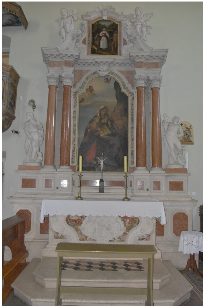
Slika 17 Neznani altarist, oltar sv. Ane, 1771..., franjevačka crkva Pohođenja Marijina, Pazin

Prema legendi, odbila je raditi u vrijeme odmora u subotu te u znak protesta ispustila srp koji je ostao lebdjeti u zraku. Stoga se prikazuje sa srpom koji drži u ruci ili lebdi u zraku. Kao ostali atributi uz sveticu se javljaju posuda s mlijekom i kruh u pregači. Najčešće scene iz svetičine hagiografije prepričane u umjetnosti su čudo o srpju ili dijeljenje kruha siromasima. 297