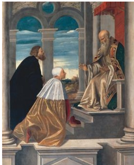
Slika 9 Giovanni da Brescia, Dužd Pietro Orseolo kleči pred sv. Romualdom , 1526., 22,8 x 28,4 cm, tempera na dasci, Museo Civico Correr, Venecija (izvorno dio dekorativne opreme orgulja u crkvi San Michele, Murano)

Rođen 928. godine u Veneciji, a umro 987. godine u Cuxi (južna Francuska), Pietro Orseolo poznat je kao venecijanski dužd i svetac. U dobi od dvadeset godina postaje admiral venecijanske flote, a 976. godine dužd za vrijeme političkih kriza koje je uspješno premostio. Dužnost je vršio dvije godine nakon čega odlazi iz Venecije i zareduje se u benediktinskom samostanu u Cuxi, privučen propovijedima sv. Romualda (Sl. 9). Obnašao je službu samostanskog sakristana, sve do poodmaklih godina koje provodi u isposništvu. 168 Prvi znaci