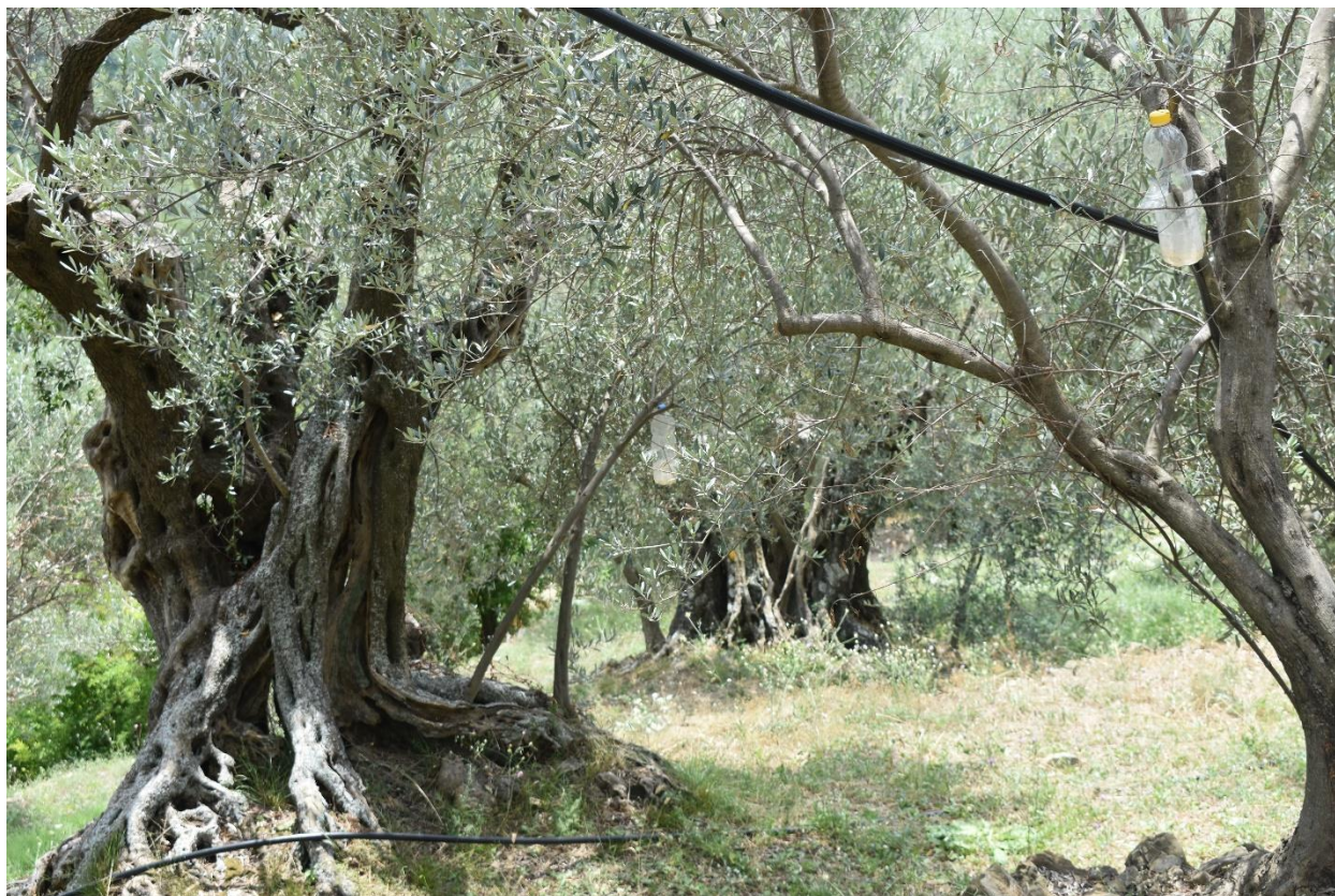
Slika 7. Zaštita masline na tradicijski način. Plastične boce ispunjene mješavinom brašna, octa i šećera protiv maslinove muhe (fotografirala R. Geci, srpanj, 2018. godine)

Jedna od brojnih agrotehničkih mjera koja se provodi je zaštita maslina od nametnika. Danas se ova briga vodi na individualni način, odnosno svaki maslinar odlučuje kako i koliko će primijeniti agrotehničke mjere za zaštitu maslina. Za razliku od tog pristupa, od 80-ih godina do 2004. godine, kako objašnjavaju stručnjaci u Odjelu za poljoprivredu u Općini Ulcinj, bilo je organizirano prskanje svih plantaža avionom. Zbog čuvanja okoliša, danas su ova prskanja protiv štetočina i mikroorganizama zabranjena. Glavni razlog za zabranu je samoproglšenje Crne Gore ekološkom državom 1991. godine. 17