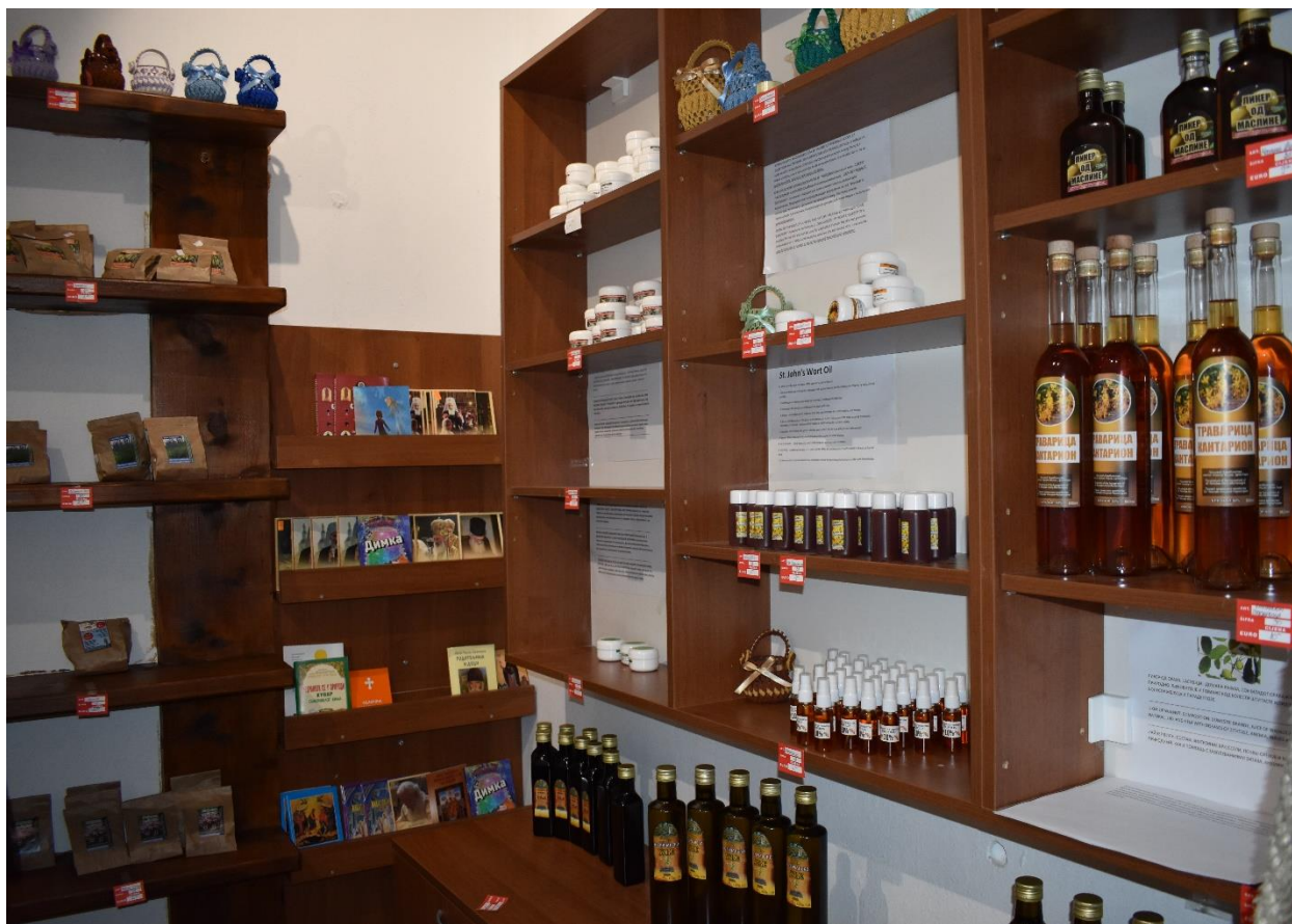
Slika 9. Suvenirnica Pravoslavne crkve svetog Nikole u Ulcinju (kolovoz, 2018. godine).

Zahvaljujući turistima, ali i brojnim iseljenicima iz Ulcinja, ulcinjsko maslinovo ulje je stiglo i do nekih udaljenih svjetskih zemalja, kako pokazuje i sljedeći citat: