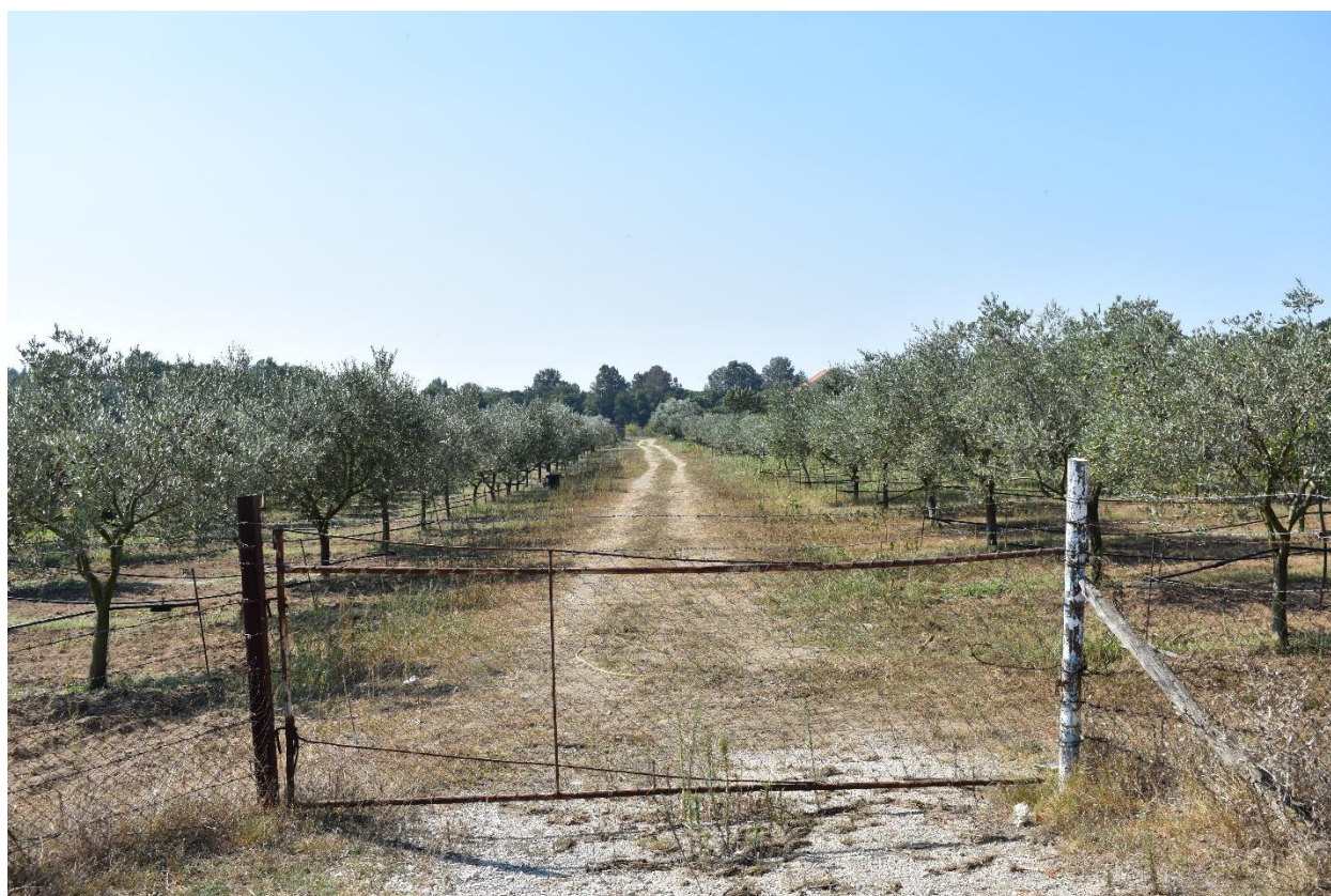
Slika 11. Novopodignuta plantaža maslina u selu Štoj (fotografirala R. Geci, rujan, 2018. godine).

Uglavnom su ove sorte dobro prilagođene na cijelom teritoriju Ulcinja pa se na njih može naići posvuda. Ujedno, velika većina novog zasada rezultat je državnog subvencioniranja.