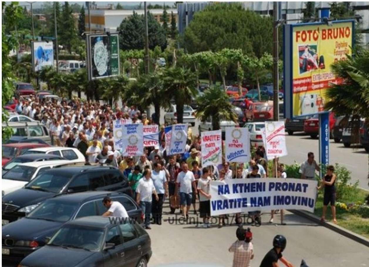
Slika 17. Protest za povrat imovine u Valdanosu 2011. godine

Kao rezultat brojnih reakcija i javnog pritiska, ali i neuspjeha sklapanja ugovora između kompanije Cubus Lux i Vlade Crne Gore, natječaj za zakup je poništen pa se stoga ni planovi za pretvaranje Valdanosa u turistički kompleks još nisu realizirali. Iz perspektive građana Ulcinja, sreća je što je još jedno opće dobro preživjelo i nije palo u ruke tzv. "tajkuna". Inače Ulcinjani podržavaju inicijative da se plaža i maslinik u Valdanosu pretvore u turističku destinaciju, ali na način da bude otvorena i dostupna svima, da se napravi šetalište gdje bi i mještani i turisti mogli uživati u prirodi i vidjeti maslinik kao element kulturne baštine Ulcinja. Isto tako, oni misle da tim kompleksom treba upravljati lokalna vlast, a ne da se događa, kao što je već slučaj u nekim drugim dijelovima grada, da velike turističke kompanije ne dopuštaju građanima ni šetnju unutar gradskih prostora.