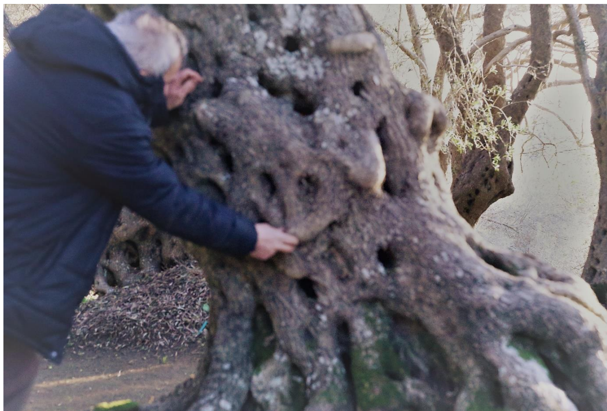
Slika 21. Maslinar iz Ulcinja objašnjava stari ritual zahvaljivanja masline i molitve za rodnost (prosinac, 2017. godine)

obitelji i radnicima. Kako sam doznala od kazivača, ovaj obred se obavljao do 70-ih, najkasnije 80-ih godina prošlog stoljeća.