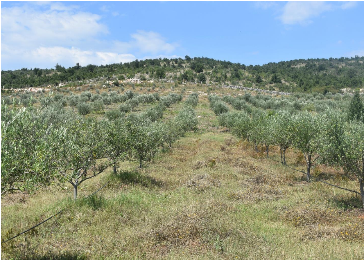
Slika 12. Novopodignuta plantaža maslina u selu Darza (fotografirala R. Geci, kolovoz, 2018. godine)

Uz državna ulaganja, bitnu ulogu u razvoju i unapređenju maslinarstva imaju i udruženja maslinara. U gradu Ulcinju ima nekoliko takvih udruženja koja nisu u istoj mjeri aktivna, a zadnjih godina počela su se formirati i u selima koja spadaju pod općinu Ulcinj. Prva udruženja maslinara osnivana su nakon 2000. godine a njihov veći porast je zabilježen nakon 2010. godine. Djelovanje udruženja uglavnom je usmjereno prema informiranju o maslinarstvu i pomoći u postupku zahtjeva subvencija. No, ona udruženja koja su aktivnija, kao npr. udruženje maslinara Valdanos u Ulcinju, isto se bave edukacijom, organiziranjem odlazaka na sajmove, međunarodnom suradnjom i sl.