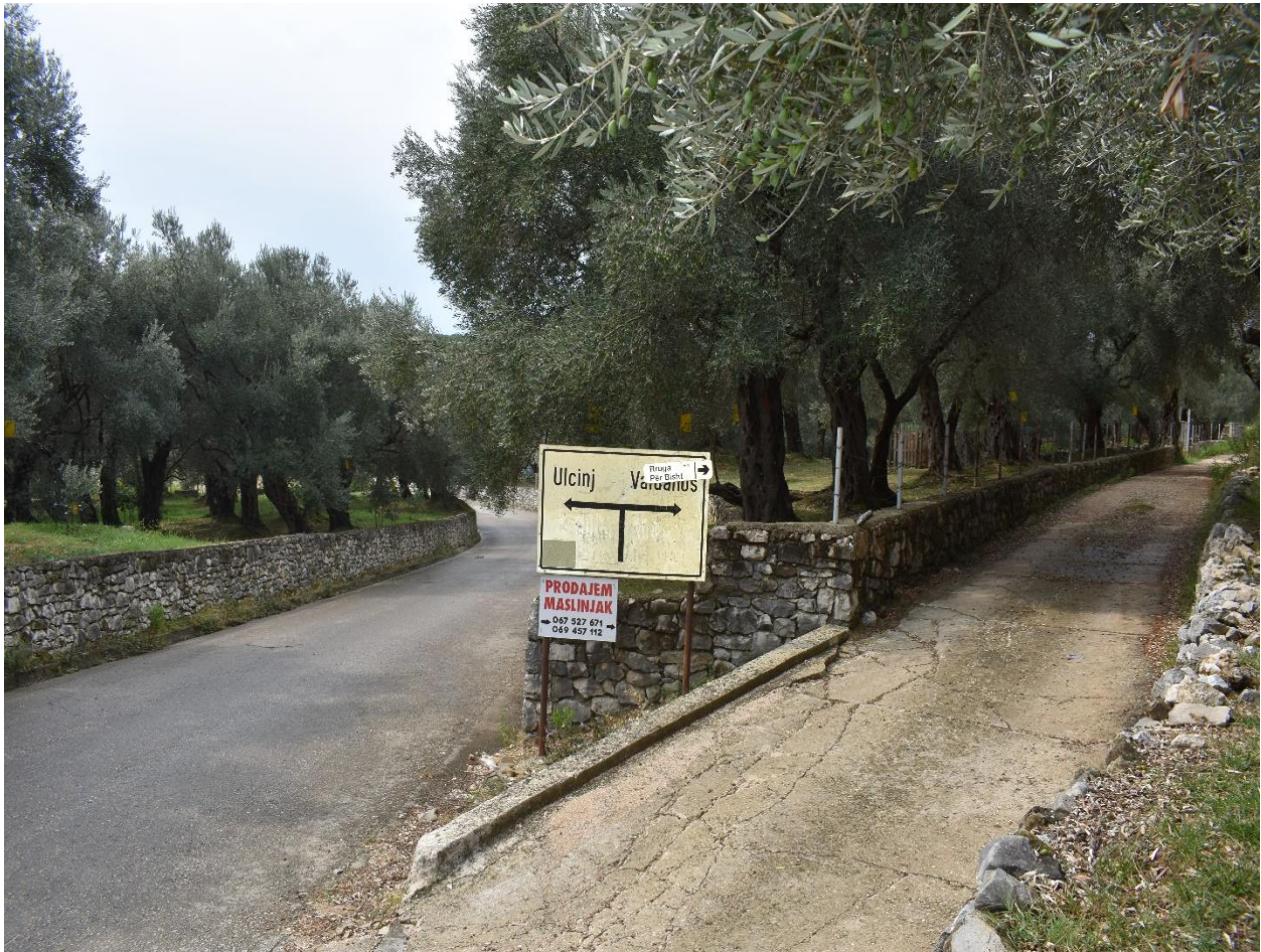
Slika 13. Maslinici na putu do Valdanosa (rujan, 2018. godine)

Prethodno sam prikazala kako je maslinarstvo u prošlosti bilo organizirano unutar proširene obitelji, pri čemu je nekoliko braće zajedno radilo i vodilo ekonomiju. Ova praksa nastavlja se i danas, ali češća je podjela imovine u manje ili nuklearne obitelji, što također utječe na organizaciju maslinarstva. Tako se pri intervjuima opisuju razni problemi i konflikti oko podjele imovine, što je u nekim slučajevima vodilo k napuštanju maslinika, tj. njihovom iznajmljivanju ili prodaji.