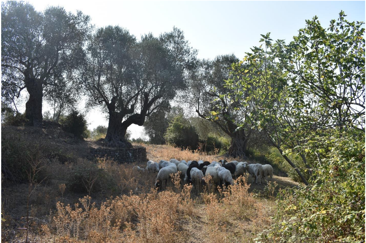
Slika 6. Stare masline, orezane prema novim preporukama u selu Kolomza (kolovoz, 2018. godine)

Za praćenje stručnih savjeta i novih trendova u maslinarstvu pokazuje se važnom i količina korijena maslina koje netko posjeduje te koliko profesionalno se maslinar bavi maslinama, npr. ima li tvrtku ili proizvodi samo za potrebe obitelji.