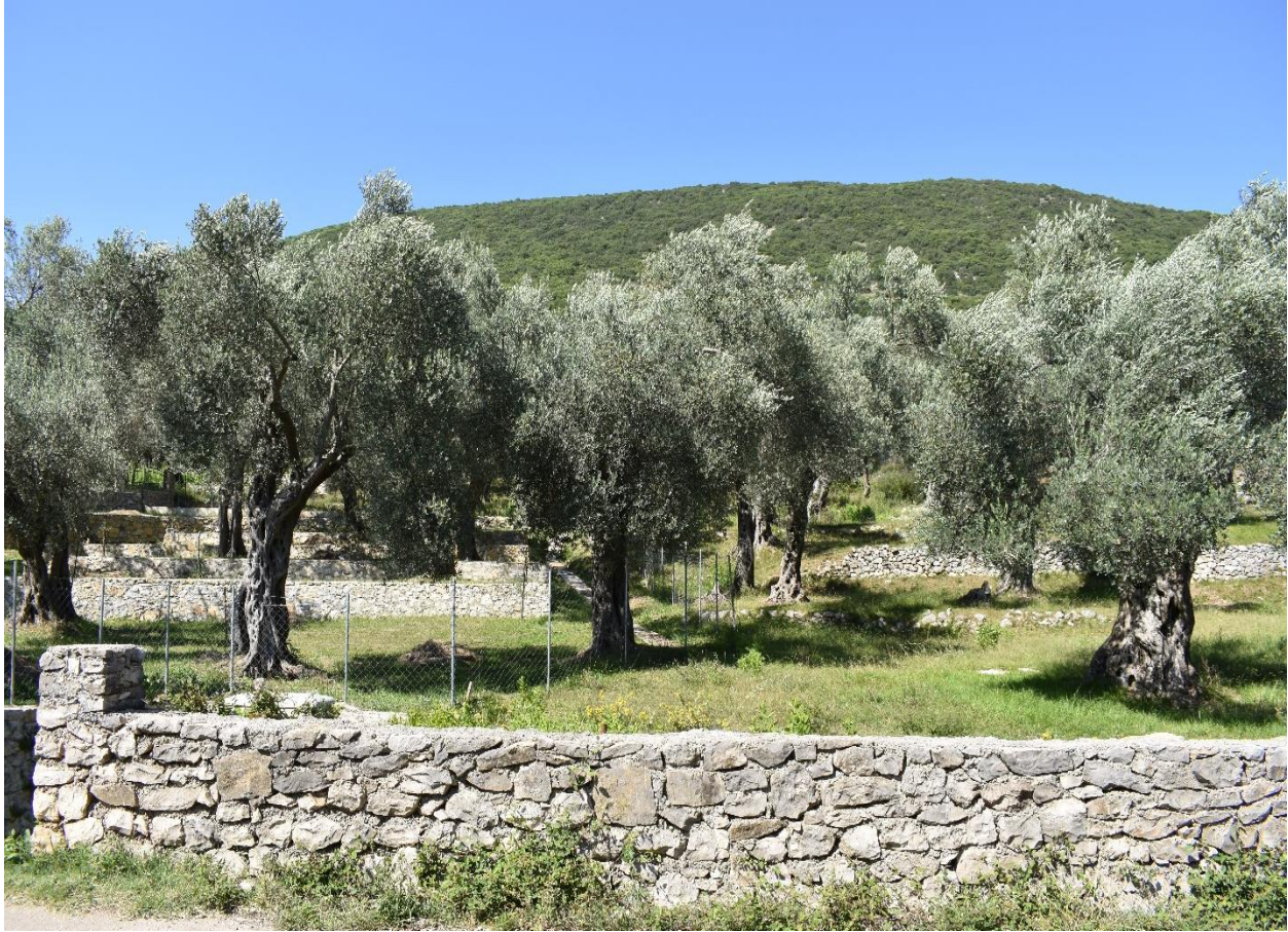
Slika 14. Stari maslinik u Ulcinju (fotografirala R. Geci, rujan, 2018. godine)

Nadalje, pitanje maslinika kao imovine danas čini javno i političko pitanje u Ulcinju. Riječ je o kolektivnom zahtjevu za povrat imovina ekspropiriranih 1978. godine, u tadašnjoj socijalističkoj Jugoslaviji. Po zahtjevu Vojnog pravobranilaštva u Titogradu 20 , kao predlagачu eksproprijacije, Odjeljenje za imovinsko-pravne poslove u Skupštini Općine Ulcinj, na osnovi Zakona o eksproprijaciji 21 i Zakona o opštem upravnom postupku 22 , 17. siječnja 1978. donijelo je rješenje o eksproprijaciji imovina u Valdanosu.