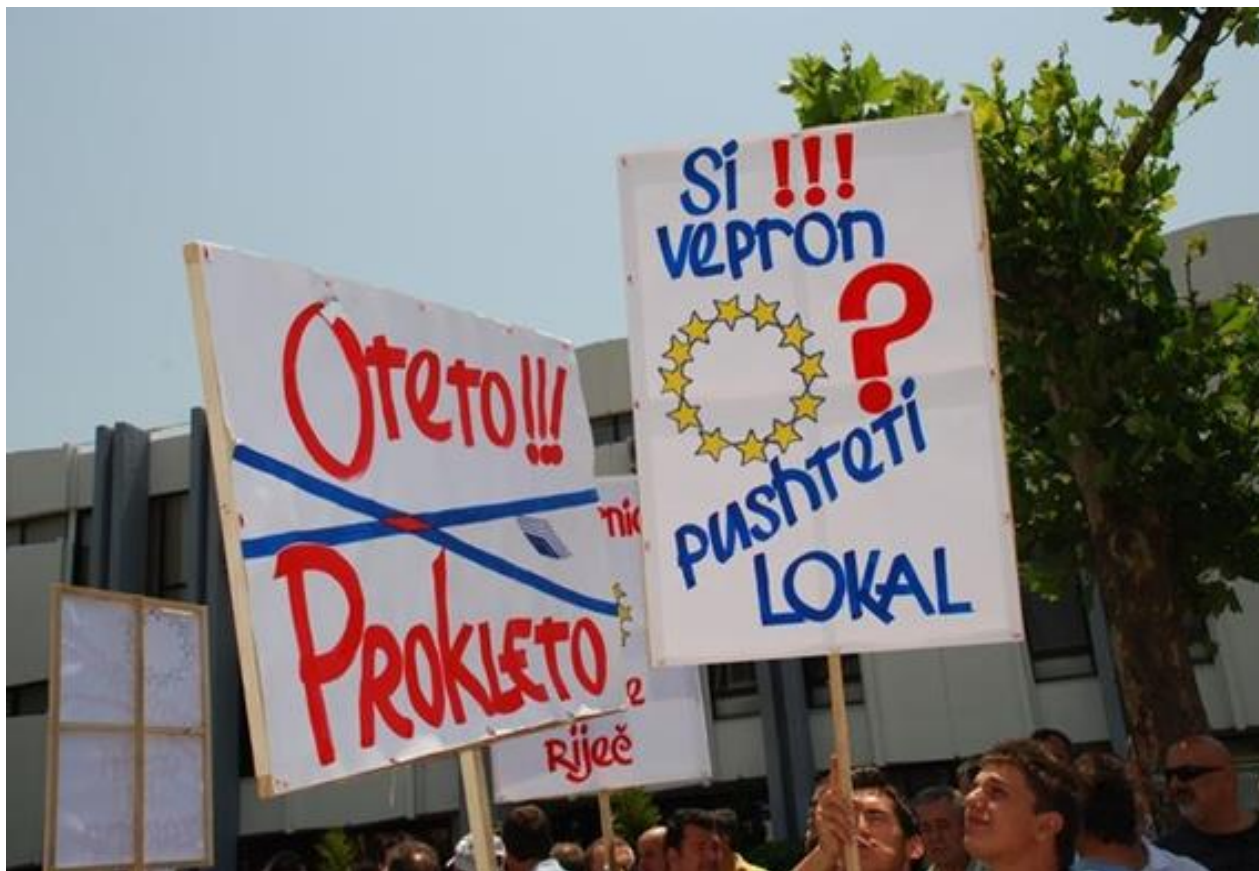
Slika 20. Protest za povrat imovina u Valdanosu 2009. godine

Ovakva situacija u kojoj građani nemaju povjerenja u državne institucije, a godinama se bore za zajednička dobra i protiv nepravde, stvorila je takve stavove i prakse pri kojima se ljudi brinu isključivo za individualnu dobrobit. Pritom mislim na manjak interesa za pitanja vezana uz zajedničke probleme, bilo one ekonomske, političke, ekološke i sl. Ona pobuđuju sve manje interesa kod građana Ulcinja jer oni ne vjeruju da mogu imati utjecaj. Često se čuje izraz “umorni smo od žalbi i zahtjeva”. Ovakva je i situacija sa zahtjevom za povrat imovine. Nakon nekoliko administrativnih procesa, protesta, inicijative za čišćenje maslinika i otvaranja puteva pa i za