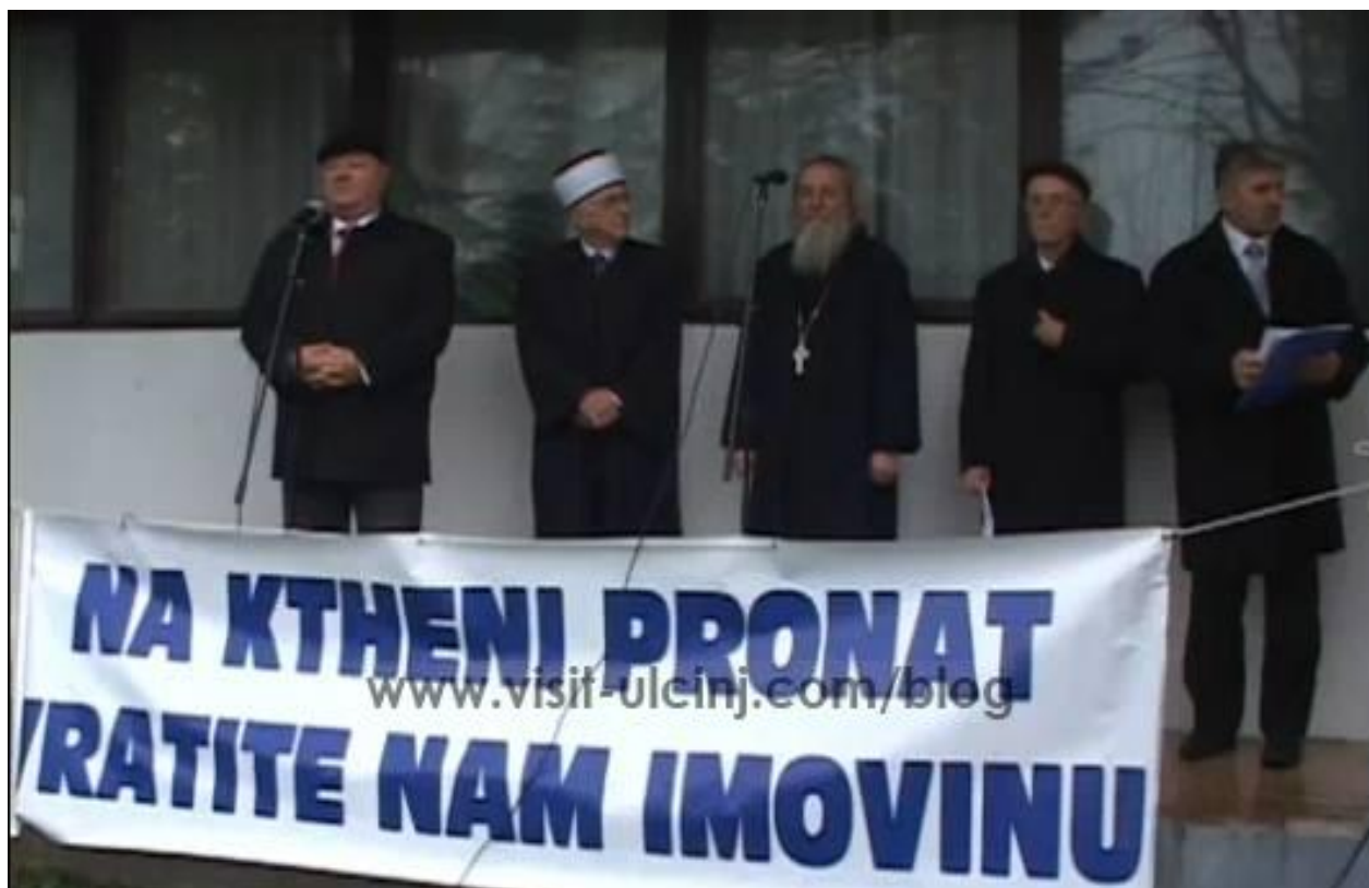
Slika 18. Protest za povrat imovine u Valdanosu 2009. godine

Iako sami Ulcinjani nazivaju sadašnje vrijeme „vrijeme demokracije“, njihovi stavovi prema državi i njezinim politikama nisu se korjenito promijenili u odnosu na socijalistički sistem. Osjećaji straha, nemoći, nesigurnosti koje su doživjeli tada nastavljaju se i danas. Jedino danas postoji veća sloboda, napominju kazivači, da se javno govori o kriminalu i nepravdi te postoji nada u ‘Europu’ ili ‘Zapad’, tj. da će u nekom trenutku njima doći vanjska zapadnjačka pomoć protiv nepravde koju oni doživljavaju u svojoj državi. S druge strane, država se promatra kao da je tuđa, drži se da ljudi na vlasti ne rade za dobrobit građana iako su njihovim glasovima izabrani, nego su sposobni raditi što god hoće i to najviše u korist svojih osobnih interesa. Tako su kazivači najčešće, dok bi govorili o državi, koristili izraze poput ‘lopova’, ‘kriminalaca’, ‘piratske države’, ‘korupcije’, ‘države kumova [za nepotizam, op. a.]’ i sl. Ove stavove pojačava i položaj manjine, s obzirom na to da Albanci čine većinu stanovnika u Ulcinju, ali manjinu u odnosu na etničke