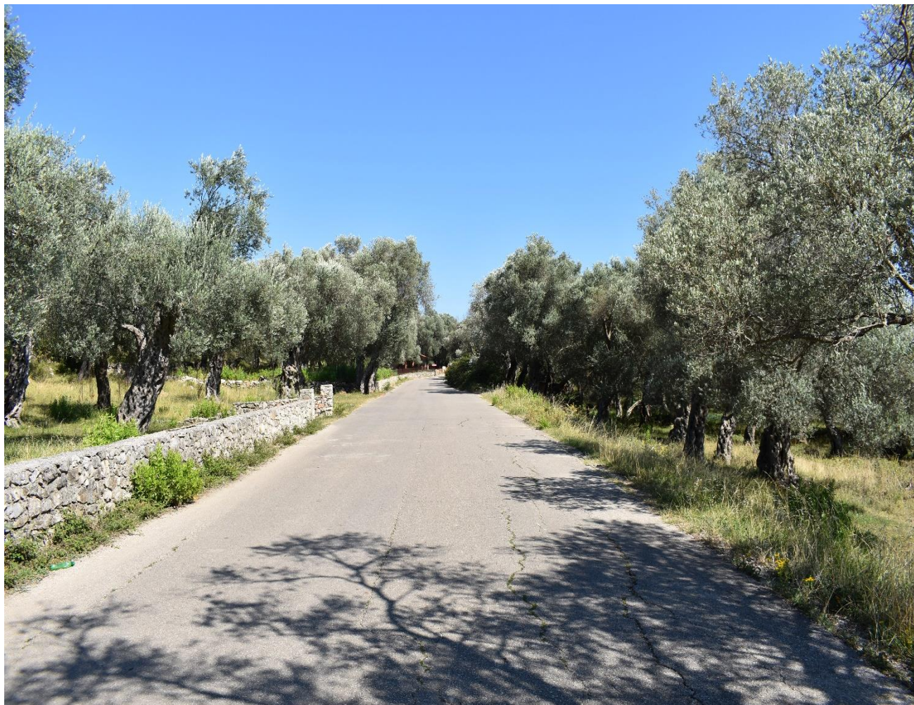
Slika 1. Stari maslinik u Ulcinju (fotografirala R. Geci, srpanj, 2018. godine)

Procjenjuje se da cijelo područje Ulcinja ima 80-86 tisuća stabala maslina starog zasada ili 300 ha i 40-50 tisuća stabala novog zasada ili 150 ha. 4