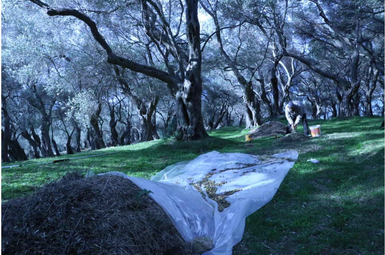
Slika 5. Radnik iz Albanije u masliniku u Valdanosu (fotografirala R. Geci, prosinac, 2017. godine)

Radnici koji dolaze iz Albanije i Kosova najčešće su muškarci koji rade i druge fizičke poslove u Ulcinju, naročito u poljoprivredi, u turizmu, građevinarstvu i sl. U posljednje se vrijeme primjećuje i rast broja žena koje dolaze iz sjeverne Albanije raditi u Ulcinju, uglavnom tijekom ljetne turističke sezone kao čistačice ili pomoćnice u tvrtkama koje se bave turizmom.