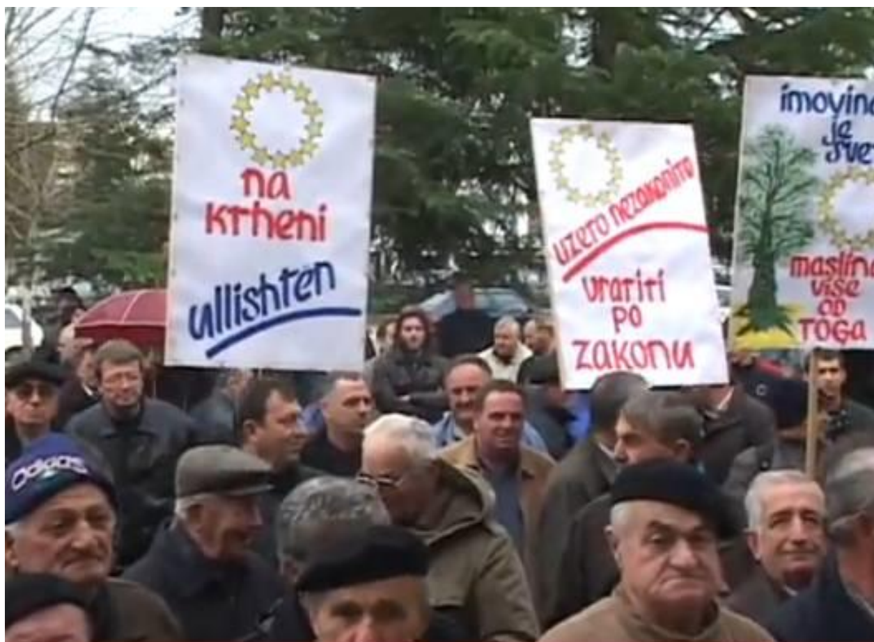
Slika 19. Protest za povrat imovine u Valdanosu 2009. godine

U tom svjetlu, od 90-ih godina do danas ključan problem predstavlja privatizacija javnih dobara i poduzeća. Lokalno stanovništvo smatra da ono nema koristi od ovakvih privatizacija, nego nasuprot, njihov je ishod povećanje broja nezaposlenih, zbog čega mladi većinom migriraju jer su, kako kažu, primorani na taj čin. Neki to smatraju i “tihim etničkim čišćenjem”.