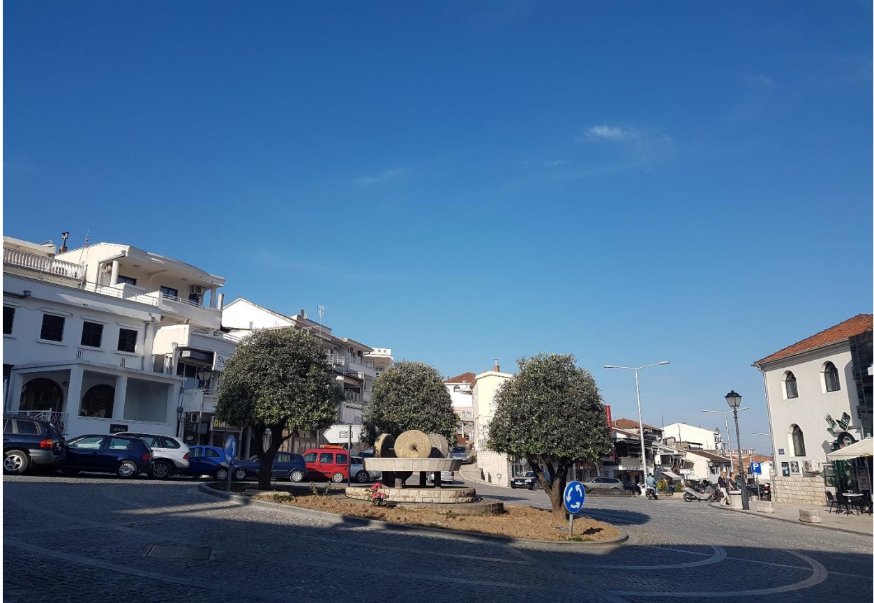
Slika 3. Centar Ulcinja, maslina i kameni mlin kao simboli grada (fotografirala R.Geci, srpanj, 2018. godine)

Zaintrigirana istraživanjem jedne tradicionalne gospodarske grane u sklopu volontiranja u Muzeju grada Ulcinja tijekom ljeta 2017. godine, odlučila sam detaljnije istražiti maslinarstvo u Ulcinju. Glavni sam fokus pritom stavila na maslinarstvo u sadašnjosti u kojem su, prema mojem iskustvu s terena, glavni akteri osobe iznad 40 godina, a nerijetko i stariji stanovnici te umirovljenici. Većinom su to ljudi koji su počeli raditi u masliniku od djetinjstva i aktivni su još danas.