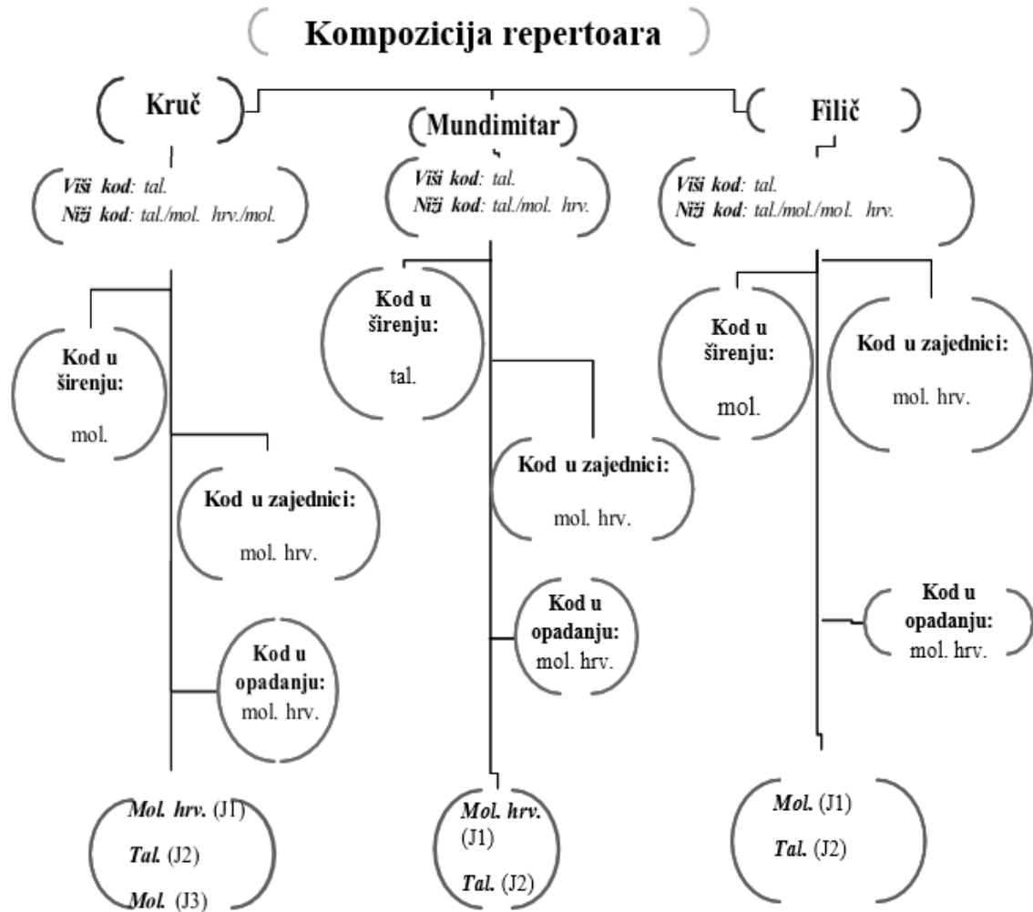
Slika 2. Kompozicija jezičnoga repertoara u trima moliškohrvatskim mjestima (Bada 2009: 12, autoričin prijevod).

talijanskomu dijalektu u Filiču). Prema tome se u Filiču bilježi triglosija sa sanfelicianom , talijanskim i moliškohrvatskim (slika 2).