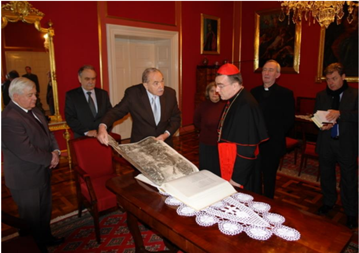
Slika 18. Dr. Lojze Gostiša predaje izdanje Iconothece Valvasoriane kardinalu Josipu Bozaniću

primjerak Iconothece Valvasoriane od rujna 2015. godine kada je zaprimljena donacija iz Ureda predsjednice Republike Hrvatske, a faksimil se čuva u Grafičkoj zbirci. 134