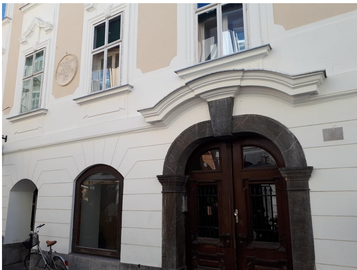
Slika 2. Valvasorova rodna kuća u Ljubljani

Valvasor je rođen u kranjskoj plemićkoj obitelji kao dvanaesto od sedamnaestero djece (Slika 2). Roditelji su mu bili Jernej Valvasor i Ana Marija rođ. Rauber. Školovao se u isusovačkoj gimnaziji u Ljubljani, učeći društvene znanosti, retoriku, latinski i logiku. Po završetku gimnazije, ne odlučuje se odmah nastaviti obrazovanje, nego putuje po inozemstvu, a zatim odabire vojni poziv. Valvasorova prva putovanja započinju već 1658. i traju do 1662. godine, ali o njima nema sigurnih podataka. Tijekom 1663. i 1664. godine sudjeluje u protuturskim ratovima pod zapovjedništvom Nikole Šubića Zrinskog, kao jedan od dvadeset kranjskih dragovoljaca. Već 1666. godine nastavlja s putovanjima koja započinje u Beču, a posjećuje i većinu zemalja zapadne Europe – Francusku, Nizozemsku, Englesku, Dansku, Njemačku, Švicarsku, Italiju i Španjolsku. Odlazi čak i u Afriku, na područje današnjeg Tunisa i Libije. Za vrijeme boravka u Francuskoj iskoristio je vojna znanja priključivši se kraljevskoj francusko-švicarskoj pukovnici. 53 Školovanju se vraća 1670. godine i u Lyonu studira povijest, matematiku, arheologiju, magiju i alkemiju. 54