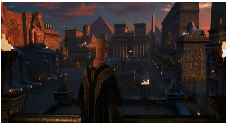
Slika 7. Isječak iz filma Mumija 2 , s prikazom drevnog Egipta

Baštinu možemo pronaći i u drugim filmskim žanrovima, preko povijesnih do akcijskih i filmova fantastike poput Mumije (Sl. 7.) ili Indiane Jonesa , koji često koriste baštinske elemente određenih kultura kako bi radnju smjestili u neki egzotičan, drugačiji prostor, prepun mitova i drevnih vjerovanja, pa do običnih romantičnih komedija koje se baziraju na prikazu druge kulture, poput filma Obiteljska čast , kroz koji se upoznaje kinesko-američka kultura. Čak i filmovi znanstvene fantastike često koriste baštinske elemente, od drevnih narodnih običaja i mitova, do arhitekture i geografskih lokacija.