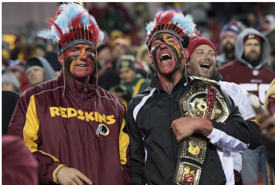
Slika 8. Fanovi Washington Redskinsa nose tradicionalne indijanske perjanice

zastarjeo naziv za Sjevernoameričke Indijance. Činjenica da ova momčad predstavlja glavni grad nacije čini ovu situaciju još gorom i razlog je zašto upravo ova kontroverzna momčad dobiva toliko medijske pažnje kada se govori o aproprijaciji baštine.