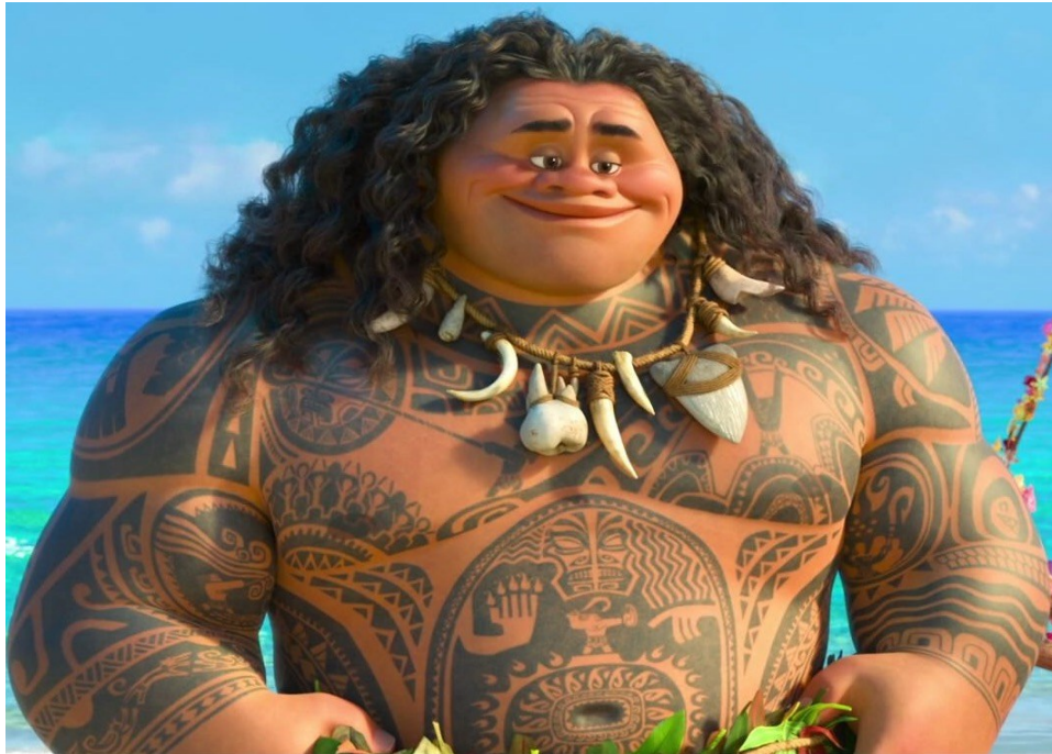
Slika 14. Disneyjev prikaz poluboga Mauia u filmu Moana

tipične Disneyjeve pjesme 41 . No najveća kontroverza koja se veže uz Moanu je Disneyjev prikaz Mauia (Sl. 14.), polinezijskog poluboga koji je iznimno bitan dio polinezijske oralne tradicije.