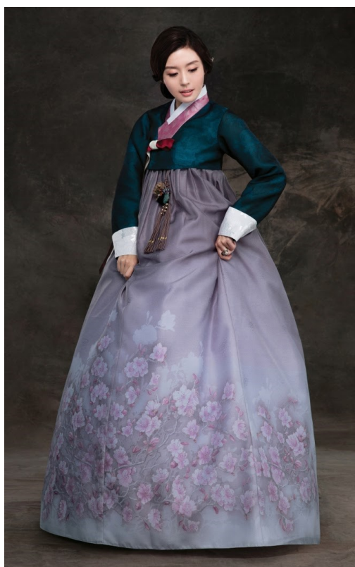
Slika 3. Tradicionalna hanbok haljina

Korejska dizajnerica Hwang Yi-seul, poznatija kao Dew Hwang, u potpunosti je rekreirala tradicionalnu korejsku haljinu naziva hanbok (Sl. 3.), a svoju modnu liniju nazvala je Leesle , prema ljudima koji su radili tradicionalne korejske haljine 13 . Na ovaj način pokazala je povijest haljine i jedan bitan dio tradicije, a ujedno je unijela dijelove haljine u svakidašnjicu, spojivši moderno i tradiciju (Sl. 4.).