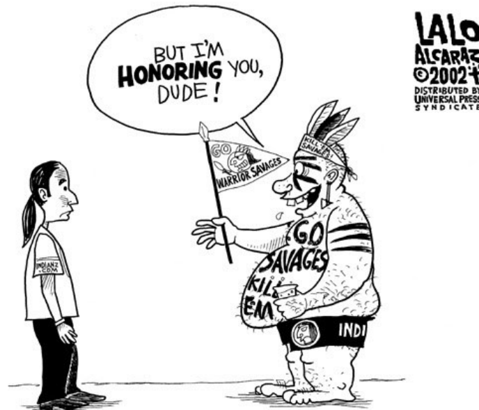
Slika 9. Karikatura Lalo Alcaraza koja prikazuje aproprijaciju baštine američkih Indijanaca

primjer aproprijacije baštine nešto nedopustivo te zahtijevaju promjena naziva. Kontroverza oko naziva kluba traje i dalje te je porasla do te razine da poznati svjetski mega-brandovi poput Nike-a i FedEx-a povlače svoje proizvode sa imenom Redskinsa i prijete raskidom sponzorstava, ako ime i dalje ostane nepromijenjeno.