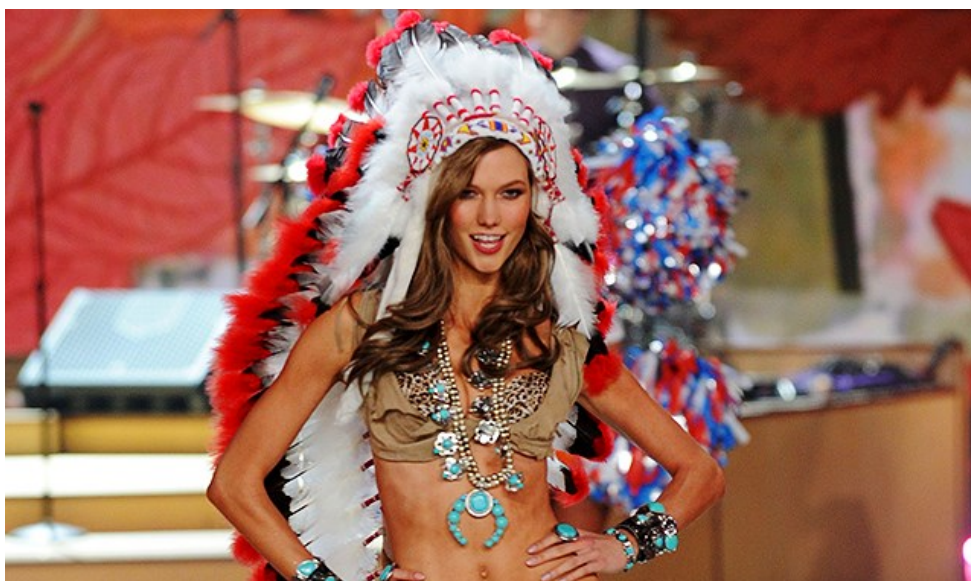
Slika 12. Karlie Kloss sa indijanskom perjanicom, Victoria's Secret fashion show 2012.

Nakon što su prve fotografije revije izašle u javnost, pleme Navaho je odmah reagiralo, nazvavši ovakav odnos prema baštini ismijavanjem 35 . Adrienne Keene, poznata aktivistica i akademik iz plemena Cherokee, osvrnula se na ovaj događaj u članku koji je izašao u New York Timesu, rekavši da: