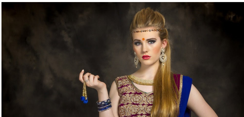
Slika 13. Primjer aproprijacije indijske kulture

koje ima iznimno spiritualno značenje za ove zajednice. Danas se bindi može vidjeti kao modni dodatak (Sl. 13.) koji se nosi na raznim glazbenim festivalima, ali je i čest modni izbor poznatih zvijezda, poput Madonne, Kylie i Kendall Jenner, te Selene Gomez. Iako je Rajan Zed, poznati hindu vođa izjavio da bindi ima značajno religijsko značenje i ne bi se trebala nositi kao modni dodatak 37 , mnoge indijske zvijezde, uključujući i glumicu Priyanku Chopra, su podržale ovaj trend, tvrdeći da se na taj način može prigriliti indijska kultura 38 .