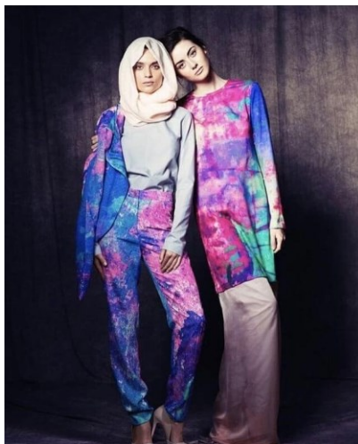
Slika 2. Barjis London Brand

Danas modni dizajneri često koriste neke od navedenih tradicijskih elemenata u svojim kreacijama, izražavajući na taj način ponos na svoju baštinu i povijesti. Barjis Chohan, porijeklom iz Pakistana, jedna je od poznatih dizajnera koji koriste tradicijske elemente svoje domovine i kulture. Kroz modernizaciju dizajna, njene kreacije istovremeno slave njenju i baštinu njene domovine, ali i stvaraju novi stil, blizak vremenu u kojem se nalazimo 11 .