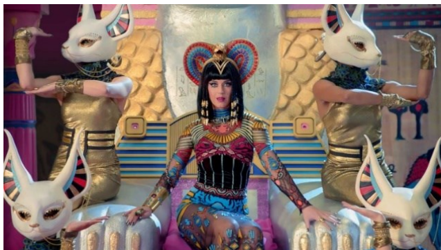
Slika 16. Katy Perry u video spotu za pjesmu Dark Horse

Jedan od najistaknutijih primjera svakako je poznata australska reperica, Iggy Azalea. Stihovi njenih pjesama često su opisani kao “rasno bezosjećajni”, kao i njene objave na društvenoj platformi Twitter, a njen stil repanja osudili su mnogi poznati reperi poput Snoop Dogga i Q-Tipa 44 . Činjenica je da Azalea nema nikakve poveznice sa rap i hip-hop glazbom, dva žanra čiji se temelji nalaze u životima afroamerikanaca i njihovim životnim situacijama i borbama, i kao pripadnica bijele rase, Azalea danas ima nešto što se zove bijela privilegija ili “white privilege”. S obzirom da je gotovo cijela njena diskografija bazirana na apropijaciji baštine, postavlja se pitanje treba li ona nastaviti stvarati glazbu? Naravno, to je pitanje na koje društvo ne može dati odgovor, s obzirom da će svaki glazbenik uvijek imati barem nekolicinu obožavatelja kojima ovakve kontroverze neće biti bitne. Odgovor na to pitanje, dakle, varira od osobe do osobe.