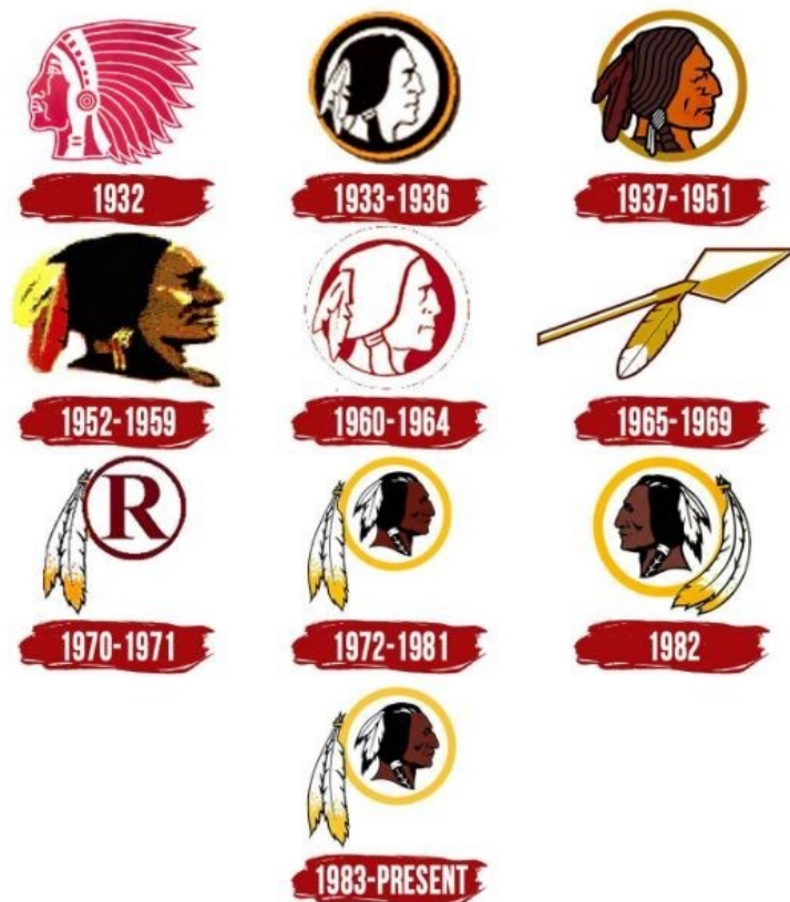
Slika 1. Washington Redskins - povijest logotipa

U američkom nogometu i bejzbolu primjeri također sežu puno dalje od boje i uzorka dresova. Logotipovi ili grbovi timova često su od iznimnog značaja za baštinu, kako kluba tako i obožavatelja, poput grba bejzbol klubova Cleveland Indians i Washington Redskins (Sl.1).