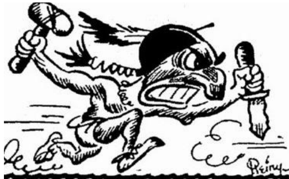
Slika 11. Isječak Reinertova stripa; karikatura Malog Indijanca

Ta karikatura, kao i mnoge druge slične njoj, tipičan su primjer stereotipnog prikaza američkih Indijanaca u stripovima i crtanim filmovima. Iako logo Indijansa nije imao nikakve veze sa Reinertovom karikaturom, jasno je vidljiv utjecaj rasnih stereotipa, posebno kada uzmemo u obzir da je logo kluba nastao petnaest godina nakon nastanka karikature.