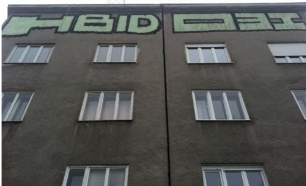
Slika 7 Nepoznat autor, "HBID 031", graffiti u roller tehnici, Zagreb, oko 2011.