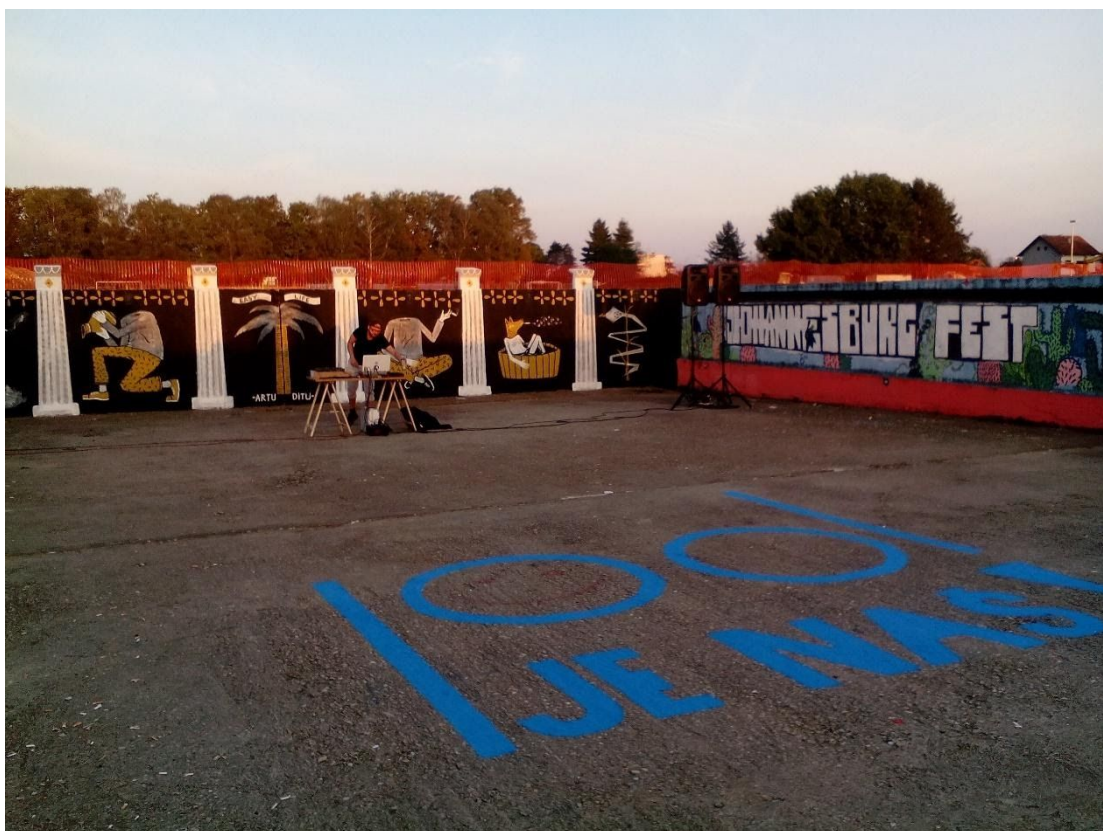
Slika 9 DJ Dr.Izzy i zidni murali kolektiva ArtuDitu u programu festivala "Konferencija.exe" USB_collective, Ivanić Grad, 2016.