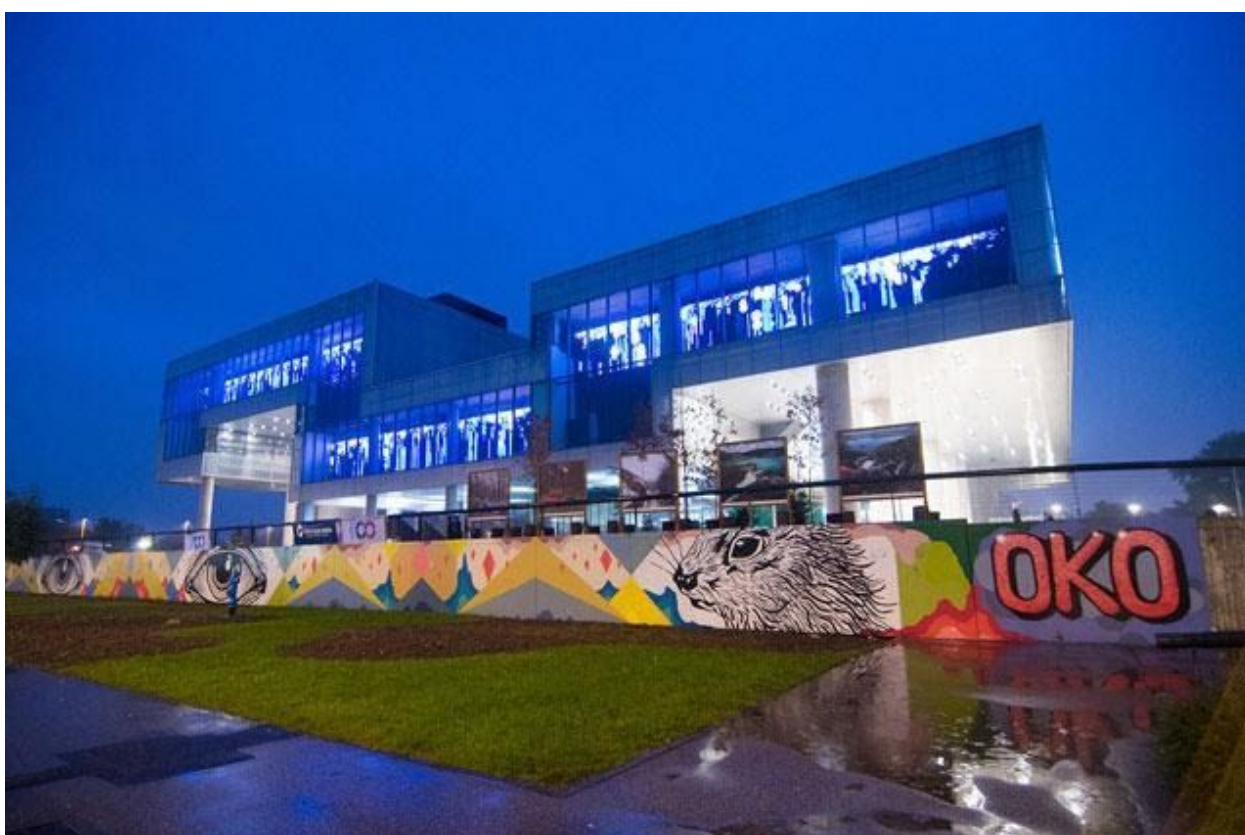
Slika 4 OKO, "Open my eyes that I may see", akril na zidu, Muzej suvremene umjetnosti u Zagrebu, Avenija Dubrovnik, 2015.