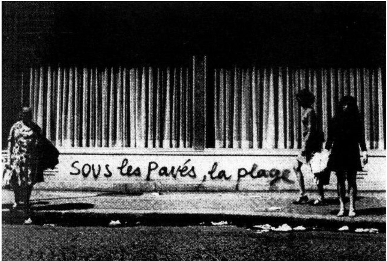
Slika 1 Nepoznat autor, Ulični natpis "sous les pavés la plage", graffiti, 1968., Pariz