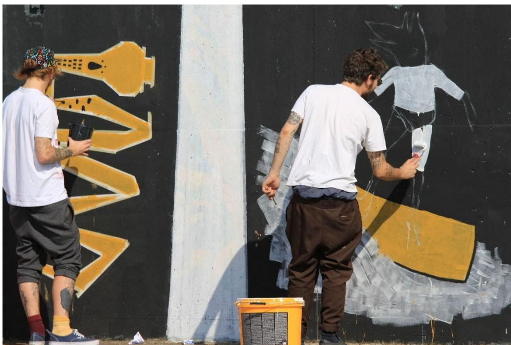
Slika 8 ArtuDitu, "Easy Life", zidni mural, Ivanić Grad, 2016.