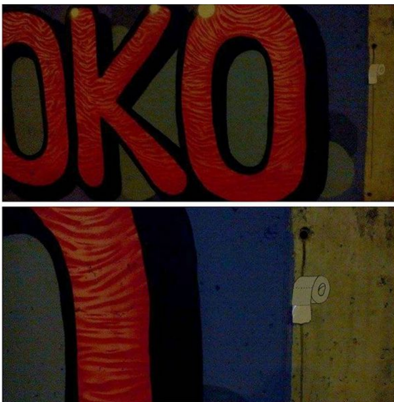
Slika 5 Odgovor na izradu murala za Muzej Suvremene Umjetnosti, USB_collective, "toilet paper", perforirana papirnata naljepnica, Muzej suvremene umjetnosti u Zagrebu, 2015.