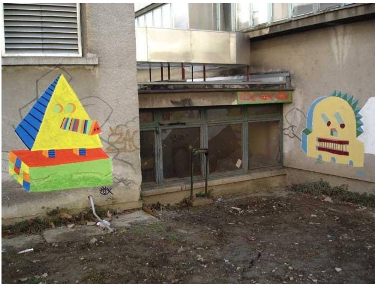
Slika 2 OKO, neimenovan rad, akril na zidu, Zagreb, oko 2008. godine