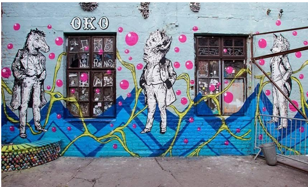
Slika 3 OKO i Chez 186 (pozadina), neimenovan rad, akril na zidu, Zagreb, Pierottijeva ulica, oko 2015. godine