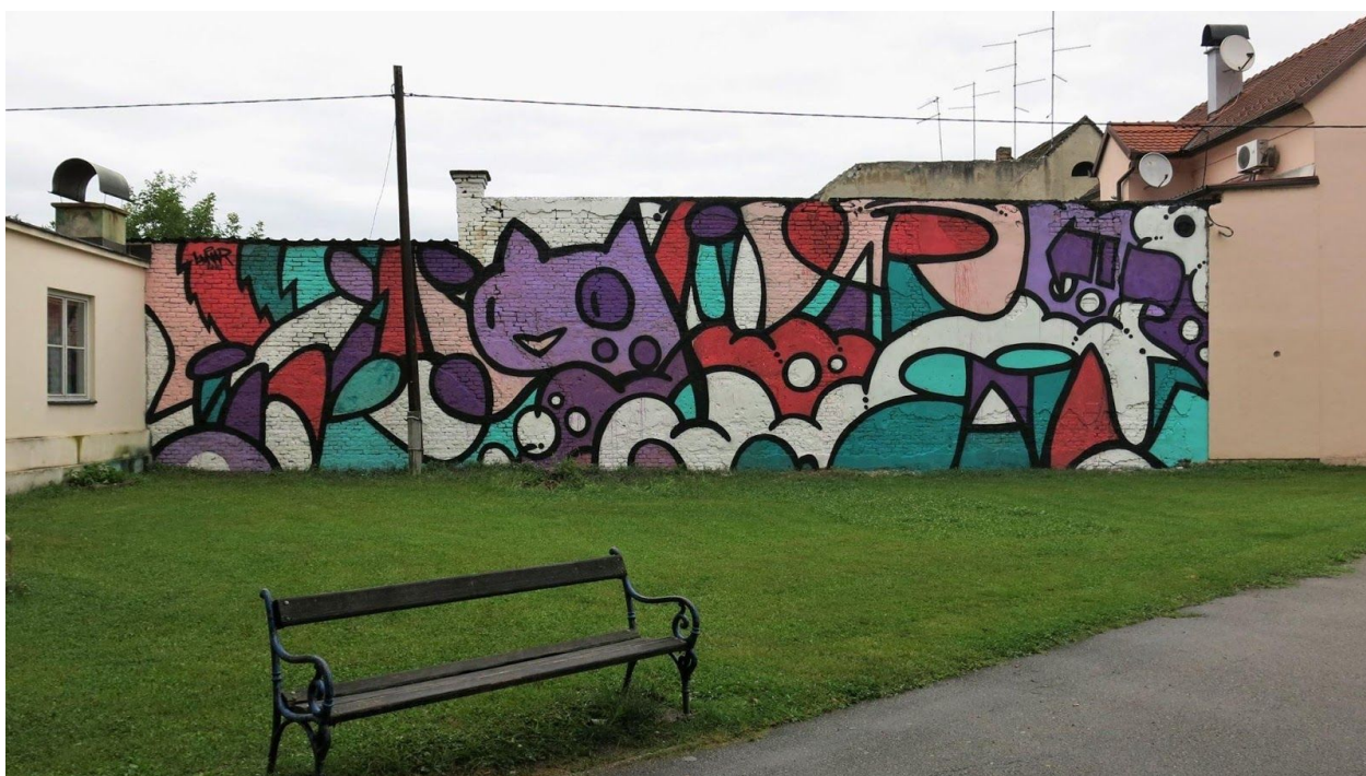
Slika 10 Slaven Lunar, bez naziva, zidni mural na festivalu Re:Think, Sisak, 2016.