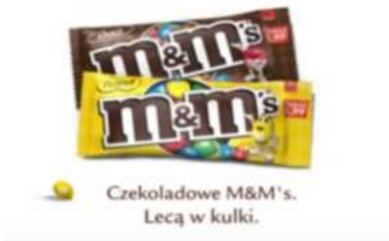
Slika 7. Reklama M&M's

kvantitativnoj inačici zbog mogućnosti izostavljanja sastavnice sobie . U ovom se slučaju, također, radi o potpunoj desemantizaciji frazema. U hrvatskom jeziku ne nalazimo ekvivalent, no mogli bismo upotrijebiti glagol šaliti se , odnosno, igrati se .