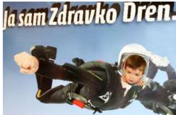
Slika 19. Reklama Belupa

poredbenog veznika (kao) te sastavnice s kojom se uspoređuje (dren / drenovina). U ovom se slučaju radi o djelomičnoj desemantizaciji i nultoj paradigmatičnosti.