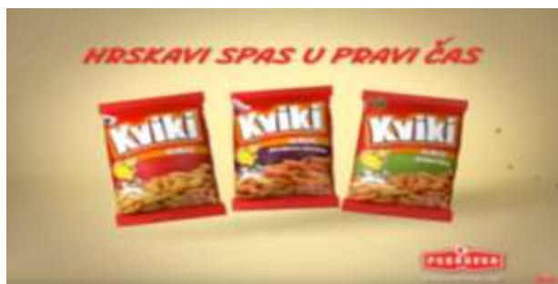
Slika 1. Reklama Podravke

Radi se o frazemu rečenici, a semantički gledano o glagolskom frazemu. Isto tako, radi se o višestrukim inačicama zbog kombiniranja različitih inačica unutar frazema.