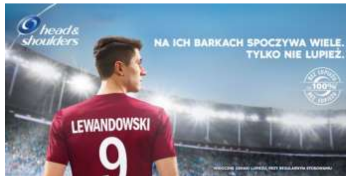
Slika 21. Reklama za Head & Shoulders

Head & shoulders dovitljivo je iskoristio frazem coś spoczywa na czyichś barkach čije značenje glasi 'biti odgovoran za što'. Ramena su povezana sa učinkovitošću šampona protiv peruti, dakle, kupci će se riješiti peruti, i neće je više vidjeti, a poveznica s nogometnim kapetanom Lewandowskim je da on nosi sav teret i sav pritisak na svojim leđima, ali ne i perut. U ovom se slučaju radi o rečeničnom frazemu nulte paradigmatičnosti.