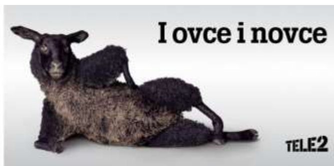
Slika 14. Reklama Tele 2

Tele 2 je dugo vremena kao svog predstavnika imao ovcu Gregora. Gregor je tijekom promidžbe ponuda Tele 2 često koristio frazeme, pa je tako u možda i najpoznatijoj reklami Tele 2 tvrdio da oni daju i ovce i novce. Izvorni oblik tog frazema glasi htjeti (željeti i sl.) i ovce i novce , a znači 'htjeti (željeti i sl.) sve bez izuzetka'. U Tele 2 su povezali činjenicu da je Gregor ovca sa svojom izjavom da daju i ovce i novce kako bi naglasili da u Tele 2 pružaju svojim korisnicima i najnižu cijenu usluga i proizvoda i kvalitetu, odnosno i ovce i novce, a tom su poveznicom zasigurno osigurali pamćenje tadašnjeg gesla Tele 2, zato što su ljudi mogli povezati sliku ovce Gregora sa geslom Tele 2. U ovom se slučaju radi o djelomičnoj desemantizaciji i nultoj paradigmatičnosti s obzirom da se frazem može koristiti samo u svom kanonskom obliku.