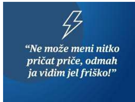
Slika 26. Reklama Lidla

Prodavaonica Lidl također voli koristiti frazeme za promoviranje različitih ponuda. Jedna od najnovijih reklama Lidla glasi Ne može meni nitko pričat priče, odmah ja vidim jel friško! . Kanonski oblik frazema glasi pričam ti priču , a značenje glasi 'nešto je besmislica, glupost, neozbiljna stvar'. U ovom slučaju radi se o glagolskom frazemu te o djelomičnoj desemantizaciji frazema. Lidl ovim frazemom naglašava činjenicu da su svi proizvodi u Lidlu svježi te da, tko god njihove kupce želi uvjeriti u suprotno, priča besmislice.