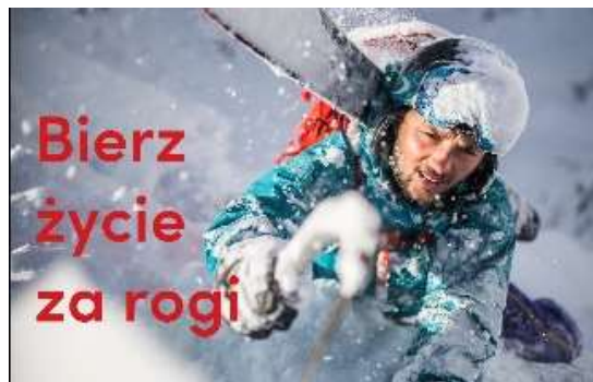
Slika 12. Reklama banke PEKAO

Poljska banka PEKAO svojim klijentima poručuje da uhvate život za rogove. Ovdje je vidljiva igra riječi, tj. promjena sastavnice u frazemu koji na poljskom glasi chwycić, wziąć, brać itp. byka za rogi , a koji u hrvatskom ima svoj potpuni ekvivalent koji glasi uhvatiti bika za rogove . Dakle, za potrebe reklame frazemska je sastavnica bik zamijenjena imenicom život . Značenje frazema u oba jezika glasi 'postupiti odlučno, energično, brzo, odnosno, ne ustuknuti pred poteškoćom ili pred opasnošću'. Ovom reklamom banka želi klijentima poručiti da se mijenja u skladu s ambicioznim ljudima, da je spremna realizirati planove svojih klijenata i biti njihovom inspiracijom. Kod ovog frazema možemo govoriti o leksičkoj inačici zbog mnogobrojnih mogućnosti u odabiru glagola kao jedne od sastavnica u frazemu.