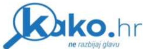
Slika 29. Reklama portala kako.hr

Portal kako.hr poručuje svojim čitateljima da si ne razbijaju glavu. Frazem koji su upotrijebili u svojoj reklami u kanonskom obliku glasi razbijati (lupati i sl.) <sebi (si)> glavu . Značenje tog frazema glasi 'mučiti sebe mislima, dugo razmišljati, mučno tražiti probleme'. Ovaj je frazem rečeničnog oblika, a radi se o višestrukoj inačici s obzirom na razne mogućnosti promjena unutar frazema. Postoji mogućnost leksičkih te leksičko – kvantitativnih promjena.