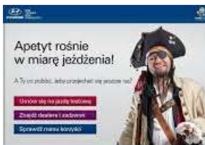
Slika 27. Reklama za Hyundai

Tvrtka Hyundai iskoristila je frazem apetyt rośnie w miarę jedzenia za reklamu svojih automobila u Poljskoj. Ovdje je vidljiva promjena sastavnice – umjesto jedzenie (hrv. jelo ) upotrijebljena je riječ jeżdzenie (hrv. vožnja ). Na taj je način dobivena još jedna poveznica s kvalitetom Hyundai automobila koja je postignuta i prenesenim značenjem frazema, a to je da što se više vozi Hyundai automobil, to će više rasti apetit za ponovnom vožnjom. Značenje frazema je, dakle, da što više osoba ima, to još više želi i kada jednom krene, više ne može stati. U ovom se slučaju radi o rečeničnom frazemu. Paradigmatičnost i desemantizacija su nulte.