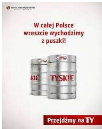
Slika 10. Reklama pivovare Tyskie

Nakon popuštanja protuepidemijskih mjera na ulicama poljskih gradova pojavila se reklama pivovare Tyskie koja glasi W całej Polsce wreszcie wychodzimy z puszki! Naglasak je ovdje na frazemskoj sastavnici puszka koja u poljskom ima dva značenja. Prvo značenje riječi je limenka , a drugo zatvor . Ovdje vidimo poveznicu limenki piva Tyskie s osjećajem koji su mnogi Poljaci imali tijekom karantene - zatvoreni u svojim domovima osjećali su se kao u zatvoru. Čim je došlo do popuštanja mjera, Poljaci su izašli iz svojih domova i osjetili veliko olakšanje.