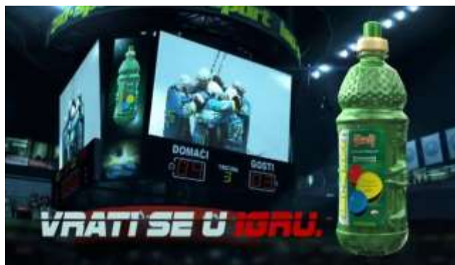
Slika 5. Reklama Vindije za Iso Sport

Iso sport je još jedan od Vindijinih popularnih proizvoda koji za promidžbene svrhe koristi frazeme kako bi se postigla višeznačnost reklame. Iso sport pića namijenjena su ne samo profesionalnim sportašima, nego i rekreativcima i svim osobama koje se bave tjelesnim aktivnostima. Za navedenu reklamu upotrijebljen je frazem ući / ulaziti u igru , a do frazeološkog obrata dolazi promjenom glagola ući u glagol vratiti se . Riječ igra ovdje ima više značenja. Prvo je doslovno koje aludira na sport i sportske aktivnosti, a drugo je značenje frazema koje znači 'sudjelovati u čemu, biti uključen u čije poslove (kombinacije i sl.)'. Vindija je na maštovit način povezala namjenu izotoničnih pića i poruku da ne bismo trebali odustati, nego se vratiti i ponovno sudjelovati u određenoj aktivnosti i sl. U ovom glagolskom frazemu radi se o morfološkoj inačici zbog promjene u glagolskom vremenu ( ući / ulaziti ).