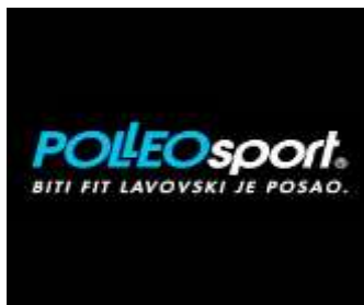
Slika 23. Reklama Polleo Sporta

Maskota trgovine Polleo sport je lav. Sukladno tome njihov slogan glasi Biti fit lavovski je posao . Ovdje je upotrijebljen frazem [ odraditi ] lavovski posao čije značenje glasi 'odraditi najveći dio nekog posla'. Time je povezana maskota trgovine sa njihovom porukom da bismo se svi trebali baviti tjelesnom aktivnošću, čime bismo odradili veliki dio posla u našim nastojanjima da budemo zdravi. U sloganu je upotrijebljen frazem u kanonskom obliku. Ovdje se radi o djelomičnoj desemantizaciji zato što je samo dio sastavnica izgubio svoje prvotno leksičko značenje. Pridjev fit u sportskome žargonu znači 'koji je u dobroj formi, sposoban za napore', pa ovdje možemo uočiti nastanak novog frazema biti fit . Možemo zaključiti da se u ovoj reklami radi o kombinaciji dvaju frazema.