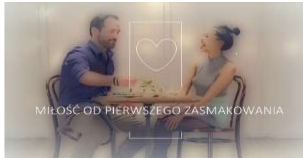
Slika 8. Reklama Knorra

Kod Knorrovog slogana vidljiva je izmjena sastavnica u frazemu. Kako bi naglasili važnost okusa, u frazemu od pierwszego spojrzenia ( wejrzenia ) sastavnicu spojrzenie (hrv. pogled ) zamijenili su sa riječju zasmakowanie (hrv. okus ). Značenje ovog frazema glasi 'odmah, smjesta'. U hrvatskom jeziku također postoji takav frazem, a to je frazem na prvi pogled koji dijeli zajedničko značenje s poljskim frazedom. Nadalje, ovdje bi se radilo o potpunim ekvivalentima da u sloganu nije promijenjena sastavnica spojrzenie , odnosno pogled . U ovom se slučaju radi i o nultoj desemantizaciji.