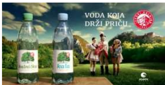
Slika 4. Reklama Kale