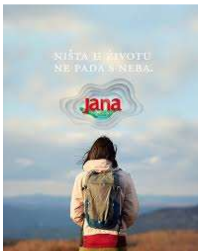
Slika 6. Reklama Jane

Još jedna poznata hrvatska voda za svoju reklamu iskoristila je frazeologiju kako bi postigla više „slojeva“ reklame. U Jani tvrde da „ništa u životu ne pada s neba“. Što zapravo time žele poručiti, znat ćemo samo ako prepoznamo frazem ne pada (nije palo) s neba <komu> što, čije značenje glasi 'dobiti / dobivati (postići / postizati) što uz teškoće (uz veliki napor)'. Poruka Jane, dakle, glasi da ulažu velike napore kako bismo mogli piti njihovu vodu te da ništa u tom procesu nije jednostavno kako se možda naizgled čini. Isto tako, svoje su napore povezali sa događajima u životu. Dakle, poručuju svojim potrošačima da se za uspjeh poput njihovog ipak trebaju potruditi. Kada govorimo o frazemu ne pada (nije palo) s neba <komu> što, govorimo o kombiniranom variranju s obzirom da se glagol padati može mijenjati po vremenima te se može izostaviti sastavnica <komu> bez da se promijeni značenje frazema. Ovdje se također radi i o potpunoj desemantizaciji frazema.