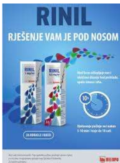
Slika 18. Reklama Rinila

Iz Rinila nam nude svoje proizvode kao rješenje koje nam se nalazi pod nosom. U reklami je upotrijebljen frazem pod (pred) nosom [biti, nalaziti se i sl.] ili ispred nosa [biti, nalaziti se i sl.] čije značenje glasi 'u neposrednoj blizini, jako blizu [biti, nalaziti se i sl.]'. S obzirom da se radi o sprejevima za nos, ovdje je ponovno vidljiva poveznica između stvarne namjene proizvoda i frazema u reklami. U ovom se slučaju radi o svezi riječi glagolskog tipa te o nultoj desemantizaciji.