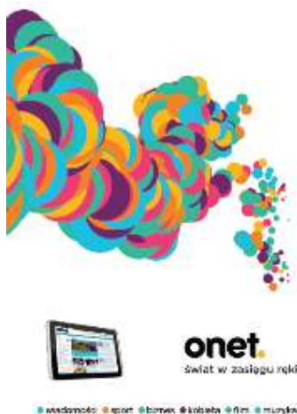
Slika 30. Reklama za onet.pl

pristupačne i da sve mogu pronaći na istom mjestu. Ovdje se radi o nultoj paradigmatičnosti glagolskog tipa frazemske sveze riječi.