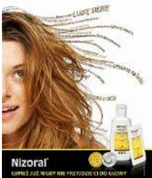
Slika 20. Reklama za Nizoral

Nizoral šamponi za kosu poznati su po pomoći u rješavanju peruti. U njihovoj je reklami ponovno vidljiva dovitljiva uporaba frazema coś przyszło komuś do głowy . U poljskom nalazimo i inačice tog frazema koje glase coś przyszło komuś na myśl te coś wpadło komuś do głowy . I u hrvatskome nalazimo ekvivalent za ovaj frazem, a on glasi pasti komu na pamet . Poljska reklama za Nizoral doslovno prevedena na hrvatski glasi: Prhut ti više nikada neće doći na glavu. Doslovno je značenje, dakle, povezano s učinkovitošću šampona, tj. ono aludira na uspješnost u rješavanju prhuti. Preneseno značenje frazema glasi 'sjetiti se', a također aludira na uspješne rezultate. Perut nam neće više pasti na pamet zato što je više nećemo imati. S obzirom da postoje inačice ovog frazema, možemo zaključiti da se radi o djelomičnoj paradigmaticnosti te da su moguće leksičke promjene unutar frazema.