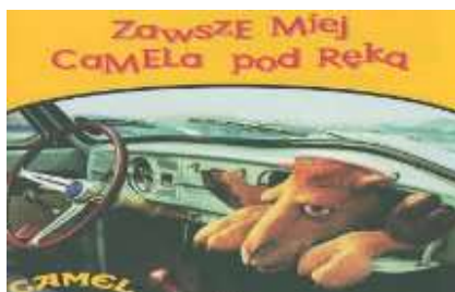
Slika 28. Reklama za Camel

Marka cigareta Camel u svom je sloganu upotrijebila frazem być pod ręką koji znači 'biti blizu, pristupačan'. Njegov ekvivalent u hrvatskom je biti (naći se) pri ruci koji ima isto značenje. Ovim frazedom iz Camela poručuju da bi kupci uvijek trebali imati njihove cigarete u svojoj blizini. Frazem być pod ręką frazemska je sveza riječi glagolskog tipa. Paradigmatičnost ovog frazema je nulta.