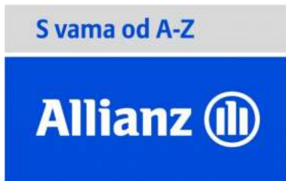
Slika 13. Reklama osiguravajućeg društva Allianz

Osiguravajuće društvo Allianz veoma je poznato ne samo u Hrvatskoj, nego i diljem Europe. U svojim reklamama, ali i na internetskoj stranici (potencijalnim) klijentima poručuje da je s njima od A – Z. Allianz je veoma domišljato iskoristio frazem od a do z koji znači 'u potpunosti, od početka do kraja [znati, nabrojiti itd.]'. Naime, umjesto z stavili su Z i tako povezali AZ mirovinske fondove sa svojim novim geslom. Dakle, A i Z imaju funkciju naglašavanja Allianzove ponude, ali i naglašavanja činjenice da su u Allianz u spremni biti sa svojim klijentima od početka do kraja. Ovdje se radi o nezavisnoj svezi riječi i potpunoj desemantizaciji frazema.