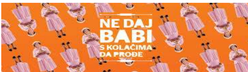
Slika 15. Reklama Iskona

Iz Iskona nam poručuju da ne damo babi s kolačima da prođe. Frazem prošla baba s kolačima iskorišten je u kanonskom obliku. Značenje tog frazema glasi 'kasno je <za što>, prošlo je čije vrijeme, sve je propalo, situacija se promijenila'. Iskon s ovom tvrdnjom povezuje i vizualni prikaz frazema, pa tako u reklami možemo vidjeti baku s kolačima. Ovom izjavom iz Iskona nam poručuju da ne propustimo prilike koje nam se nude, a pogotovo da ne propustimo one koje nam nude iz Iskona. Nadalje, radi se o potpunoj desemantizaciji te o rečeničnom frazemu u kojemu su moguće leksičke promjene sastavnica.