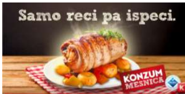
Slika 2. Reklama Konzum mesnice

Konzum mesnica za promidžbene svrhe upotrijebila je poslovicu „<Prvo> ispeci pa <onda> reci“ koja znači da treba promisliti prije nego što kažemo. Poslovicu su povezali sa svojom ponudom, tj. poslovicu su izmijenili promijenivši redoslijed frazemske sastavnice (Samo reci, pa ispeci) kako bi kupcima pokazali što imaju u ponudi, odnosno da kupci mogu doći u Konzum mesnicu i pronaći sve vrste mesa, tj. sve što im treba. Glagol ispeci ovdje ima više značenja, prvo je doslovno koje je povezano s ponudom Konzumove mesnice, dok je drugo, preneseno značenje povezano s poslovicom.