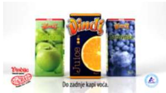
Slika 3. Reklama Vindije

zamjenske sastojke. Ovdje je ponovno jasno da se zadržala jasna veza s kanonskim oblikom frazema iako je došlo do promjene u sastavnicama. U ovoj frazeološkoj cjelini značenje je jednim dijelom motivirano leksičkim značenjem sastavnica, a krajnje značenje odraz je stvarnosti, što znači da se radi o djelomičnoj desemantizaciji frazema. Frazem do zadnje (posljednje) kapi krvi također je stilski obilježen zbog svog uzvišenog tona. Isto tako, radi se o leksičkoj inačici zbog alternacije unutar istog semantičkog polja (zadnji – posljednji) te o nultoj paradigmatičnosti.