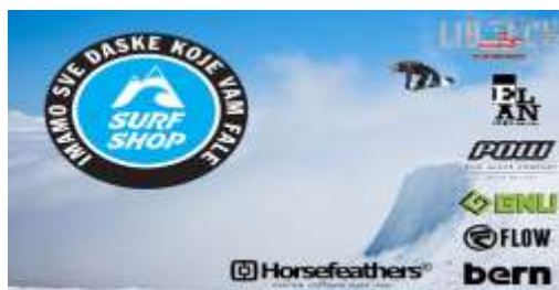
Slika 24. Reklama Surf shopa

Surfshop je trgovina specijalizirana za sportove u kojima su potrebne različite daske, bilo za snowboard, odnosno daskanje na snijegu, bilo za jedrenje na dasci (windsurfing). Svoju ponudu su povezali s frazemom fali (nedostaje) komu <jedna> daska u glavi čije značenje glasi 'nije pri zdravoj pameti, ne ponaša se normalno, čaknut (blesav, šašav) je'. No, iz Surfshopa ne poručuju nikome da je čaknut ili da nije pri zdravoj pameti, nego samo upućuju na bogatu ponudu koja kupcima omogućava da u njihovom dućanu pronađu sve što im je potrebno. U ovom se slučaju radi o rečeničnom frazemu i višestrukoj inačici s obzirom da može doći do leksičkih promjena unutar frazema kao i do leksičko – kvantitativnih.