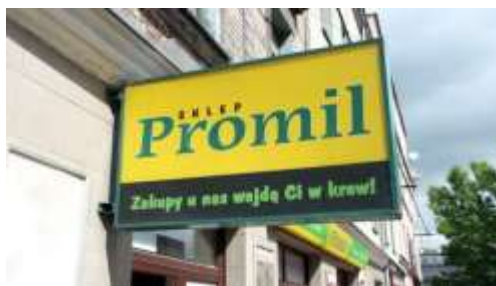
Slika 25. Reklama prodavaonice Promil

Poljska trgovina Promil poigrala se sa svojim nazivom, frazemom coś komuś weszło w krew i poveznicom između promila, alkohola i krvi. Značenje poljskog frazema glasi 'naviknuti se, steći naviku, usvojiti što kao naviku ili običaj'. U hrvatskom jeziku također postoji frazem ući u krv komu, koji ne samo da ima iste sastavnice kao poljski frazem, nego ima i isto značenje. Dakle, radi se o potpunim ekvivalentima u oba jezika. Nadalje, trgovina Promil povezala je promile alkohola u krvi i preneseno značenje frazema kako bi ukazala na isplativost kupnje u toj trgovini. U ovome se poljskom frazemu radi o rečeničnom frazemu čija je desemantizacija potpuna, a paradigmatičnost nulta s obzirom da se sastavnice ne mogu mijenjati.