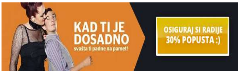
Slika 16. Reklama Iskona

Sljedeća reklama iz Iskona nosi poruku: Kad ti je dosadno, svašta ti pada na pamet. Frazem palo je (pada) na pamet (um) / komu, što znači 'prisjetiti se / prisjećati se koga, čega, pomisliti / pomišljati na koga što'. Struktura frazema izgleda na sljedeći način: glagol + prijedlog + imenica. Radi se o rečeničnom frazemu u kojem su moguće leksičke (umjesto riječi pamet možemo koristiti riječ um ) i morfološke promjene (mijenjanje glagola po vremenima). Frazem je iskorišten u kanonskom obliku, a poruka reklame je da pratimo i koristimo nove ponude koje nam nude iz Iskona, jer ako će nam biti dosadno, mogli bismo početi razmišljati o svakakvim idejama.