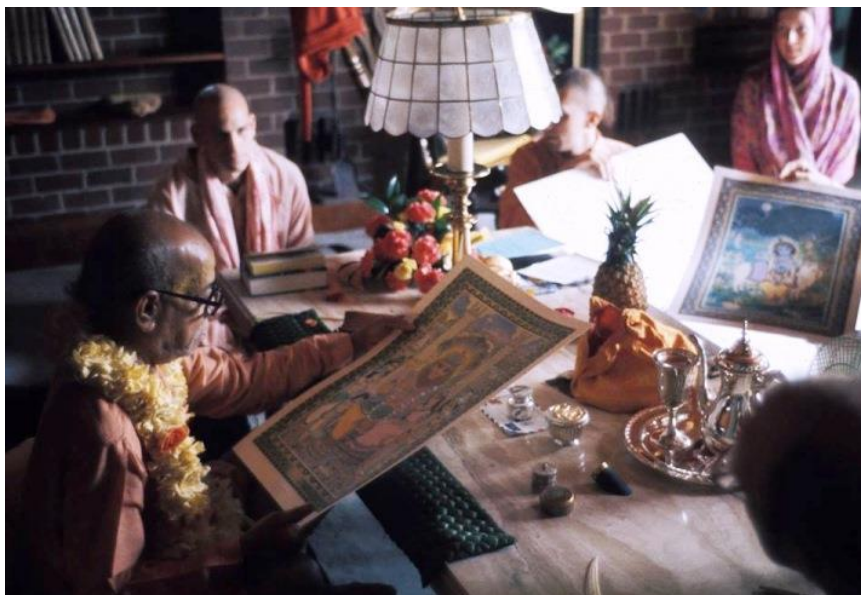
Slika 13. Kim i Chris Murray pokazuju A.C. Bhaktivedanta Swamiju Prabhupadi slike za „ Illuminations From the Bhagavad-Gita “ u sobi za primanje u Potomac hramu, 4. srpnja 1976.

U vaišnavskoj tradiciji izražavanje pobožnosti kroz umjetnost te općenito razni prikazi Boga zajedno s njegovim atributima od iznimne su važnosti. Bhaktivedanta Swami je želio prikazati osobni aspekt Boga kao Svevišnje Božanske Osobe, koja svojom transcendentnom pojavom može očarati i fascinirati gledatelja te nije sumnjao da slike koje ga prikazuju ne