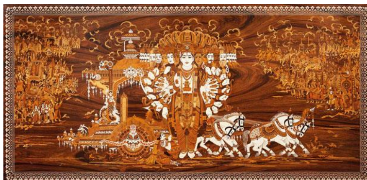
Slika 14. Vishvarupa Krishna reveals His dazzling universal form , P. Gowrajah

Vishvarupa Krishna reveals His dazzling universal form; Dashavatara, the ten divine forms of Vishnu; King Rama with Hanuman, His monkey warrior, umjetnika P. Gowrajaha. 49