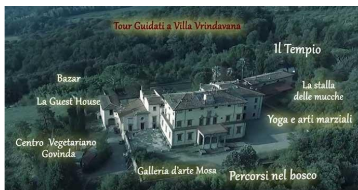
Slika 19. Villa Vrindavan, prikaz kompleksa

Mahabharate te ona ima karakter stalnog postava. Na katu se nalaze galerije koje prikazuju zabave Gospodina Rame te, nadalje, odabrane umjetničke slike ISKCON-a i prostoriju posvećenu A.C. Bhaktivedanta Swamiju Srila Prabhupadi, začetniku i osnivaču ISKCON-a. MOSA u Italiji također posjeduje i galeriju za povremene izložbe u bivšoj kapeli Ville Vrindavan. 54 MOSA također organizira i predstavlja svoje izložbe u raznim dijelovima svijeta, kao što je Nacionalna akademija umjetnosti u New Delhiju (ili Lalit Kala Academy ). 55