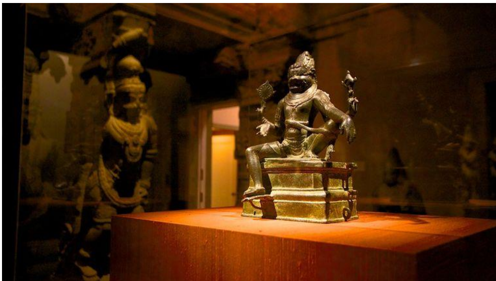
Slika 5. Philadelphia Art Museum : ponekad nam posjet muzeju može nalikovati posjetu hramu