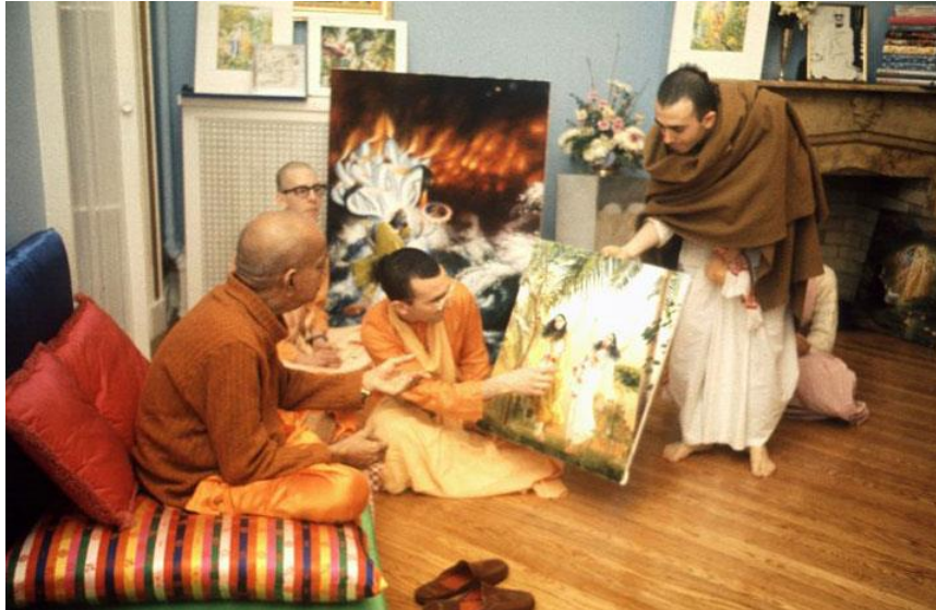
Slika 12. Bharadaj pokazuje sliku A.C. Bhaktivedanta Swamiju Prabhupadi u New Yorku, 1973. godine