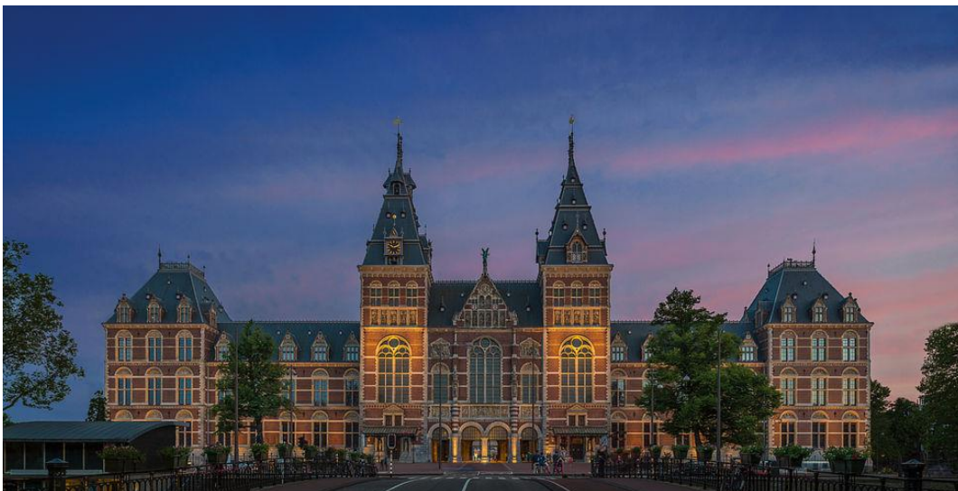
Slika 2. Rijksmuseum u Amsterdamu: svojom arhitekturom nalikuje crkvi