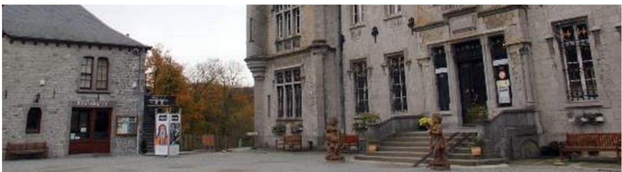
Slika 6. Museum of Sacred Art, Radhadesh

Kroz prikaz ova četiri muzeja, a koji zapravo predstavljaju četiri različite vjerske tradicije i kulture, probat ćemo otkriti koje su to zajedničke točke koje povezuju muzeje vjerskih zajednica i koje su njihove specifičnosti. Na razlike smo se već u nekoj mjeri osvrnuli kroz prethodne rečenice, no nakon cjelokupne analize donijet ćemo i sveobuhvatni osvrt.