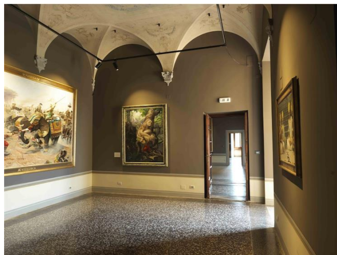
Slika 20. Izložbeni prostor MOSA-e u Villi Vrindavan 1