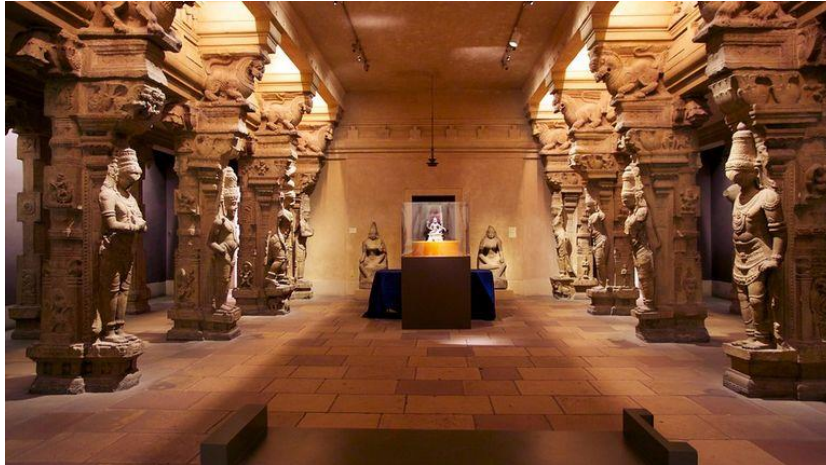
Slika 4. Philadelphia Art Museum