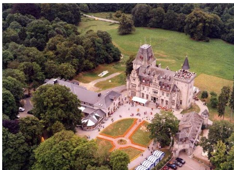
Slika 18. Radhadesh (s desne strane se nalazi druga galerija MOSA-e u prvom dijelu kompleksa)

MOSA je nastavila svoje širenje kada je 2015. godine otvorila ogranak na toskanskim brežuljcima u Villi Vrindavan, nedaleko od Firence. U prizemlju tog Muzeja nalazi se izložba slika umjetnika Jnananjane koja prikazuje razne događaje i epizode iz čuvenog indijskog epa