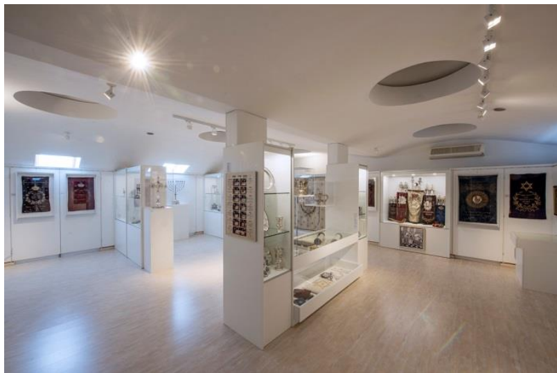
Slika 8, Izložbeni prostor Židovskog muzeja u Zagrebu