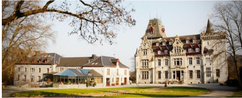
Slika 9. Radhadesh