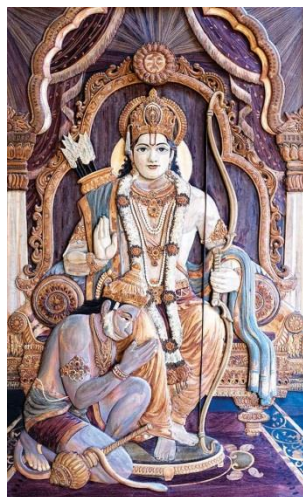
Slika 15. King Rama with Hanuman, His monkey warrior , P. Gowrajah