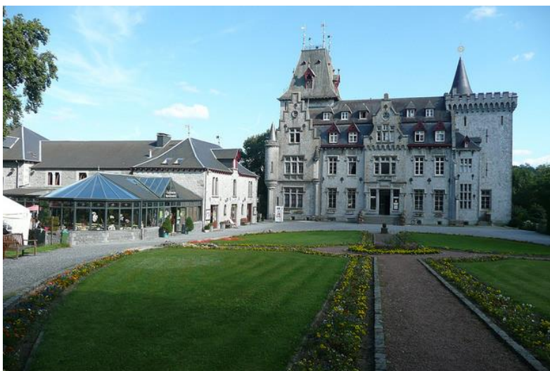
Slika 17. Radhadesh, glavni dio kompleksa (s lijeve strane možemo vidjeti prvu galeriju MOSA-e, koja se nalazi na prvom katu)