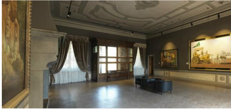
Slika 21. Izložbeni prostor MOSA-e u Villi Vrindavan 2

U razgovoru s Martinom Gurvichem, kustosom MOSA-e, saznali smo kako je u ožujku 2018. otvoren i ogranak MOSA-e u New Jagannath Puriju, na Tenerifima, a u tijeku su i pregovori oko otvaranja daljnjih ogranaka u Hagu, na mađarskoj ISKCON farmi i u Portugalu. U planu je također gradnja nove zgrade, koja bi se nalazila pokraj prve galerije u Radhadeshu i koja bi služila za izlaganje stalnog postava.