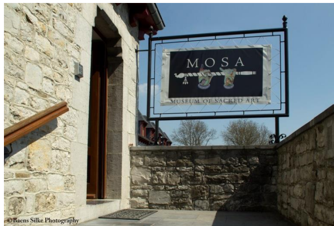
Slika 10. Ulaz u MOSA-u s prikazom zaštitnog znaka muzeja