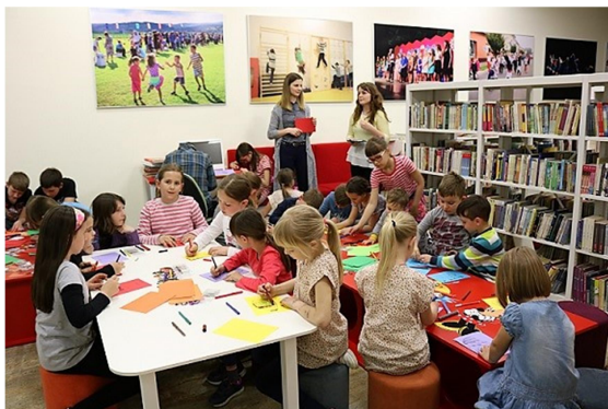
Slika 16. Promocija projekta Svijet kroz dječje oči Društva naša djeca Pleternica

vrćica i prvih razreda u Mjesecu knjige posjećuju knjižnicu te sudjeluju u radionicama, edukativnim obilascima i postaju članovi knjižnice. Suvremena tehnologija na raspolaganju je djeci, ali i odraslim te se u prostoru knjižnice mogu služiti stolnim, ali i tablet računalima. Prostor knjižnice nudi i mogućnost cjeloživotnog obrazovanja te se u prostoru knjižnice provode i edukacije koje organiziraju udruge putem europskih i nacionalnih potpora, ali i u organizaciji knjižničara. Knjižnica u suradnji s udrugama Hrvatsko žensko društvo, Društvo naša djeca Pleternica, Udruga za pomoć djeci s poteškoćama u razvoju „Osmjeh“ te Udruga Radost, ali i ustanovama svoj prostor pretvara za učenje i individualno usavršavanje iz područja povijesti, psihologije, pedagogije i dječjih prava.