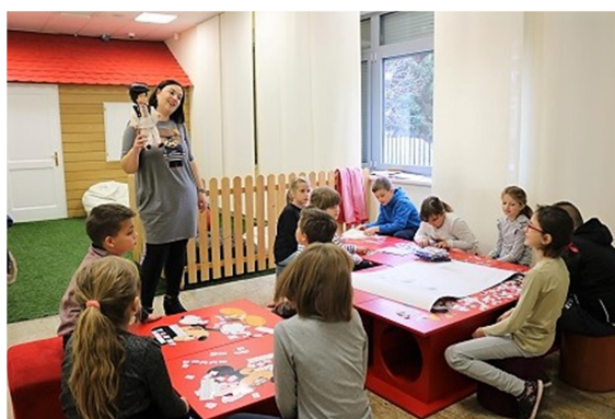
Slika 14. Škola bećarca za djecu