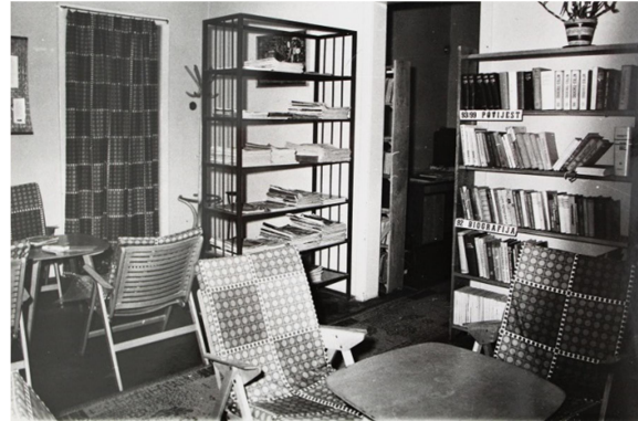
Slika 6. Prostor knjižnice u Mjesnom uredu