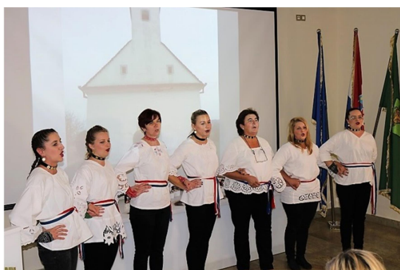
Slika 13. Bećarac u Pleternici, nastup KUD-a Svilenka