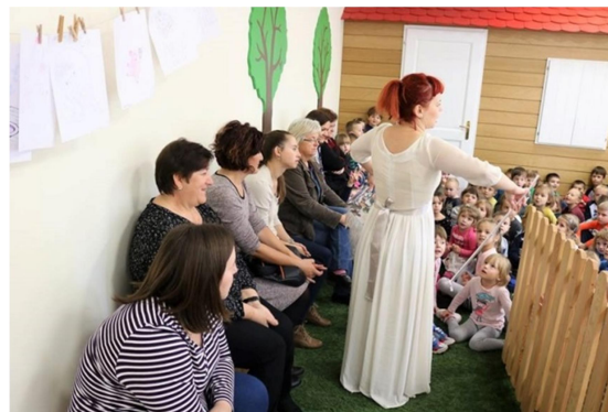
Slika 17. Posjet DV Tratinčica u Mjesecu hrvatske knjige

Knjižnica osim vlastitih aktivnosti sada pruža prostor i za održavanje raznih poslovnih seminara u organizaciji Grada Pleternice i Poduzetničkog centra Pleternica 107 te međunarodnih stručno edukacijskih simpozija poput Štamparovih dana u organizaciji Udruge narodnog zdravlja Andrija Štampar o zdravim stilovima života 108 , a posebno se ističe i